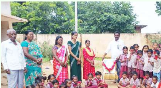
అక్షర విజేత కొండపాక ఉపాధ్యాయ దినోత్సవ జరిపారు.కొండపాక,దమ్మకర్పల్లి,మర్పదగ, దుద్దెర వేడుకలను మండలంలోని పలు పాఠశాలల్లో వెలికట్ల తదితర పాఠశాలల్లో కార్యక్రమాల గురువారం ఘనంగా నిర్వహించారు. ఈ సందర్భంగా విద్యార్థులు ఆయా స్థలంగా సర్వేపల్లి రాధాకృష్ణ ఛోటోకు నంద పాఠశాలలో ఉపాధ్యాయులను సత్కరించారు. పలు మాలలు వేసి జయంతి వేడుకలు పాఠశాలలో ప్రత్యేక కార్యక్రమాలు నిర్వహించారు.