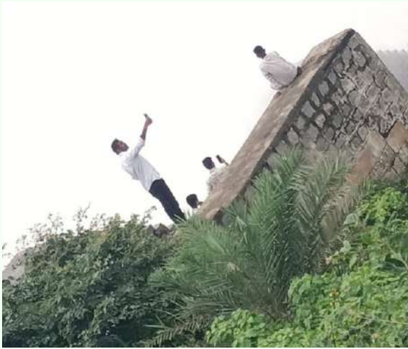
అక్షర విజేత నిజాంసాగర్ నిజాంసాగర్ ప్రాజెక్టు గేట్లు దిగువ నదిలో నీరు వదలడంతో ప్రాజెక్టు కింది భాగంలో ప్రమాదం అంచున్న సెల్ఫీలు నిజాం సాగర్ ప్రాజెక్టును చూడడానికి వచ్చిన వర్కాలకులు ప్రమాదమందినా సెల్ఫీ దిగుతున్నారని

-నిజాంసాగర్ ప్రాజెక్టు వద్ద ప్రమాదం అంచున సెల్ఫీలు దిగుతున్న యువకులు -వడ్డించుకోని పోలీసు అధికారులు