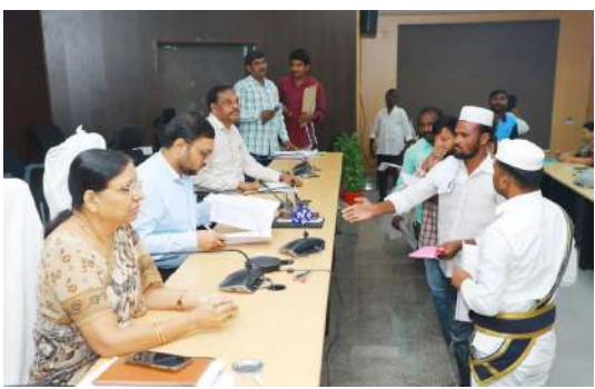
అక్షర విజేత సూర్యాపేట ప్రతినిధి హస్తల్, రెసిడెన్షియల్ పాఠశాలలను ప్రత్యేక అధికారులు సందర్శించారు...ప్రజావాణిలో 84 దరఖాస్తులు... ప్రజావాణి దరఖాస్తులు త్వరగతీసే పరిష్కారం...

సంక్షేమ హస్తల్, రెసిడెన్షియల్ పాఠశాలలకు కేటాయించిన ప్రత్యేక అధికారులు సందర్శించి సీజనల్ వ్యాధులు వ్యాపించకుండా పరిస్థితులు పరిశీలించి ఉంచేలా శానిటేషన్ చేపించాలని అలాగే హస్తల్ కి, పాఠశాలలకి సంబంధించి నివేదికలు అందజేయాలని కలెక్టర్ ఆదేశించారు.మహాత్మ జ్యోతి బాపూజీ ప్రజాభవన్ నుండి వచ్చే స్థానిక ప్రజావాణి దరఖాస్తులు అలాగే జిల్లా ప్రజావాణి లో వచ్చిన దరఖాస్తులను వెంటనే పరిష్కరించాలని కలెక్టర్ అధికారులకు సూచించారు. హైదరాబాద్ లోని మహాత్మా జ్యోతి బాపూజీ ప్రజాభవన్ లో జరిగే ప్రజావాణి కార్యక్రమం మంగళవారం తేది 10-9-2024 ను బుధవారం తేది 11-9-2024 కి వాయిదా వేయాలని ఆదేశించిన కలెక్టర్ సూచించారు.