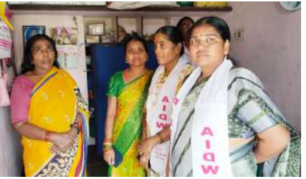
కూలిపోయే దిశలో ఉన్న ఇండ్ల కోసం ప్రత్యేక పోలీసులు నిర్వహిస్తుమని వారు హెచ్చరించారు.