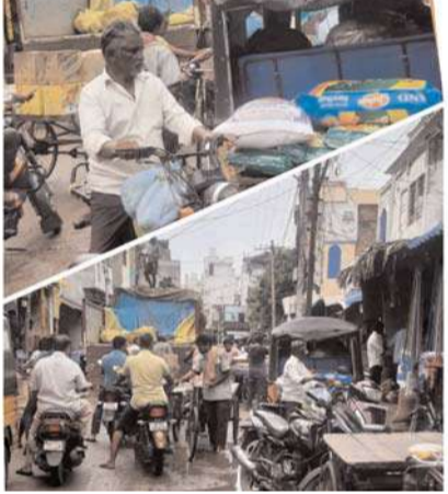
అక్షర విజేత చిలకలూరిపేట చిలకలూరిపేట పట్టణంలో మార్కెట్టు అనుకొని వున్న ప్రధాన బజార్లకు వెళ్లాలంటే

సరకం అగుబడుతుందని ప్రజలు వాపోతున్నారు. పట్టణంలోని బోస్ రోడ్డు, చలివేంద్ర బజారు, ఇనప కోట్ల బజారు, చౌత్ర సెంటర్ తదితర బజార్లకు కొనుగోలు నిమిత్తం వెళ్లాలంటే గంటలు గంటలు వేచి ఉండాల్సిందే. ఆ ఇరుకు గట్టులో కూడా ట్రాఫిక్ నియంత్రణ సరిగాలేదని అనేకమంది వాపోతున్నారు. పట్టణంలో చైత్ర సెంటర్, బోస్ రోడ్డు, ఇనప కోట్ల బజార్లలో పట్టపగలే లారీలు ఆపి లోడింగ్ అన్లోడింగ్ జరుపుతున్నారు. గతంలో ట్రాఫిక్ నియంత్రణ కొరకు సంబంధిత ట్రాఫిక్ నియంత్రించే అధికారులు లోడింగ్ను ఉదయం తొమ్మిది గంటల్లోపు చేసుకోవాలని తదుపరి రాత్రి 9:00 తర్వాత మాత్రమే లారీలు ఆ ప్రాంతానికి వచ్చేట్లు ఏర్పాటు చేశారు. అయితే ఇది గత కొన్ని నెలలుగా నిబంధనల అమలుకు నోచుకోక పట్టపగలే లారీలు లోడింగ్ అన్లోడింగ్ చేయటం ఆటో వారొచ్చి సామాన్ లెక్కిస్తూ రోడ్లకు అడ్డంగా పెట్టడం వల్ల ఆయా ప్రాంతాల్లో అనేకమంది ఇబ్బందుల ఫాలు అవుతున్నారు. సంబంధిత పోలీసు అధికారులు ఇప్పటికైనా ట్రాఫిక్ నియంత్రణ చేసి లోడింగ్ అన్లోడింగ్ సమయాలను తెలియజేసి ఆ ప్రాంతాల్లో ట్రాఫిక్ లేకుండా చేయాలని పలువురు ప్రజలు పోలీస్ అధికారులను కోరుచున్నారు.