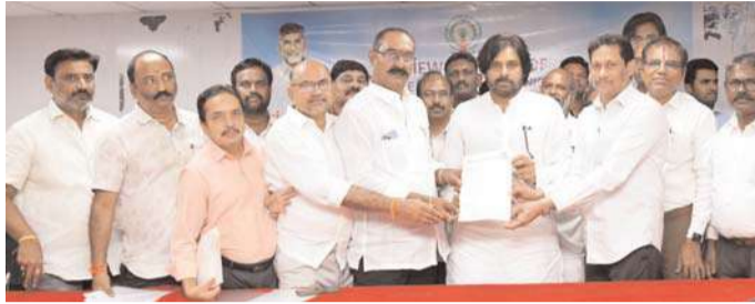
రూపాయలు, గ్రామీణ నీటిపారుదల శాఖ ఉద్యోగులు 10 లక్షల రూపాయలు ముఖ్యమంత్రి సహాయ నిధికి అందజేస్తున్నట్లుగా తమ లేఖ ద్వారా తెలియజేశారు, ఈ సందర్భంగా డిప్యూటీ సీఎం పవన్ కళ్యాణ్ ఉద్యోగులను ఆభినందించారు.

వరద బాధితుల సహాయార్థం ఆంధ్రప్రదేశ్ ముఖ్యమంత్రి సహాయ నిధికి కోటి రూపాయల విరాళం ప్రకటించి మరోసారి తన పెద్ద మనసు చాటుకున్నారని ఏపీ డిప్యూటీ సీఎం పవన్ కళ్యాణ్, అలాగే రాష్ట్రంలో ముంపునకు గురైన ప్రతి పంచాయతీకి లక్ష రూపాయలు చొప్పున 400 గ్రామ పంచాయతీలకు విరాళంగా నాలుగు కోట్ల రూపాయలను వ్యక్తిగతంగా ప్రకటించారు. అలాగే తెలంగాణ ముఖ్యమంత్రి సహాయ నిధికి కోటి రూపాయల విరాళం పవన్ కళ్యాణ్ ప్రకటించగా మరోపక్క డిప్యూటీ సీఎం పవన్ కళ్యాణ్ ఆధ్వర్యంలో పంచాయతీరాజ్ ఉద్యోగులు వరద బాధితులకు అండగా నిలిచారు, ఈ సందర్భంగా ముఖ్యమంత్రి సహాయ నిధికి తమ ఒక్కరోజు జీతాన్ని విరాళంగా ప్రకటించి పంచాయతీరాజ్ జాయింట్ యాక్షన్ కమిటీ డిప్యూటీ సీఎం కలిసి 1,64 వేల మంది ఉద్యోగుల ఒక్కరోజు మూలవేతనం 14 కోట్ల రూపాయలను, అలాగే పంచాయతీరాజ్ ఇంజనీరింగ్ విభాగం 75 లక్షల