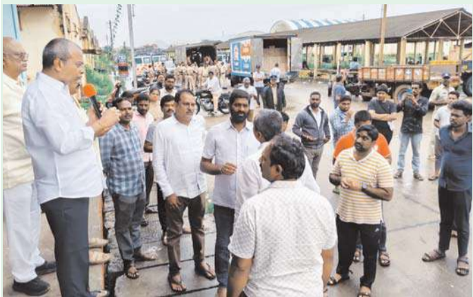
అక్షర విజేత మైలవరం ప్రతినిధి

ఎస్సీఆర్ జిల్లా, విజయవాడ రూరల్, మైలవరం నియోజకవర్గంలో వరద బాధితులకు సహాయక చర్యలు నిర్వహించి కొనసాగుతున్నాయి. నిరాశ్రయులైన వారికి ఆహారం, తాగునీరు, వస్తువులు, పానీయం పంపిణీ వసతులను సానిక ఎమ్మెల్యే వసంత వెంకట కృష్ణ ప్రసాద్, పర్యవేక్షిస్తున్నారు. గత ఐదు రోజులుగా గొల్లపూడిలోనే ఉంటూ అధికార, పార్టీ యంత్రాంగాన్ని సహాయతన చేస్తూ బాధితులను ఆదుకుంటున్నారు. విజయవాడ రూరల్ మండలంలోని జక్కంపూడి జె.ఎన్.ఎస్.యం.ఆర్.ఎం కాలనీతో పాటు, ఇల్లపాపంపట్ల మండలం, కొండపల్లి మున్సిపాలిటీలో వరద ప్రభావిత ప్రాంతాల్లో నిరాశ్రయులైన వారికి ప్రణాళికా బద్ధంగా పంపిణీ చేస్తున్నారు. రాష్ట్ర ప్రభుత్వం నుంచి వచ్చిన ఆహారపు ప్యాకెట్లను భారీగా పంపిణీ చేశారు. వరద బాధితులకు బుధవారం నాడు 56 వేల ఆహారపు ప్యాకెట్లు, 20 వేల యాపిల్స్, 15