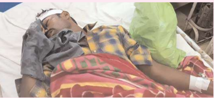
అక్షరవిజేత, రాయదుర్గం ప్రతినిధి