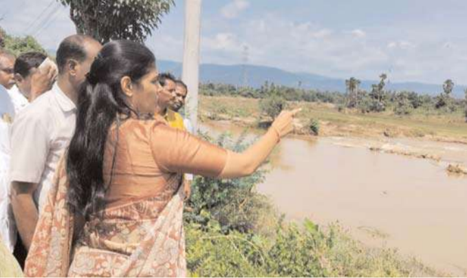
అక్షర విజేత కోటనందూరు.

వరద ప్రభావిత ప్రాంతాల్లో పర్యటించిన..... శాసనసభ్యురాలు దివ్య