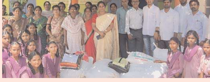
అక్షర విజేత రాయదుర్గం ప్రతినిధి