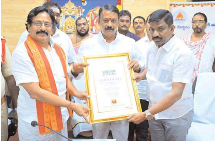
అక్షర విజేత, శ్రీశైలం :