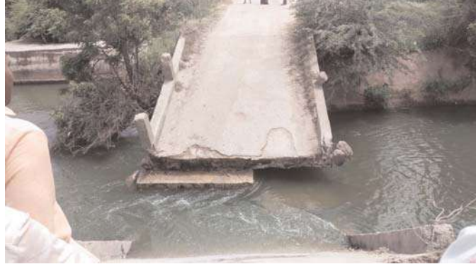
వైకాపా ప్రభుత్వంలో హెచ్ ఎల్ సి ఆధునీకరణ పనులకు ఒక పైసా నిధులు విడుదల చేయకపోవడంతో ఈ దుస్థితి నెలకొందని ఆయనకట్టు రైతులు, ప్రజలు ఆవేదన వ్యక్తం చేశారు.

రాయదుర్గం నియోజకవర్గం కణికల్లు మండలంలోని మాల్యం నాగేపల్లి గ్రామాల మధ్య తుంగభద్ర ఎగువ కాలువపై ఉన్న వంతెన కుప్పకూలింది. ఆ సమయంలో అటుగా ఏ వాహనం వెళ్లకపోవడంతో ప్రమాదం తప్పింది శుక్రవారం మధ్యాహ్నం ఈ సంఘటన జరిగినట్లు స్థానికులు తెలిపారు. వంతెన కూలే దశకు చేరుకున్నా సంబంధిత అధికారులు ఎవరూ పట్టించుకోక పోవడంతో కుప్పకూలిందన్నారు. వంతెన కూలడంతో రాకపోకలు పూర్తిగా నిలిచిపోయాయి.కనీకల్ హెచ్ ఎల్ సి సబ్ డివిజన్ పరిధిలో ఇప్పటివరకు 7 వంతెనలు కుప్పకూలిపోగా, మరికొన్ని శిథిలావస్థలో కూలిపోవడానికి సిద్ధంగా ఉండటంతో ప్రజలు ఆవేదన వ్యక్తం చేశారు హెన్రీ నూర్, మీన హల్లి, నాగేపల్లి, కనీకల్ చెరువు వద్ద గల అవుట్ గ్రౌండ్ లైట్, మల్లికేతి వంతెనలు కూలిపోయినా జగన్ ప్రభుత్వం పట్టించుకోలేదని ప్రజలు విమర్శిస్తున్నారు. వైకాపా ప్రభుత్వం హెచ్.ఎల్.సిని నిర్లక్ష్యం చేయడంతో వంతెనలు కూలిపోయినట్లు ఆరోపిస్తున్నారు.బద్దేళ్ల