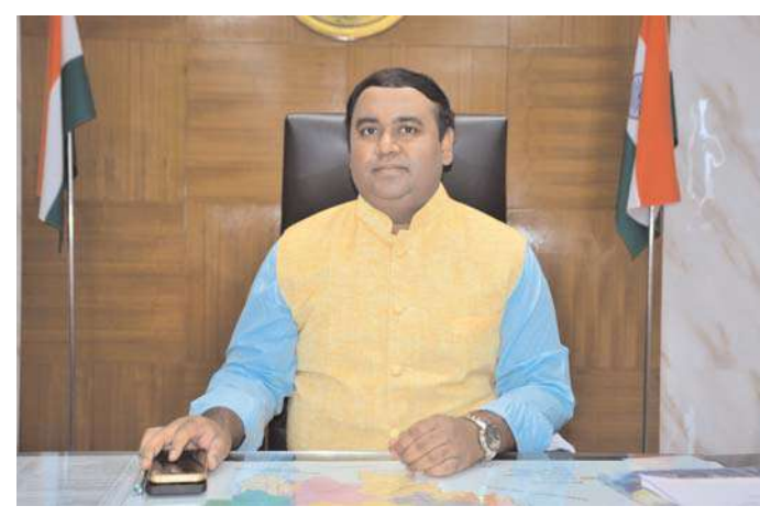
ముఖ్యఅతిథిగా హాజరువుతారని,అనంతరం ముఖ్యఅతి సందేశం, ఉంటుందన్నారు.