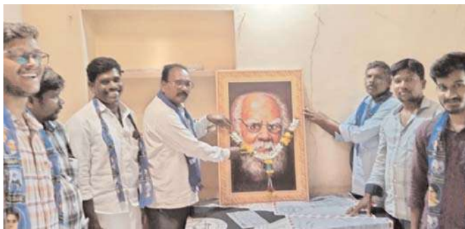
సమాజ్ పార్టీ నాయకులు సమావేశం జరగబోతుంది అన్నారు. రాయదుర్గం నియోజకవర్గంలో సంబంధించిన బిసి వర్గానికి చెందిన ప్రజలు నాయకులు మేధావులు ప్రతి ఒక్కరూ పాల్గొని ఈ కార్యక్రమాన్ని జయప్రదం చేయాలని కోరారు.