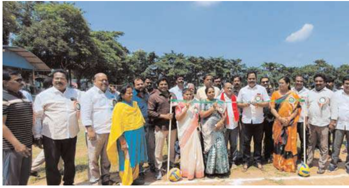
అక్షర విజేత దేవరపల్లి