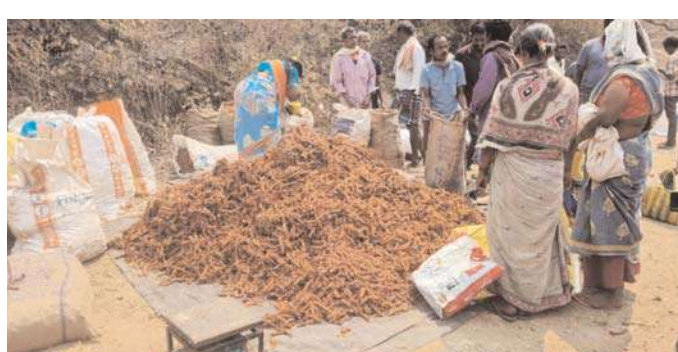
అక్షర విజేత అరకులోయ.

అరకులోయ కొన్ని సంవత్సరాల క్రితం దేదీపమాన్యంగా ఓ వెలుగు వెలిగిన గిరిజన సహకార సంస్థ నేడు పాలకులు పట్టించుకోక అధికారుల నిర్లక్ష్యంతో అచేతన స్థితికి చేరిపోయిందని గిరిజనులు చెప్పుకుంటున్నారు. గిరిజన సహకార సంస్థ అంటే గిరిజనులకు అన్ని విధాలుగా సహకారం అందించే సంస్థగా ఉండాలి. ఒకప్పుడు మాత్రం పేరుకు తగినట్లు గిరిజనులకు అనేక విధాలుగా సహకారం అందించి గిరిజన సహకార సంస్థ తన సార్వకత్తను నిలబెట్టుకునేది. అయితే వైసిపి ప్రభుత్వం అధికారంలోకి వచ్చిన తర్వాత గిరిజన సహకార సంస్థ పూర్తిగా నిర్లక్ష్యం అయిందని చెప్పవచ్చు. 1999లో చంద్రబాబు ప్రభుత్వం అధికారంలోకి వచ్చిన తర్వాత జిసిసి ఓ వెలుగు వెలిగిన విషయాన్ని గిరిజనులు ఎప్పటికప్పుడు చర్చించు కుంటుంటారు. 2009 నుంచి జిసిసి పతనం ప్రారంభమైందని చెప్పక తప్పదు. అప్పట్లో గిరిజనులు సేకరించే అటవీ వ్యవసాయ ఉత్పత్తులను జిసిసి కొనుగోలు చేసేది. చింతపండు, అడ్డాకులు, నల్ల జీడిపిక్కలు, తేనె, ఇలా అనేక వ్యవసాయ ఉత్పత్తులను కొనుగోలు చేసి గిరిజనులకు సహకారం అందించి గిరిజన సహకార సంస్థ పేరుకు తగినట్లుగా సార్వకత్తను నిలబెట్టుకునేది. అయితే కాలక్రమేన అధికారుల నిర్లక్ష్యం పాలకుల వైఖ్యంతో గిరిజన సహకార సంస్థ గిరిజన ఆశయాలను లక్ష్యాలకు తూట్లు పొడిచిందిని ఈ ప్రాంత గిరిజనులు ఎప్పటికప్పుడు విచారం వ్యక్తం చేస్తూనే ఉన్నారు. జిసిసి నిర్లక్ష్యం కావడంతో తాము సేకరించిన పండించిన అటవీ వ్యవసాయ ఉత్పత్తులను దళారులకు అమ్ముతూ నష్టాల ఊబిలో ఆదివాసులు కూరుకు పోతున్నారు. నెలనెల వేలాది రూపాయల్లో జీతాలు తీసుకుంటున్న జిసిసి అధికారులు తమ