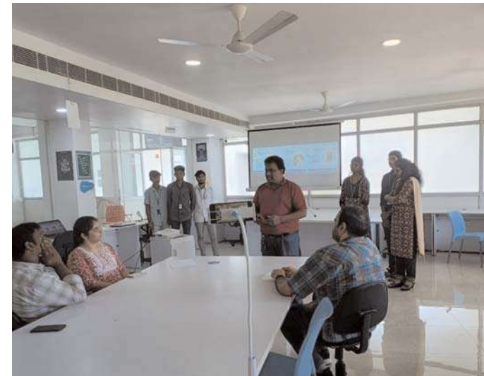
సంవత్సరం హ్యకథాన్ విద్యార్థులలో నూతన ఆవిష్కరణల స్ఫూర్తిని పెంపొందించడమే కాకుండా రాబోయే తరం సమస్యలను పరిష్కరించేవారికి, ఆవిష్కరణలకు సాధికారత కల్పించేందుకు ఎం.పి.జి.ఆర్ నిబద్ధతను బలపరిచిందని పేర్కొన్నారు. రాబోయే ఎన్.ఐ.హెచ్ 2024 కోసం బృందాలు సిద్ధపడుతున్న వేళ, సాంకేతికత మరియు వ్యవస్థాపకతలో శ్రేష్టత దిశగా ఎం.పి.జి.ఆర్ ప్రయాణంలో మరో అధ్యాయాన్ని గుర్తు చేస్తూ, ఆ ఉత్సాహం అందరిలో స్పష్టంగా కనపడతుందని ఆనందాన్ని వ్యక్తం చేశారు.