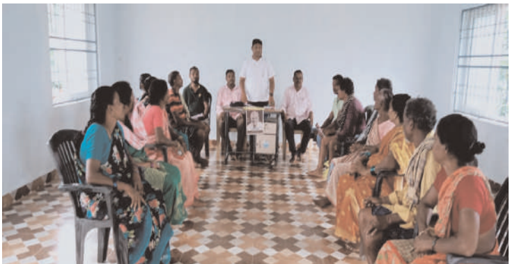
ఆళ్ల విజేత / బుట్టాయిగుడెం .