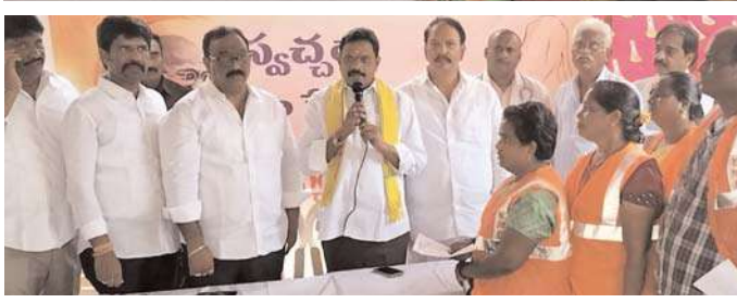
పారిశుధ్య కార్మికులు పాల్గొన్నారు.