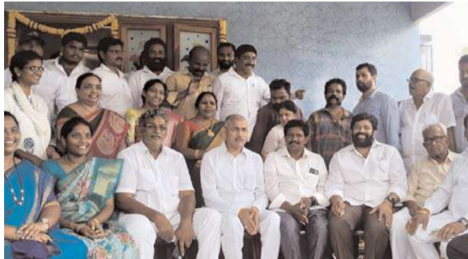
శ్రీశ్రీఖ, జి ఎమ్మెల్సీ శివరామకృష్ణ, కొన్నిలర్లు, ఎంపీపీలు, ఎంపీటీసీలు, గ్రామ సర్పంచులు, వైఎస్ఆర్పి నాయకులు కార్యకర్తలు అధిక సంఖ్యలో పాల్గొన్నారు