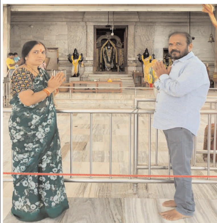
అక్షర విశేష, పాఠశాల పేట.