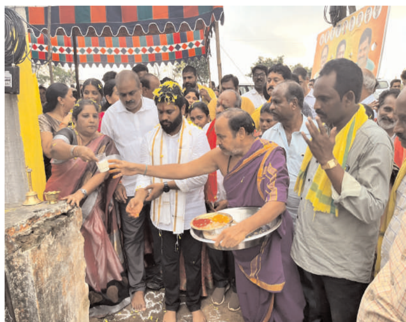
అక్షర విశేష, దేవరపల్లి