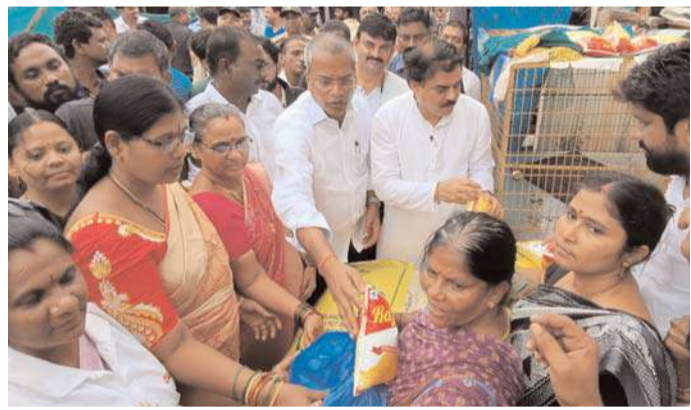
బాధితులకు ప్రభుత్వం అన్ని విధాలుగా అండగా ఉంటుందని వారు ప్రజలకు భరోసా ఇచ్చారు.

పౌరసరఫరాల శాఖ మంత్రి నాదెండ్ల మనోహర్ తో కలిసి వరద బాధితులకు రేషన్ నిత్యావసర వస్తువులను అందజేసిన మైలవరం శాసనసభ్యులు వసంత కృష్ణ ప్రసాదు. ఆదివారం నాడు మంత్రి మనోహర్, ఎమ్మెల్యే కృష్ణ ప్రసాదు, జనసేన నాయకులు అక్కల రామ్మోహన్ (గాంధీ) స్థానిక కూటమి నాయకులతో కలిసి ఇబ్రహీంపట్నం లోని ఫెర్రి, అట్లినీ కాలనీ తో పాటు పలు ప్రాంతాల్లో వరద బాధితులకు నిత్యావసర వస్తువులు పంపిణీ చేశారు. ఈ సందర్భంగా వారు మాట్లాడుతూ ముఖ్యమంత్రి చంద్రబాబు నాయుడు, ఉప ముఖ్యమంత్రి పవన్ కళ్యాణ్, అదేశాలతో చిట్టచివరి వరద బాధితుడి దాకా నిత్యావసర సరుకులు అందచేయడం తమ ప్రభుత్వ లక్ష్యమని స్థానిక నాయకులు సహకారంతో నిరంతరాయంగా వరద బాధితులకు సరుకులు పంపిణీ జరుగుతుందని తెలిపారు. ఇంతటి వక్ర విపత్తును సైతం ముఖ్యమంత్రి చంద్రబాబు తమ సమర్థతతో ఎదుర్కొంటూ నిరంతరం ప్రజలకు అండగా నిలిచారని నియం చంద్రబాబు, సారధ్యం లో పనిచేయడం చాలా సంతోషంగా ఉందన్నారు. వరద