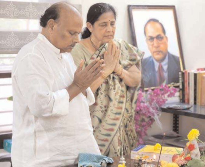
అక్షర విజేత కోటనందూరు.