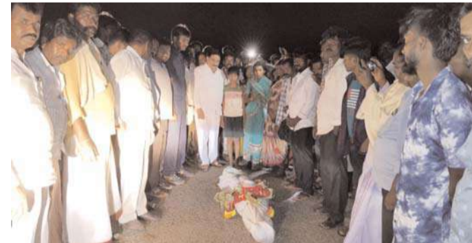
కఠిన శిక్ష పడేలా చూడాలని కోరారు. యువతి కుటుంబానికి ప్రగాఢ సానుభూతి వ్యక్త పరచారు.