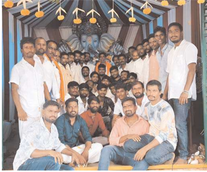
ఉత్సవ కమిటీ సభ్యులు తెలిపారు.