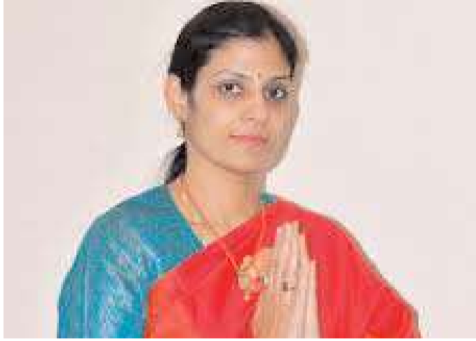
మున్సిపల్ యంత్రాంగాలను ఎమ్మెల్యే దివ్య ఆదేశించారు

బంగాళాఖాతం ఏర్పడ్డ వాయు గుండం ప్రభావంతో తుని నియోజకవర్గంలో గత రాత్రి నుంచి ఓం మోస్తరు వర్షం పెడుతూనే ఉంది. ఇవాళ, రేపు భారీ వర్షాలు ఉంటాయని వాతావరణ శాఖ హెచ్చరికల నేపథ్యంలో తుని నియోజకవర్గ ప్రజలు అప్రమత్తంగా ఉండాలని ఎమ్మెల్యే యనమల దివ్య కోరారు. ఇప్పటికే పంపా, తాండవ జలాశయాల నీటిమట్టాలు గరిష్ట స్థాయికి చేరువలో ఉన్నందున ఈరెండు నదుల దిగువున ఉన్న ప్రజలు అప్రమత్తంగా ఉండాలని ఆమె కోరారు. మరో వైపు జలాశయాల ఇన్ ఫ్లో ఎప్పటికప్పుడు పర్యవేక్షించాలని ఇన్ ఫ్లో బట్టి ఆదనపు నీటిని తక్కువ పరిమాణంలో నదుల్లోకి విడుదల చేయాలని సూచించిన ఎమ్మెల్యే దీని వల్ల కొంత వరకు ముంపు నుంచి బయట పడవచ్చన్నారు. పంటలు దెబ్బతినకుండా ముందు జాగ్రత్తలు తీసుకోవాలని జలవనరుల శాఖ అధికారులను ఎమ్మెల్యే దివ్య ఆదేశించారు. అలాగే అనుకోకుండా భారీ నుంచి అతి భారీ వర్షాలు పడితే తాండవ, పంపా నదులు పరవళ్ళలతో లోతట్టు ప్రాంతాలు ముంపు బారిన పడే ప్రమాదం ఉందని, అధికారులు చాలా అప్రమత్తంగా ఉండాలని ఆమె సూచించారు. అవసరమైతే పునరావాస కేంద్రాలు సిద్ధంగా ఉంచుకోవాలి రెవెన్యూ,