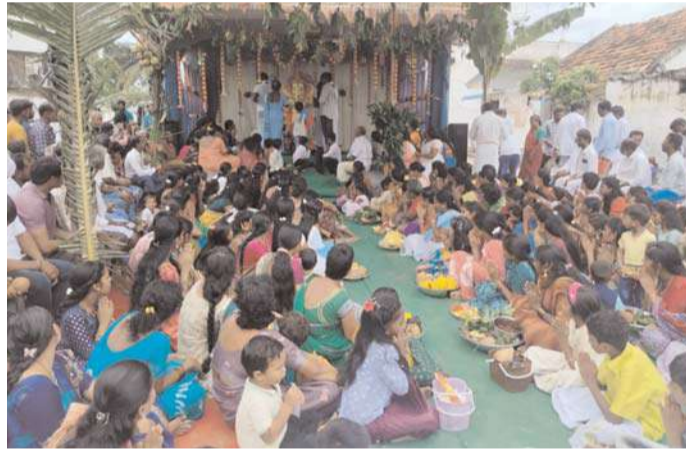
పెద్దలు, గ్రామ ప్రజల సహాయ సహకారాలతో ఈ వినాయక ఉత్సవాలను నిర్వహిస్తున్నారు. ఏఏఏ

మండలంలోని వెంకటనగరం పంచాయతీ రాజానగరంలో శనివారం వినాయక చవితి వేడుకలు ఘనంగా నిర్వహించారు. గ్రామంలోని “ శ్రీ శ్రీ శ్రీ నూకాలమ్మ గ్రామ అభివృద్ధి కమిటీ “ ఆధ్వర్యంలో రామాలయం వద్ద ఈ వేడుకలు ఘనంగా జరిగాయి. రాజానగరం గ్రామంలో గతంలో వినాయక చవితి పండుగ సందర్భంగా సుమారు ఆరు, ఏడు వీధుల్లో గణనాథుని మండపాలు ఏర్పాటు చేసుకొని ఆయా వీధుల్లోని ప్రజలు ఉత్సవాలు జరుపుకొనేవారు. అయితే ఈ ఏడాది గ్రామంలో ఓకే చోట రామాలయం వద్ద గణేశుని ఉత్సవాలు గ్రామ ప్రజలంతా ఐకమత్యంగా జరుపుకోవాలని “ శ్రీ శ్రీ శ్రీ నూకాలమ్మ గ్రామ అభివృద్ధి కమిటీ “ సభ్యులు తీర్మానించారు. దీనికి గ్రామస్థులు అందరూ అంగీకరించడంతో రామాలయం వద్ద లంబోదరుడి ఉత్సవాలను ఘనంగా నిర్వహించారు. వినాయకుడి భారీ విగ్రహాన్ని రామాలయం వద్ద ఏర్పాటు చేశారు. తెల్లవారుజాము నుంచే పెద్ద సంఖ్యలో భక్తులు మండపం వద్దకు చేరుకొని తమ కోరిన కోర్కెలు తీర్చే ఏకదంతుడుకి భక్తి శ్రద్ధలతో పూజలు చేసి, ప్రసాదాలు స్వీకరించారు. గ్రామ