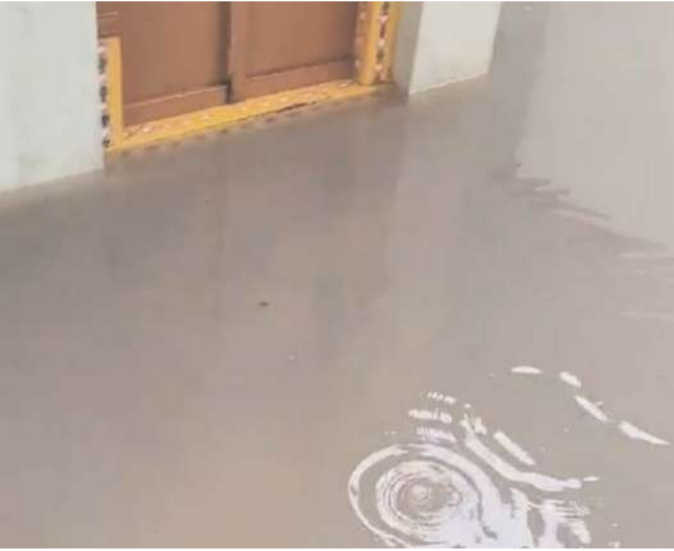
అక్షర విజేత, దేవరపల్లి

తూర్పుగోదావరి జిల్లా గోపాలపురం నియోజకవర్గం దేవరపల్లి మండలం యర్నూడెం గ్రామంలోని ఎస్సీ ఏరియా పల్లపుతాల్డి ప్రాంతంలో డ్రైనేజీ వ్యవస్థ సరిగా లేకపోవడంతో ఆప్రాంత వాసులు తీవ్ర ఇబ్బందులు పడుతున్నామని వాపోతున్నారు. డ్రైనేజీ వ్యవస్థ పూడుకుపోవడం ఆక్రమణలకు గురికావడంతో కొద్దిపాటి వర్షానికే నీరు పొంగి పొర్లుతూ