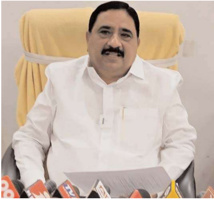
ఆయన సహకరించకుండా విమర్శించడం సరికాదన్నారు. బుడమేరు ఆధునికీకరణ కోసం, గట్టను పటిష్టం చేయడంతో పాటు ఆ నీటిని దాదాపు 37 వేల క్యూసెక్కుల నీరు వచ్చిన నేరుగా కృష్ణ నదిలో చేరి విధంగా 2017-18 లో చంద్రబాబు నాయుడు రూ. 220 కోట్లు మంజూరు చేయడం జరిగిందన్నారు. జగన్మోహన్ రెడ్డి అధికారంలోకి వచ్చాక వాటిని నిలిపివేశారని ఎమ్మెల్యే కాలవ శ్రీనివాసులు తెలిపారు