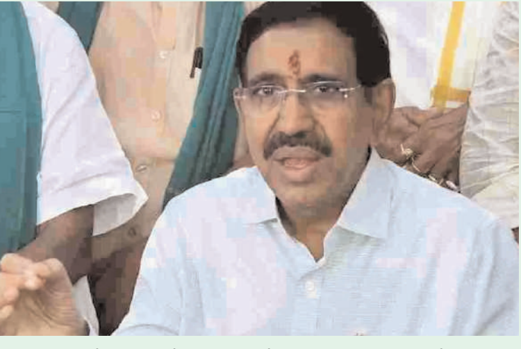
చెప్పారు. బుడమేరు మూడో గండిని పూర్ణేందుకు సైన్యం రంగంలోకి దిగిందని తెలిపారు. మరో 24 గంటల్లో పారిశుద్ధం పనులు కూడా పూర్తయ్యేలా ప్రభుత్వం చర్యలు తీసుకుంటోందని చెప్పారు.

అక్షర విజేత, విజయవాడ విజయవాడలో ముమ్మరంగా కొనసాగుతున్న సహాయక చర్యలు యాపిల్స్, బిస్కెట్లు, పాలు, వాటర్ బాటిల్స్ తో కూడిన ప్యాకెట్లు పంపిణీ చేస్తున్నామన్న నారాయణబుడమేరు మూడో గండిని పూర్ణేందుకు సైన్యం రంగంలోకి దిగిందని వెల్లడివిజయవాడ ఇన్ఫర్మేషన్ కోలుకుంటోంది. వరద బాధితులకు సహాయక చర్యలు ముమ్మరంగా కొనసాగుతున్నాయి. బాధితుల కోసం పలు రకాల ఆహార పదార్థాలతో రాష్ట్ర ప్రభుత్వం ప్యాకెట్లు తయారు చేయించి పంపిణీ చేయిస్తోంది. ప్యాకింగ్, పంపిణీ తీరును మున్సిపల్ శాఖ మంత్రి నారాయణ పరిశీలించారు. ఈ సందర్భంగా మీడియాతో నారాయణ మాట్లాడుతూ... ఒక్కో ప్యాకెట్ లో 6 యాపిల్స్, 6 బిస్కెట్ల ప్యాకెట్లు, 2 లీటర్ల పాల ప్యాకెట్లు, 3 నూడిల్స్ ప్యాకెట్లు, 2 లీటర్ల వాటర్ బాటిల్స్ ఉన్నాయని తెలిపారు. నిత్యావసర సరుకులతో కూడిన కిట్లను కూడా అందిస్తామని