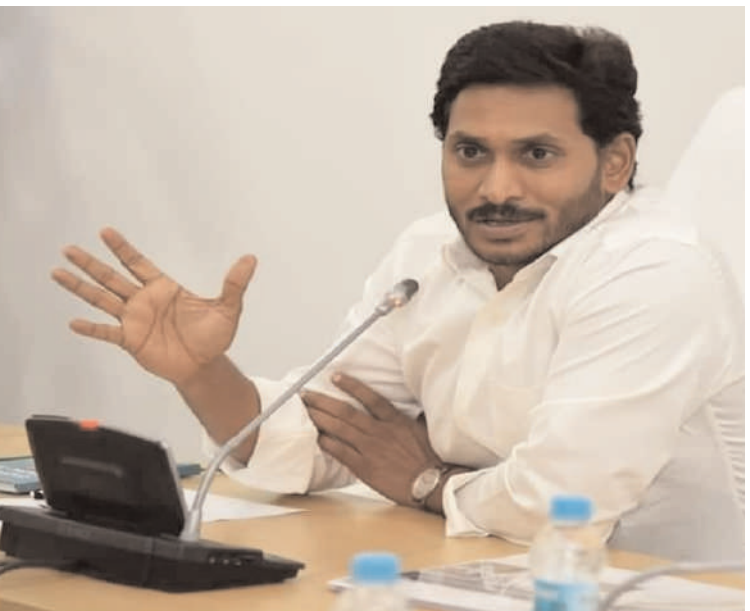
పాస్ పోర్టును రద్దు చేసుకుని డిప్లొమాట్ పాస్ పోర్టు తీసుకున్నారు. ముఖ్యమంత్రిగా ఎప్పుడు రాజీనామా

హైదరాబాద్ అక్షర విజేత, వైసీపీ అధినేత జగన్మోహన్ రెడ్డి మూడో తేదీన కుటుంబసమేతంగా లండన్ వెళ్లాలని ఉన్నా.. ఆయన ఇంకా వెళ్లలేదు. ఏడో తేదీన వెళ్లారని వైసీపీ వర్గాలు చెబుతున్నాయి. కానీ ఆ రోజున కూడా వెళ్లే అవకాశం లేదని తెలుస్తోంది. దీనికి కారణం పాస్ పోర్టు ఇంకా చేతిలోకి రాకపోవడమే. అక్రమాస్తుల కేసులో నిందితుడిగా ఉన్న ఆయన పాస్ పోర్టును కోర్టులో సబ్ మిట్ చేయాల్సి ఉంటుంది. కోర్టు పర్మిషన్ ఇచ్చినప్పుడు తీసుకుని మళ్లీ సమయం ముగిశాక కోర్టులోనే సబ్ మిట్ చేయాలి. జగన్ 2019లో సీఎంగా బాధ్యతలు చేపట్టడంతో ఆయన డిప్లొమాట్ పాస్ పోర్టుకు అర్హత సాధించారు. తన ఆసలు