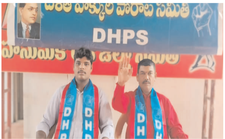
అక్షర విజేత హనుమకొండ బ్యూరో చీఫ్