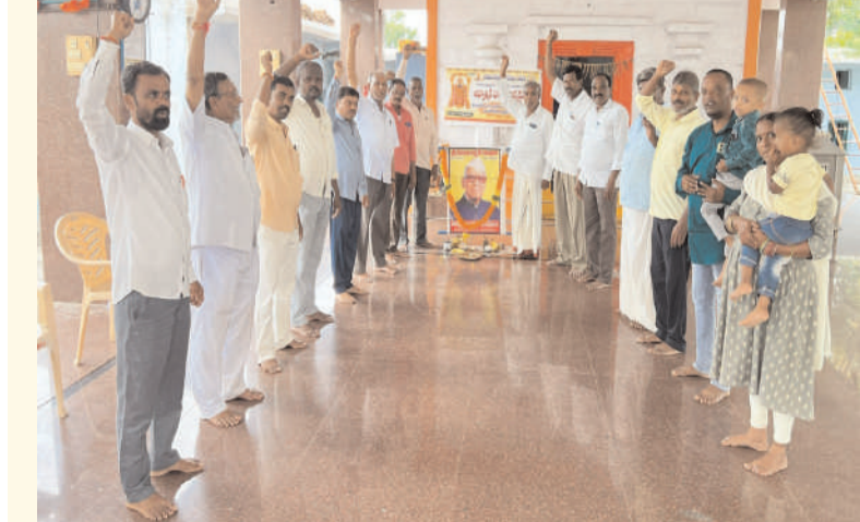
అక్షర విజేత నారాయణపేట /