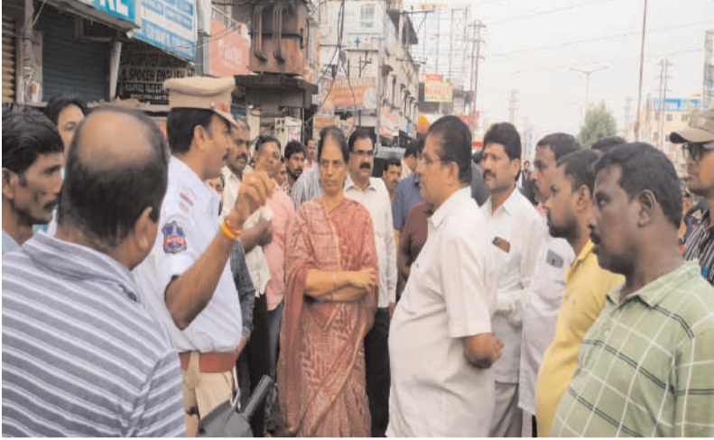
అక్షర విజేత మహేశ్వరం

- మాజీ మంత్రి, మహేశ్వరం ఎమ్మెల్యే సబితా ఇంద్రారెడ్డి