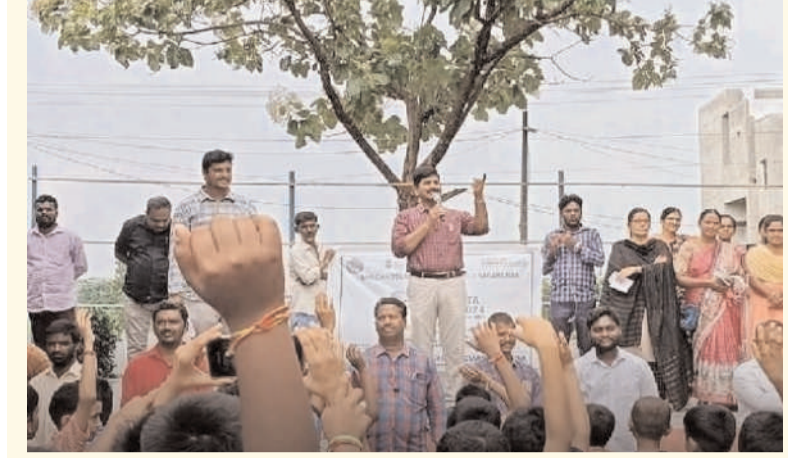
అక్షర విజేత, దేవరకొండ టౌన్