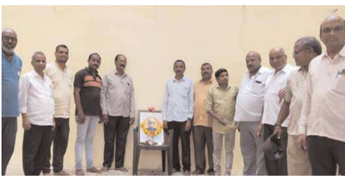
పోసి పద్మశాలిలకు గుర్తింపు తీసుకువచ్చిన ఉద్యమ నేత అని పేర్కొన్నారు. సమస్యలపై కొండ లక్ష్మణ్ బాపూజీని ఆదర్శంగా తీసుకొని ఆయన అడుగుజాడల్లో ముందుకు సాగుతూ తమ వంతు కృషి చేయాలని తెలిపారు.