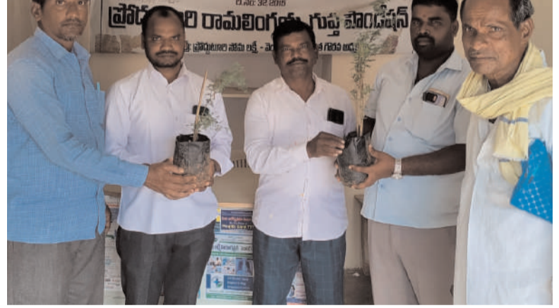
అక్షర విజేత, ఇబ్రహీంపట్నం :-