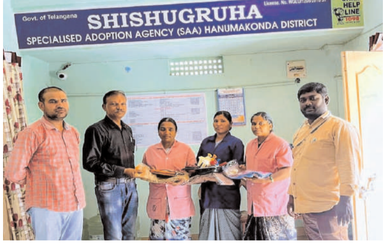
అక్షర విజేత హనుమకొండ బ్యూరో చీఫ్