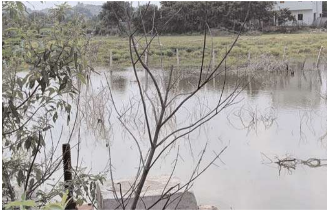
కానీ రెవెన్యూ శాఖ నుంచి లేఖ రావాలని పోలీస్ శాఖ భీష్ముచుకుని కూర్చున్నది. ఇలా ఎవరికివారు అలీ చెరువు అక్రమణ విషయాన్ని పక్కకు నేడుతూ కాలం గడుపుతున్నారు. కబ్జా అక్రమణ పై వెంటనే సంబంధిత అధికారులు స్పందించి కబ్జాలను తొలగించి చెరువును కాపాడాలని స్థానిక ప్రజలు కోరుతున్నారు. అలీ చెరువు కబ్జా జరిగిందని విషయంపై మంచాల ఇరిగేషన్ ఏకా శారద వివరణ కోరగా అలీ చెరువు కబ్జాకు గురైన మాట వాస్తవమనని అక్కడ ఎఫ్ఐఎల్ బఫర్ జోన్లో బిల్డింగ్ నిర్మాణాలు జరుగుతున్నందున గతంలో పోలీసులకు సైతం ఫిర్యాదు చేశామని, పై అధికారుల ఆదేశానుసారం చర్యలు తీసుకుంటామన్నరు.

రంగారెడ్డి జిల్లా మంచాల మండలం కాగజ్ ఫూల్, ఆగపల్లి పరిధిలోని 25 ఎకరాల అలీ చెరువు కబ్జా కోరల్లో చిక్కుకు పోయింది. చుట్టు ప్రక్కల ప్రాంతాల రైతులకు, ప్రజలకు జీవనోపాధిగా ఉన్న ఈ చెరువు రోజు రోజుకు కుచించుకుపోతోంది. హైదరాబాద్ నగరానికి కూతవేటు దూరంలో ఉండడం, భూముల ధరలు పెరుగుతుండడంతో అక్రమారులు ఈ చెరువుపై కన్నేసారు. ఎన్ఆర్ డెవలప్మెంట్ అలీ చెరువును అక్రమించి వీల్లు, బిల్డింగులు నిర్మించారు. రిసార్ట్ తో పాటు పెద్ద ఎత్తున వీల్లు నిర్మిస్తున్న ప్రభుత్వ శాఖలు ఏదో ఒక మాట చెప్తూ కాలం గడుపుతున్నాయి. అయితే వాస్తవానికి అలీచెరువు అక్రమణపై ఈ ఏడాది ఏప్రిల్ 24న పోలీసులకు నీటిపారుదల శాఖ ఫిర్యాదు చేసింది. చెరువు ఎఫ్ఐఎల్, బఫర్ పరిధిలో ఎన్ ఆర్ డెవలప్మెంట్ అక్రమంగా నిర్మాణాలు చేపడుతున్నారని, కావున తగిన చర్యలు తీసుకోండి అని స్పష్టంగా ఇరిగేషన్ అధికారులు మంచాల పోలీసులకు ఇచ్చిన ఫిర్యాదులో పేర్కొన్నారు. ఎఫ్ఐఎల్ సైతం నెంబర్ 110/2024 తో సమయం దాటింది. అయినా గాని ఇప్పటివరకు దానిపై ఎలాంటి చర్యలు తీసుకోకపోవడం గమనార్హం. ఎఫ్ఐఎల్ నిర్ధారణ జరిగిన అలీ చెరువు ఎఫ్ టి ఎల్ నిర్ధారణను ఎన్ఆర్ డెవలప్మెంట్ ప్రశ్నిస్తూ న్యాయస్థానాన్ని ఆశ్రయించింది. కోర్టు ఎఫ్.టి.ఎల్ నిర్ధారించాలని చెప్పింది తప్ప అక్రమ నిర్మాణాలపై స్టే ఇవ్వలేదు దీంతో నీటిపారుదల శాఖ మరోసారి అధికారికంగా ఎఫ్ఐఎల్ ను నిర్ధారించే ప్రక్రియ నిర్వహిస్తే సరిపోతుంది. కానీ నీటిపారుదల శాఖ ఆ పని చేయదు. అలీ చెరువు కబ్జా జరిగిందని రుజువైనా