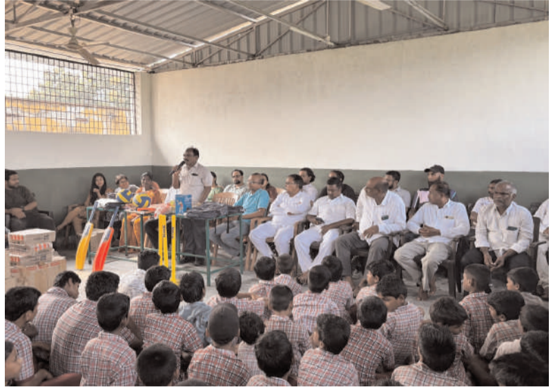
అక్షర విజేత పాపన్నపేట కోటివీటి ప్రైవేట్ కంపెనీ, యూత్ ఫర్ సేవా స్వచ్ఛంద సంస్థ వారు పాపన్నపేట