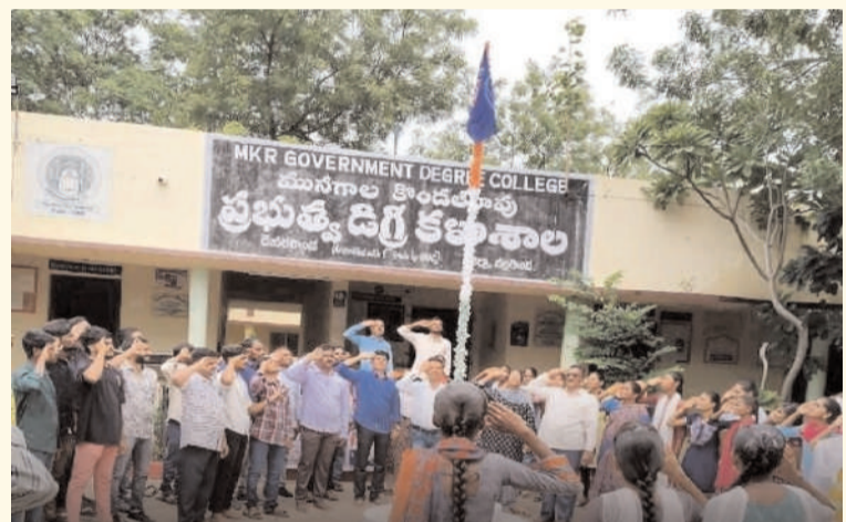
అక్షరవిజేత, దేవరకొండ రూరల్