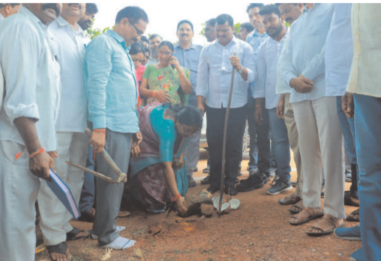
అక్షర విజేత చంద్రగిరి

భద్రాద్రి కొత్తగూడెం జిల్లా చంద్రగిరి మండల కేంద్రంలోని కస్తూర్బా గాంధీ బాలికల పాఠశాల పక్కనలో భాగంగా యాజమాన్యం విద్యార్థులు ఎమ్మెల్యే కి ఘన స్వాగతం పలికి శాలువాతో సత్కరించారు. గతంలో పాఠశాలను సందర్శించిన సందర్భంగా మౌలిక వసతులు సరిగా లేని విషయాన్ని ఎమ్మెల్యే స్వయంగా గమనించారు అలాగే ఉపాధ్యాయులు కూడా పాఠశాలలో పలు రకాల సమస్యలను ఎమ్మెల్యే దృష్టికి తీసుకురావడంతో సానుకూలంగా స్పందించి వసతుల కల్పనకు కృషి చేస్తానని హామీ ఇచ్చారు. ఇచ్చిన మాట ప్రకారం మౌలిక వసతుల కల్పన పాఠశాల అభివృద్ధి కోసం 47 లక్షల 50 వేల