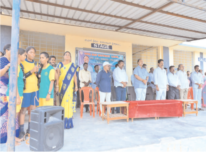
అక్షర విజేత ఉమ్మడి మహబూబ్ నగర్ బ్యూరో:

- ఎన్ జి ఎఫ్ అండర్ 14,17 బాలికల జిల్లా స్థాయి టోర్నమెంట్ను ప్రారంభించిన ఎమ్మెల్యే