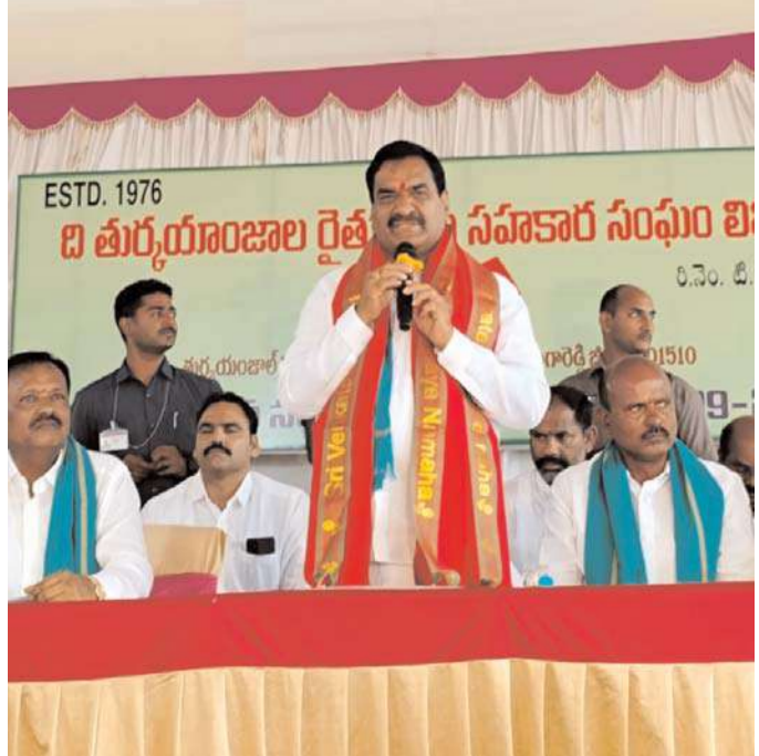
నాయకులు, రైతులు తదితరులు పాల్గొన్నారు.