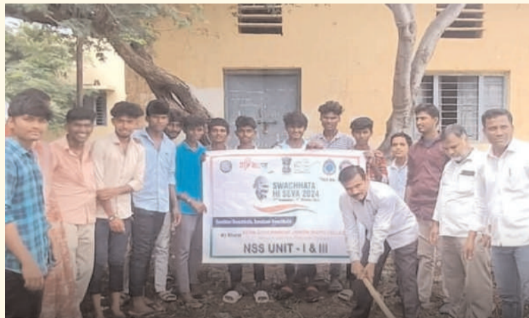
అక్షరవిజేత, దేవరకొండ రూరల్