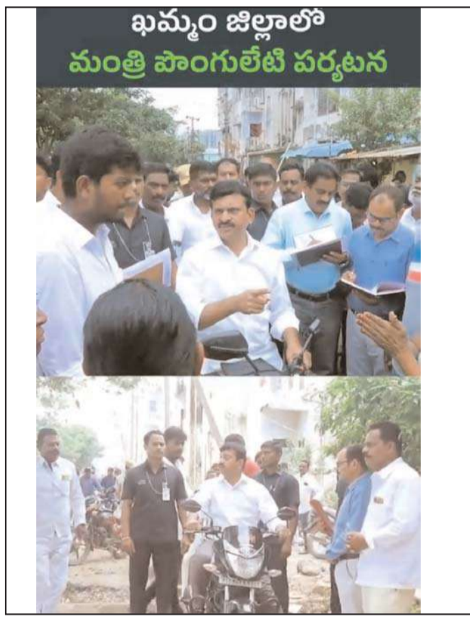
స్థాయిలో శుభ్రం చేయాలన్నారు. ముంపు ప్రాంతాల ప్రజలు ఎలాంటి ఆందోళన చెందవద్దని, అధికారులు మరోమారు సందర్శించి, నష్టపోయిన ప్రతిఒక్కరికి న్యాయం చేస్తారని మంత్రి తెలిపారు.