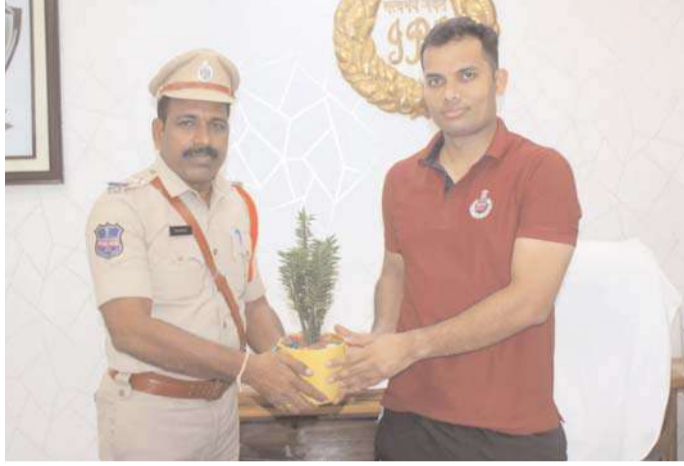
ఘటన జరిగిన సందర్భంలోనైనా సంఘటనా స్థలాలకు నిమిషాలలో చేరుకునే విధంగా ప్రతిక్షణం పూర్తి సన్నద్ధంగా ఉండాలని తెలిపారు

శనివారం సాయంత్రం స్థానిక జిల్లా ఎస్పీ క్యాంపు కార్యాలయం నందు నూతనంగా ఇచ్చోడ పోలీస్ స్టేషన్ నందు బాధ్యతలు స్వీకరించిన ఎస్పీ ఏ తిరుపతి జిల్లా ఎస్పీ గౌడ్ ఆలం ఐపిఎస్ మర్యాదపూర్వకంగా పూల మొక్క అందజేసి బాధ్యతలను స్వీకరించడం జరిగింది. 2020 బ్యాచ్ కి చెందిన ఏ తిరుపతి బాసర జోన్ లోని నిర్మల్ జిల్లాలోని ముద్గోల్ జగిత్యాల జిల్లాలోని సారంగాపూర్ జగిత్యాల పట్టణ ఎస్సెస్సెస్ గా విధులను నిర్వహించి ఇచ్చోడ పోలీస్ స్టేషన్ నందు శనివారం ఎస్ హెచ్ ఓ గా బాధ్యతలను స్వీకరించడం జరిగింది మంచిర్యాల దండేపల్లి మండలానికి చెందిన ఏ తిరుపతి 18 సంవత్సరాల పాటు ఆర్మీలో విధులను నిర్వహించి దేశానికి సేవలందించడం గర్వకారణం ఈ సందర్భంగా జిల్లా ఎస్పీ మాట్లాడుతూ ఇచ్చోడ మండలం జిల్లాలోని కీలకమైన పోలీస్ స్టేషన్లో ఒకటిని అసాంఘిక కార్యక్రమాలకు ఎలాంటి అవకాశం లేకుండా సంపూర్ణంగా కట్టడి చేస్తూ, 24 గంటలు అప్రమత్తంగా ఉంటూ విధులను నిర్వహించాలని ఎలాంటి అవాంఛనీయ