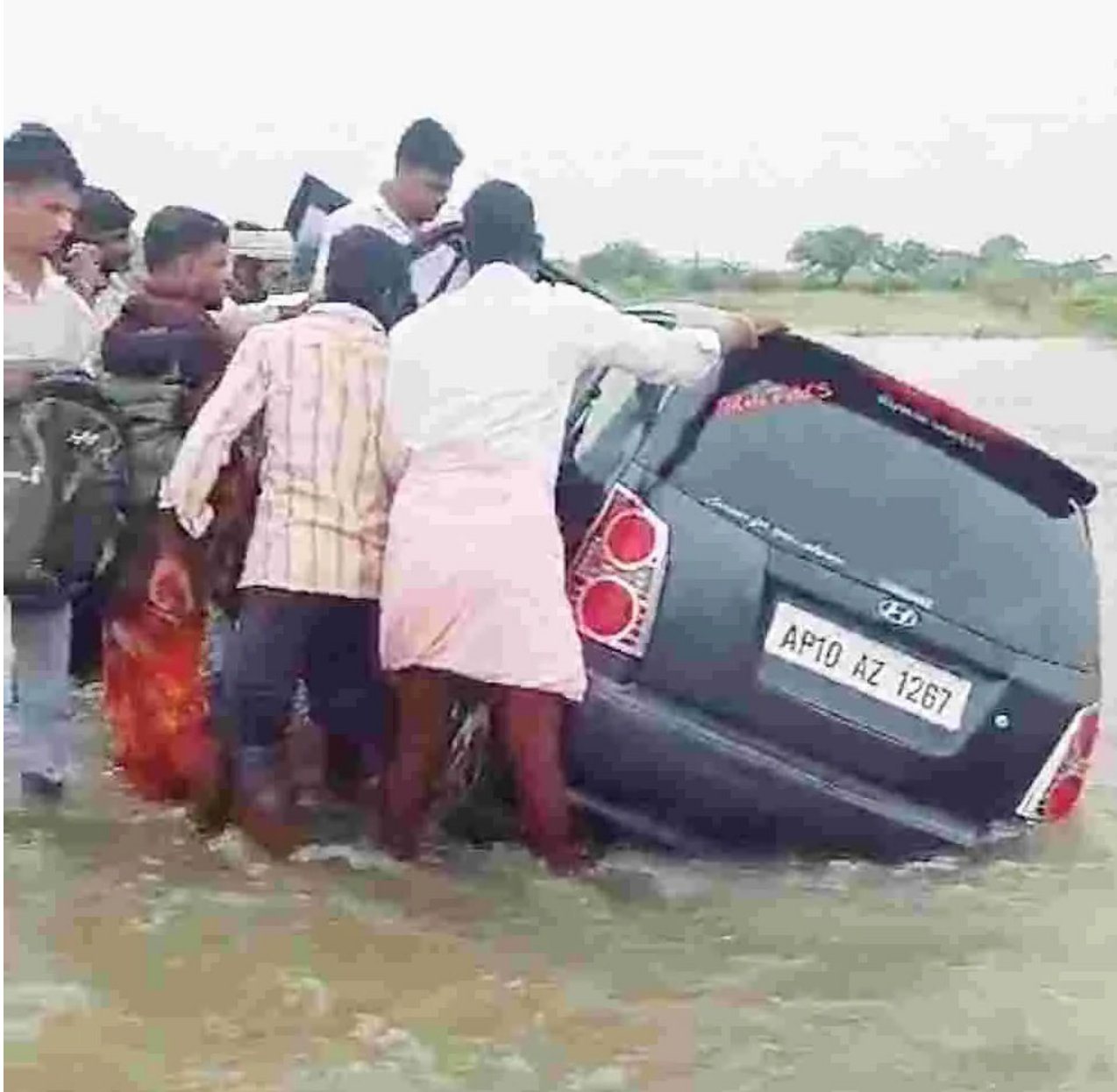
ఉమ్మడి జిల్లా వ్యాప్తంగా జోరు వర్షం స్తంభించిన జన జీవనం నిండి అలుగు పాలిన చెరువులు, వాగులు నీట మునిగిన పంటలు జోగుళాంబ గద్వాల, నారాయణపేట, నాగర్ కర్నూల్ జిల్లాల్లో నిలిచిన రాకపోకలు