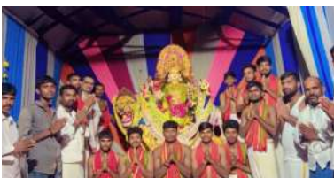
అక్షర విజేత,పెద్ద శంకరంపేట: పెద్ద శంకరం పేట మండలంలోని విరోజిపల్లి గ్రామం లో దుర్గా దేవి శరదపూజలకు పురస్కారముకుని శ్రీ దుర్గా భవని యాత్రి అసోసియేషన్ ఆధ్వర్యంలో,ప్రజల సహకారం తో

దేవి నవరాత్రులు ,ప్రత్యేక పూజలు కమ్మల పండుగగా జరుపుకుంటున్నారు. రూపాయల దండలతో మహాలక్ష్మి రూపంలో ప్రత్యేక అలంకరణలతో దర్శనమిచ్చుగా విశేషంగా ఉండటం తో ప్రజలు ఆలోచిక అనందం పొందుతారు.