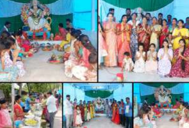
అక్షర విజేత రామకృష్ణాపూర్ రామకృష్ణాపూర్ పట్టణంలో దేవీ శరన్నవదాటి