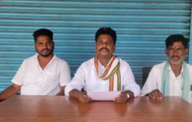
అక్షర విజేత నిజాంసాగర్ తెలంగాణ రాష్ట్ర ప్రభుత్వం ఏర్పాటు చేయనున్న ఇంటిగ్రేటెడ్ రెసిడెన్షియల్ స్కూల్స్ మొదటి మొదటి ఒక స్కూల్ అక్కర్లే నియోజకవర్గంనుకే కేటాయించాలని రాష్ట్ర ముఖ్య మంత్రి కేసరి రెడ్డికి అక్కర్లే నియోజకవర్గం ప్రజలు కోరుతున్నారు. ఈ విషయమై శుక్రవారం నిజాంసాగర్ మండలంలోని మాగి గేటు వద్ద కాంగ్రెస్ పార్టీ నాయకులు

-కాంగ్రెస్ నాయకులు ప్రజా పండరి డిమాండ్ ప్రజా పండరి మీడియా సమావేశం ఏర్పాటు చేసి మాట్లాడారు.. పేద విద్యార్థులకు నాణ్యమైన విద్యను అందించాలనే ఉద్దేశ్యంతో రాష్ట్ర ప్రభుత్వం రూ. 5000 వేల కోట్లు రూపాయలతో నూతన హంగులతో అంతర్జాతీయ విద్యా ప్రమాణాలతో కూడిన విద్యను అందించడం కృషి చేస్తుంది, మొదటి దశలో 28 స్కూల్ లను ఏర్పాటు చేయడం సంతోషంగా ఉంది అన్నారు. అదేవిధంగా అక్కర్లే నియోజకవర్గం వెనుకబడిన ప్రాంతంగా ఉండటంతో పేద ప్రజల బిల్లులకు ఉన్నత విద్య అందే విధంగా అక్కర్లే నియోజకవర్గం కు ఒక స్కూల్ కేటాయించాలని కోరారు. అందుకు గాను నిజాంసాగర్ మండల కేంద్రంలో స్కూల్ ఏర్పాటు చేసేంత వరకు ఇంగ్లీష్ డిపార్ట్మెంట్ స్థలం 400 ఎకరాలు ఖాళీగా అందుబాటులో ఉందని తెలిపారు. దీంతో అక్కర్లే నియోజకవర్గం ప్రజలు విన్నపాన్ని మన్నించి రాష్ట్ర ముఖ్య మంత్రి కేసరి రెడ్డి అక్కర్లే ఏర్పాట్ల కోసం లక్ష కోట్ల అర్హతతో యంగ్ ఇండియా ఇంటిగ్రేటెడ్ రెసిడెన్షియల్ స్కూల్ ను నిజాంసాగర్ మండలంలో ఏర్పాటు చేయాలని కోరారు. ఈ కార్యక్రమంలో నాయకులు అంజయ్య, తదితరులు ఉన్నారు.