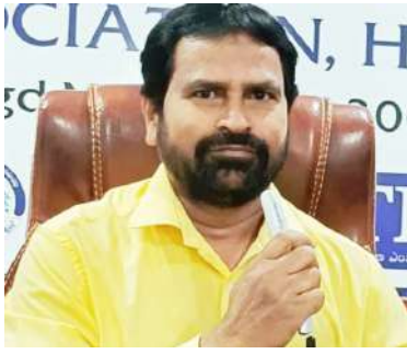
అక్షరవిజేత, కరీంనగర్: ఉద్యోగ ఉపాధ్యాయ పెన్షన్లకు సంబంధించిన 4 డీపలను దీపావళి పండుగ సందర్భంగా శత్రుణులు ప్రకటించాలని లేని