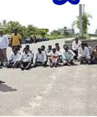
ప్రభుత్వం వెంటనే రి సర్వే చేపించి తమకు ఇళ్లను అప్పగించాలని కోరారు. ఆదే సమయంలో కేటీఆర్కు వ్యతిరేకంగా నిరాదాల చేశారు. నమ్మించినా నక్షీల ముంచారని ఆశ్చర్యం వ్యక్తం చేశారు.

దళితులకు అన్యాయం చేశారు. రాజకీయ జన్మనిచ్చిన జిల్లాకు వెన్నుపోటు పొడిచారని సిరిసిల్లలోని అంజేపల్లె సగర్లు చెందిన దళితులు అందోళనకు దిగడం కలకలం రేపింది. సుమారు 50 ఏళ్ల క్రితం కాంగ్రెస్ ప్రభుత్వం ఇందిరమ్మ ఇళ్ల కోసం 10 ఎకరాల స్థలం కేటాయించింది. ఆ భూములను గత టీఆర్ఎస్ ప్రభుత్వంలో అప్పటి మంత్రి ప్రస్తుత సిరిసిల్ల ఎమ్మెల్యే కేటీఆర్ కాకుండా. డబుల్ బెడ్ రూంలు నిర్మించి ఇస్తామని వాటిని తీసివేస్తున్నారనీ.. మొన్న కాటీవల్లి.. నిన్ను ధర్మపురి.. అయితే.. ఆ భూమిలో నిర్మించిన డబుల్ బెడ్ రూంలను ఇస్తామని అనేకమంది నాన్నకున్నారు. తీరా వాటిని దళితులకు కాకుండా వేరే వారికి ఇచ్చారు. అప్పటి అధికారులు అందడందలో తప్పిపోయారనీ ఆరోపించారు. కాంగ్రెస్