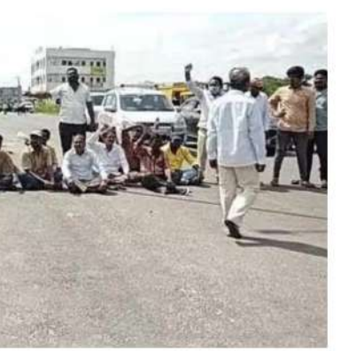
హైదరాబాద్లో మూసీ బాధితుల పక్షాన పోరాడుతున్న కేటీఆర్.. తన సొంత నియోజకవర్గంలో దళితుల జరిగిన అన్యాయంపై ఏ మాట్లాడుతారని ఆసక్తి వెలకొంది.