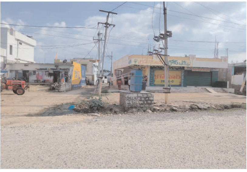
వస్తుందని ప్రజలు హెచ్చరిస్తున్నారు.

జోగులాంబ గద్వాల నియోజకవర్గం ధర్మూర్ మండల కేంద్రంలో విద్యుత్ శాఖ అధికారుల నిర్లక్ష్యంతో ఎప్పుడు ఏ ప్రమాదం సంభవిస్తుందో అని ప్రజలు భయందోలనకు గురవుతున్నారని ధర్మూర్ మండల కేంద్రంలో జాతీయ ప్రధాన రహదారిలో రోడ్డు పక్కనే ఉన్న విద్యుత్ ట్రాన్స్ఫార్మర్ కు కంచే లేక ప్రమాదకరంగా ఉంది ఫీజు బాక్స్ వైర్లు చేతికి అందేలా ఉండడంతో ఏ క్షణం ఏ ప్రమాదం జరుగుతుందోనని ప్రజలు భయాందోళన చెందుతున్నారని నిత్యం వందలాది వాహనాలు పాదాచారులు రాకపోకలు సాగిస్తూ ఉంటూ ట్రాన్స్ఫార్మర్ కు కంచే లేకపోవడంతో వాహనాదారులు ప్రమాదం భారిన పడే అవకాశం ఉందని స్థానికులు ఆందోళన చెందుతున్నారు మూగజీవాల విషయంలో మరింత జాగ్రత్త ఉండాలని వస్తుంది ఇప్పటికైనా విద్యుత్ అధికారులు నిర్లక్ష్యం వీడి ట్రాన్స్ఫార్మర్ చుట్టూ కంచే ఏర్పాటు చేయాలని స్థానికులు డిమాండ్ చేస్తున్నారని లేనిచో ఏదైనా ప్రమాదం జరిగితే మాత్రం విద్యుత్ అధికారుల బాధ్యత వహించాల్సి