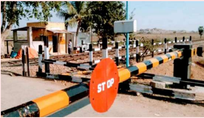
అక్షర విజేత ఉమ్మడి ఆదిలాబాద్ జిల్లా బ్యూరో చీఫ్:

మంచిర్యాల జిల్లా రామకృష్ణ పూర్ మండలం క్యాతనపల్లి మున్సిపాలిటీ పరిధిలోని రైల్వే గేటు ఏడు రోజులు మూసివేయనున్న రైల్వే శాఖ అధికారులు తెలిపారు. నవంబర్ ఒకటవ తేదీ నుంచి ఏడవ తేదీ వరకు గేట్ నెంబర్ -57 రైల్వే నిర్మాణ పనుల కోసం మూసివేయనున్నట్లు అధికారులు పేర్కొన్నారు. ప్రయాణికులు అధికారులకు సహకరించగలరని కోరారు.