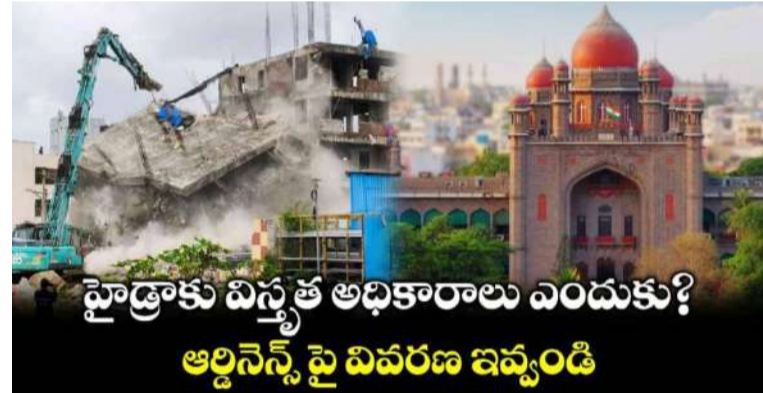
దాఖలు చేశారు. ఆర్డినెన్స్ చట్టవిరుద్ధమని, దాన్ని సస్పెండ్ చేస్తూ మధ్యంతర ఉత్తర్వులు ఇవ్వాలని కోరారు.