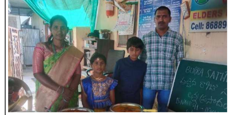
అక్షర విజేత సర్పంచ్