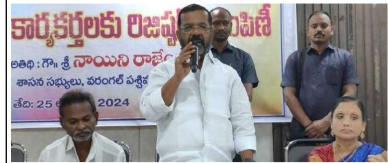
అక్షర విజేత హన్మకొండ బ్యూరో చీఫ్