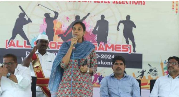
అక్షర విజేత హన్మకొండ జిల్లా బ్యూరో చీఫ్