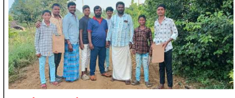
అక్షర విజేత నారాయణపేట జిల్లా/ ఉట్టూర్