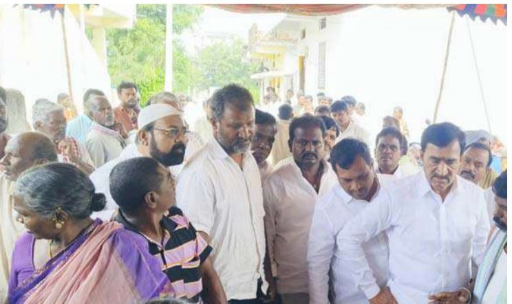
అక్షర విజేత గజ్జెల్ :