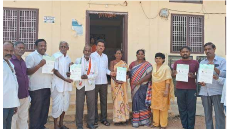
అక్షర విజేత - చిగురుమామిడి: