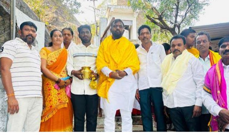
అక్షర విజేత, మోర్లాడ్ :

భీంగల్ మండల కేంద్రంలోని 'శ్రీ లక్ష్మీ నరసింహస్వామి' (లింబాద్ గుట్ట)