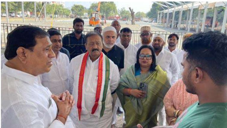
అక్షర విజేత, నిజామాబాద్ ప్రతినిధి :

మహారాష్ట్ర ఎన్నికల నేపథ్యంలో నాందేడ్లో 14వ నిర్వహించనున్న బహిరంగ సభ ఏర్పాట్లను తెలంగాణ రాష్ట్ర ప్రభుత్వ