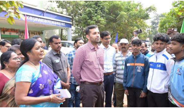
అక్షరవిజేత, వికారాబాద్ ప్రతినిధి