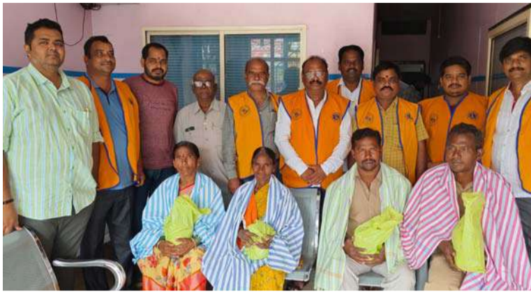
అక్షర విజేత, జనగామ ప్రతినిధి:

ప్రాణాపాయ స్థితిలో ఉన్న వారిని ఆదుకునే ప్రక్రియ రక్త దానం చేయడం త్యాగానికి ప్రతీక అని రెడ్ క్రాస్ సొసైటీ జనగామ జిల్లా కార్యదర్శి, లయన్స్