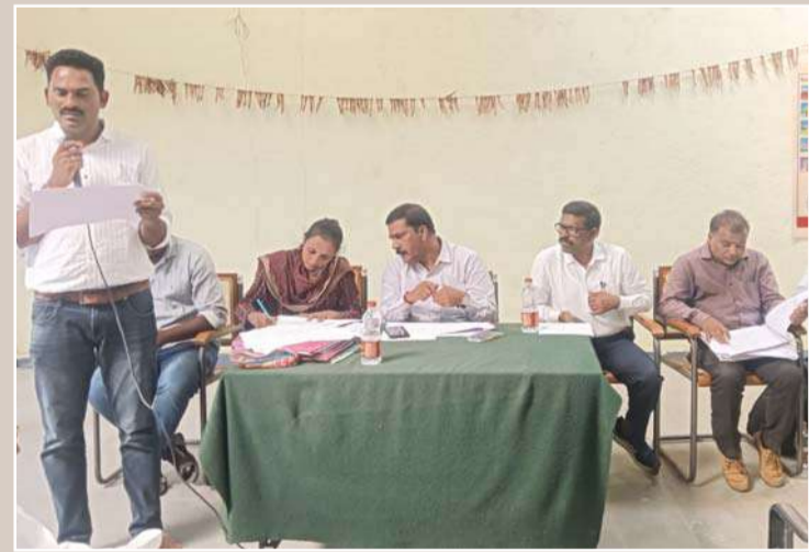
అక్షర విజేత - విగురుమామిడి: