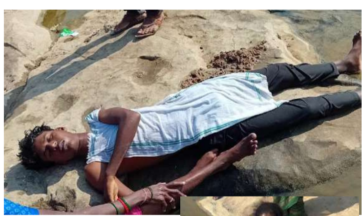
అక్షర విజేత, ఏర్పాటు