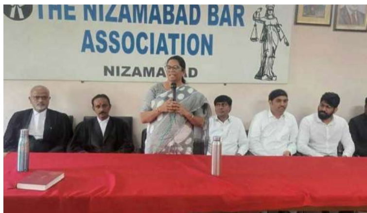
అక్షర విజేత, నిజామాబాద్ ప్రతినిధి :

శ్రమిస్తే కక్షిదారులకు న్యాయ ఫలాలు మరిన్ని అందించడానికి అవకాశం ఉంటుందని ఆమె తెలిపారు. నిజామాబాద్ బార్ అసోసియేషన్ కార్యాలయాన్ని బుధవారం సందర్శించిన ఆమె న్యాయవాదుల సమావేశంలో మాట్లాడారు. కోర్టుల ద్వారా సత్వం న్యాయాన్ని ఆశీర్వాదించుకోవాలని ఆమె అన్నారు. న్యాయవారులకు అనుగుణంగా