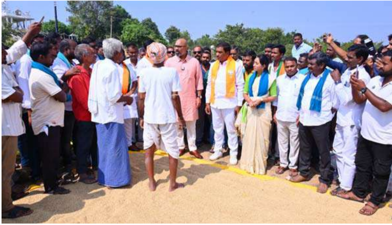
అక్షర విజేత, నిజామాబాద్ ప్రతినిధి :

సీఎం రేవంత్ రెడ్డి తన గురువు చంద్రబాబును చూసి పని చేస్తాడనుకుంటే కేసిఆర్ శిష్యుడిలా పని చేస్తున్నాడని ఎంపీ ధర్మపురి అరవింద్ అన్నారు. ఇంద్రావతి