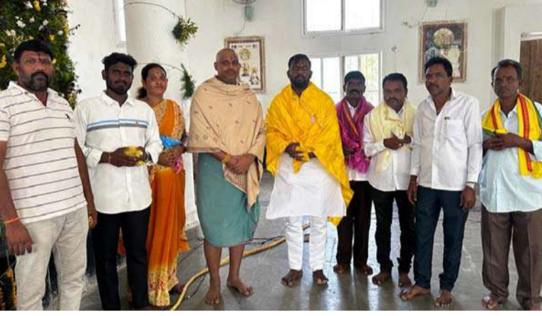
అక్షర విజేత, మోర్లాడ్ :