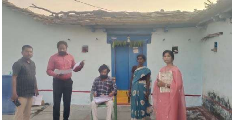
అక్షరవిజేత, వికారాబాద్ ప్రతినిధి