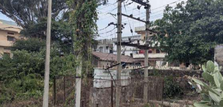
అక్షర విజేత, పెద్ద శంకరంపేట:

విద్యుత్ సిబ్బందికి కూడా పాంచి ఉన్న పెను ప్రమాదాలు...? పట్టించుకోని అధికార యంత్రాంగం..