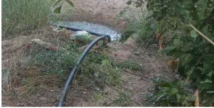
అక్షర విజేత: చిగురుమామిడి