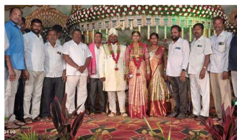
అక్షర విజేత బచ్చన్నపేట :