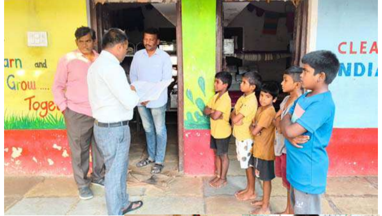
అక్షర విజేత, ఏర్పాటు :