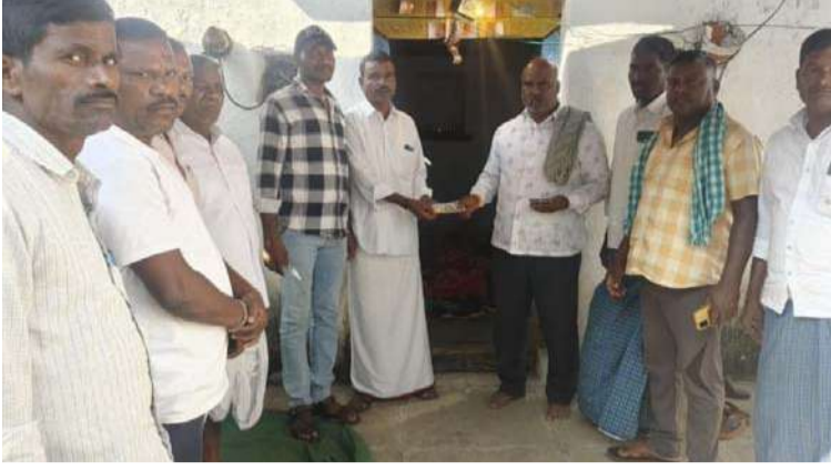
అక్షరవిజేత, వికారాబాద్ ప్రతినిధి