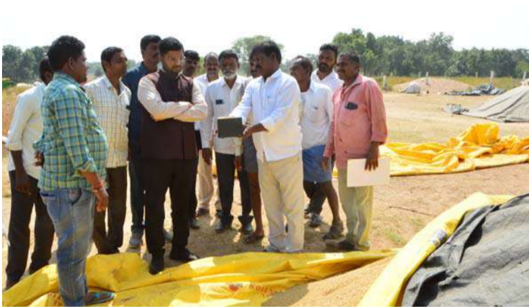
అక్షర విజేత, బచ్చన్నపేట: