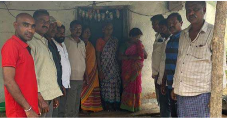
అక్షర విజేత, మోర్లాడ్ :