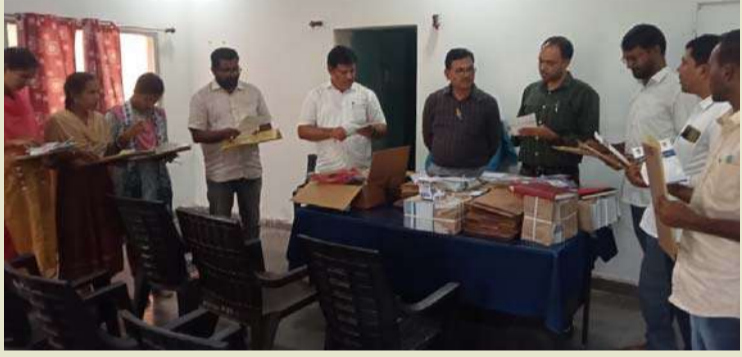
అక్షర విజేత మామడ: