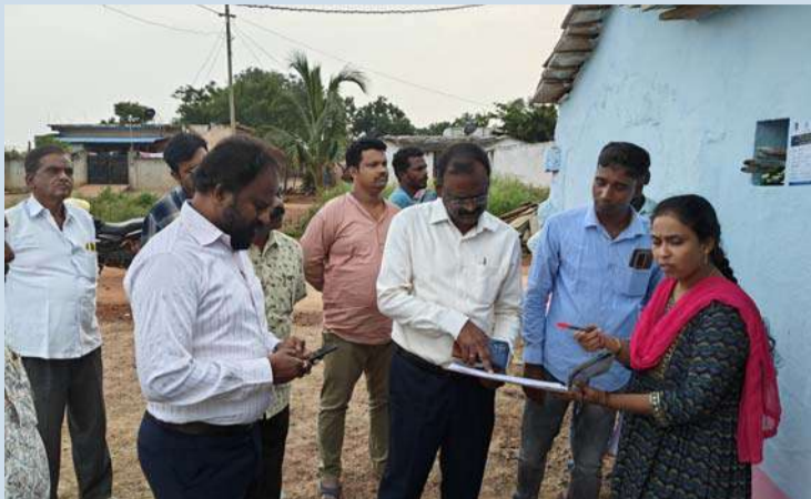
అక్షర విజేత, వికారాబాద్ ప్రతినిధి