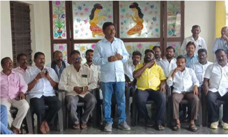
అక్షర విజేత వర్తన్వపేట