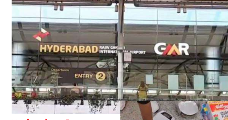
అక్షర విజేత రాజేంద్రనగర్

శంషాబాద్ ఎయిర్ పోర్టులో భారీగా డ్రగ్స్ ను ఎయిర్పోర్ట్ అధికారులు పట్టుకున్నారు. శంషాబాద్ ఎయిర్ పోర్టులో శుక్రవారం (నవంబర్ 1) భారీగా డ్రగ్స్ పట్టుబడ్డాయి. దాదాపు రూ.7 కోట్ల విలువ