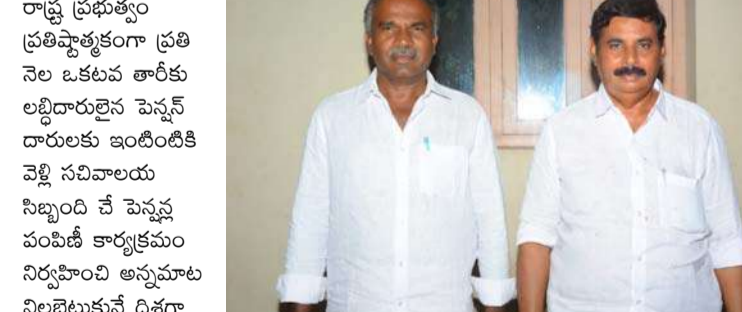
అక్షర విజేత మర్రిపాడు/నెల్లూరు బ్యూరో :

ఆంధ్రప్రదేశ్ రాష్ట్ర ప్రభుత్వం ప్రతిష్టాత్మకంగా ప్రతి నెల ఒకటవ తారీకు లబ్ధిదారులైన పెన్నెన్ల దారులకు ఇంటింటికి వెళ్లి సచివాలయ సిబ్బంది చే పెన్నెన్ల పంపిణీ కార్యక్రమం నిర్వహించి అన్నమాట నిలబెట్టుకునే దిశగా అడుగులు వేస్తుందని మండల టిపిసీసీ కన్వీనర్ ఆరికల్ల జనార్దన్ నాయుడు మరియు మాజీ అధ్యక్షులు శాఖమూలి నారాయణ నాయుడు పేర్కొన్నారు. మండలంలో సామాజిక ఎన్టీఆర్ భరోసా పింఛన్ను మండలంలోని 17 గ్రామ సచివాలయాలలో 6191 పింఛన్ను కుగాను 92శాతం లబ్ధిదారులకు అందజేయడం జరిగిందని.. గత ప్రభుత్వంలో వాలంటీర్ వ్యవస్థను ఏర్పాటు చేసి వారి ద్వారా పెన్నెన్ల పంపిణీ కార్యక్రమం నిర్వహించామని చెప్పుకొచ్చిన గత ప్రభుత్వ నాయకులకు వాలంటీర్ వ్యవస్థ తో సంబంధం లేకుండా సచివాలయ సిబ్బందితో నేరుగా లబ్ధిదారులకు పెన్నెన్లను ఒక్కరోజులో పంపిణీ చేసి చెప్పిన మాటలు నిలబెట్టుకున్న ఘనత ఒక్క తెలుగుదేశం పార్టీ ప్రభుత్వానికి మాత్రమే దక్కుతుంది అని ప్రజలకు మేలు చేసే దిశగా ప్రభుత్వం ప్రతి అడుగు ఆవిరూపి వేస్తోందని వృద్ధుల పట్ల వికలాంగుల పట్ల సీఎం చంద్రబాబు నాయుడు భార్యతాయుతంగా ఆలోచన చేసి ఎన్నికల మేనిఫెస్టోలో ఇచ్చిన హామీ మేరకు ప్రమాణ స్వీకారం అనంతరం అప్ప తాతలకు పెన్నెన్ల పెంపు చేయడం జరిగింది. గత ప్రభుత్వం వారికి అందిస్తున్న పెన్నెన్ల సరిపోషిని వారి బాధలను చూసి ఇదివరకు ఎన్నడూ లేని అంత అధికమొత్తంలో వృద్ధులకు 4000 పేర్లకు అంగులకు 6000 లాభుల పెన్నెన్ల పెంపు చేసి ఇంటికి పెద్ద కొడుకులా వ్యవహరిస్తూ అప్ప తాతల మొహాల్లో చిరునవ్వును చూసి మురిసిపోయే వ్యక్తిత్వం రాష్ట్ర దేవదారులు శాఖ మంత్రివర్గులు ఆసం రామనారాయణ రెడ్డికి పుష్పలంగా ఉన్మాయని వారు పేర్కొన్నారు.