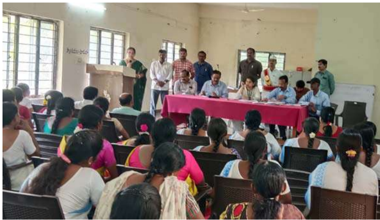
అక్షర విజేత వర్ణప్రసేద