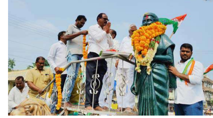
అక్షర విజేత, మోర్లాడ్ :