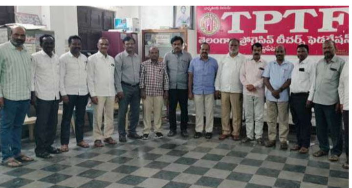
అక్షర విజేత సిద్దిపేట