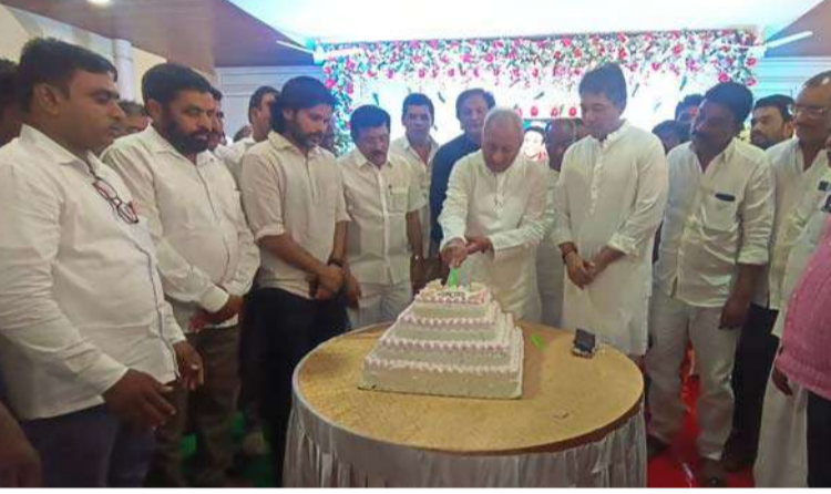
అక్షర విజేత, ముద్రిపాడు/నెల్లూరు జ్యూరీ :