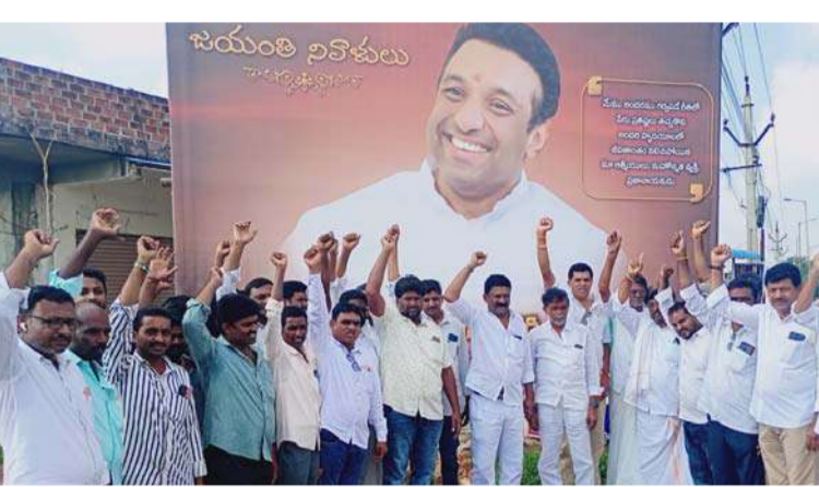
అక్షర విజేత, ముద్రిపాడు/నెల్లూరు జ్యూరీ :