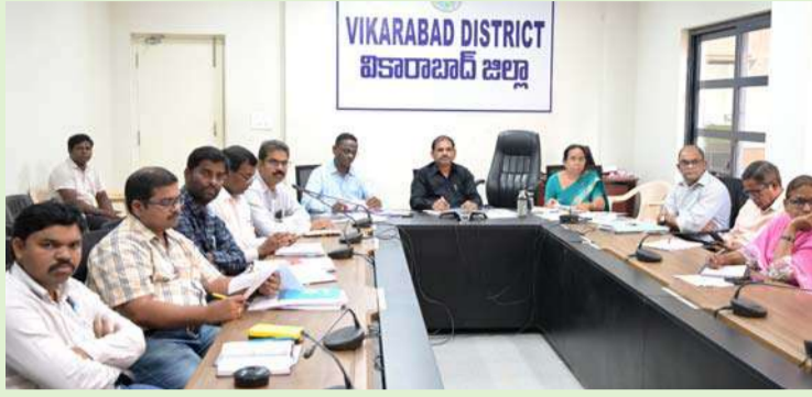
అక్షర విజేత, వికారాబాద్ ప్రతినిధి