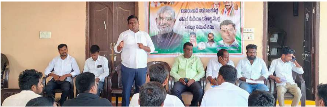
అక్షరవిజేత, వికారాబాద్ ప్రతినిధి