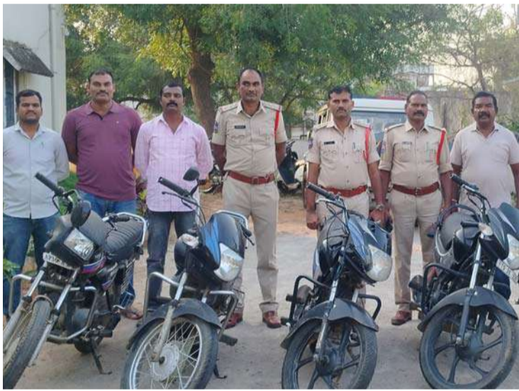
అక్షర విజేత గజ్వేల్: