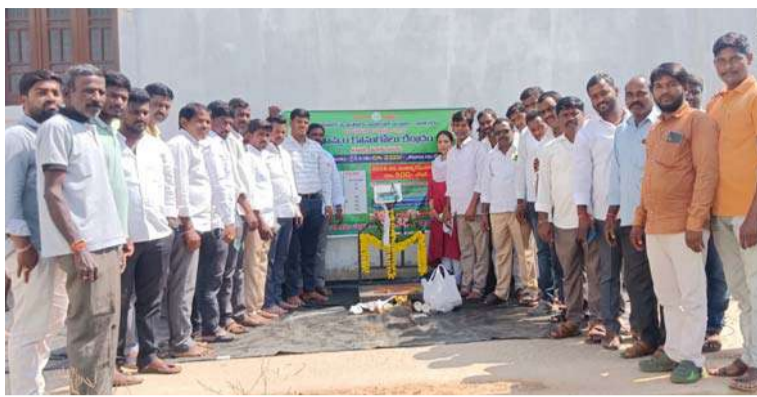
అక్షర విజేత గజ్వేల్: