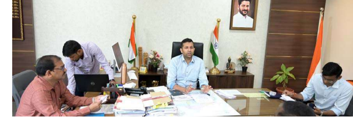
అక్షర విజేత, వికారాబాద్ ప్రతినిధి

జిల్లాలో వరి కొనుగోలు కేంద్రాలను సత్వరమే ప్రారంభించాలని జిల్లా కలెక్టర్ ప్రతీక జైన్ సంబంధిత అధికారులను ఆదేశించారు. 2024-25 సీజన్ కు సంబంధించిన వరి కొనుగోలుపై బుధవారం జిల్లా కలెక్టర్ తన ఛాంబర్ లో అధికారులతో సమీక్షించారు. ఈ సందర్భంగా ఆయన మాట్లాడుతూ జిల్లా వ్యాప్తంగా వరిని కొనుగోలు చేసేందుకు వీలగా 126 కేంద్రాలను ఏర్పాటు చేస్తున్నామన్నారు. ఖరీఫ్ సీజన్ కు సంబంధించి ధాన్యాన్ని కొనుగోలు చేసేందుకు అన్ని చర్యలు తీసుకోవాలని కలెక్టర్ తెలిపారు. రైతులు