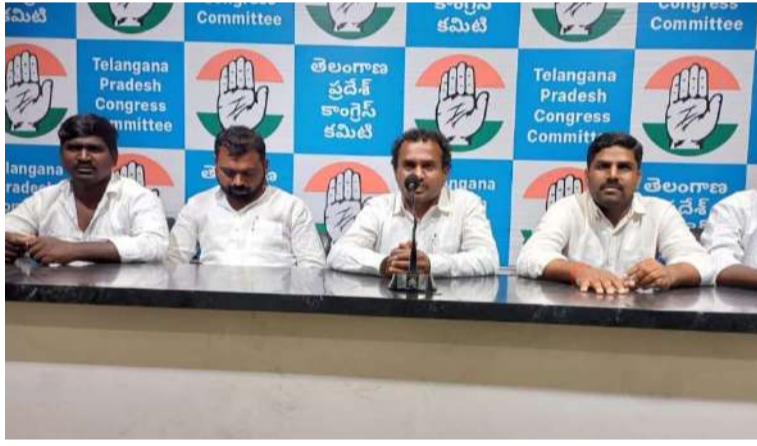
అక్షరవిజేత, వికారాబాద్ ప్రతినిధి