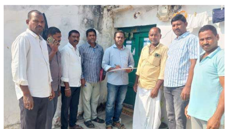
అక్షర విజేత, మోర్లాడ్ :

తెలంగాణ రాష్ట్రంలో కాంగ్రెస్ ప్రభుత్వం అధికారంలోకి వచ్చిన తర్వాత ప్రతి కుటుంబానికి సంక్షేమ, అభివృద్ధి పథకాలను అందించాలని సదుద్దేశంతో చేపట్టిన అన్ని సర్వే చేస్తున్న అధికారులకు బాల్కొండ మండల కాంగ్రెస్ నాయకులు, ఆయా గ్రామాలలో గల కాంగ్రెస్ నాయకులు సర్వేలు చేస్తున్న అధికారులకు అన్ని విధాలుగా సహాయ సహకారాలు అందిస్తున్నామని బాల్కొండ మండల, గ్రామ కాంగ్రెస్ నాయకులు తెలిపారు. కాంగ్రెస్ ప్రభుత్వం ప్రతిష్టాత్మక చేపట్టిన సామాజిక, ఆర్థిక, విద్య, ఉపాధి, రాజకీయ, కుల గణన సర్వే, సమగ్ర ఇంటింటి కుటుంబ సర్వే పలు గ్రామాలలో అధికారులు నిర్వహిస్తున్నారని, తమ కాంగ్రెస్ నాయకులు సైతం, వెంట ఉంటూ సర్వేలు సక్రమంగా జరిగేలా, అధికారులకు అన్ని విధాలుగా సహకరిస్తున్నామని కాంగ్రెస్ నాయకులు తెలిపారు.