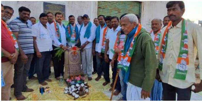
అక్షర విజేత, మోర్లాడ్ :