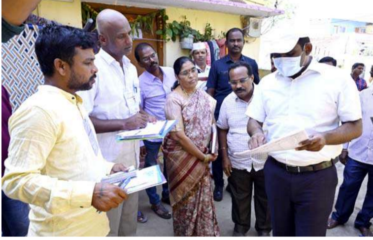
అక్షర విజేత, నిజామాబాద్ ప్రతినిధి :