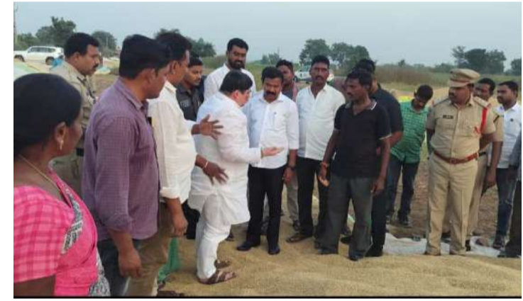
అక్షర విజేత, మానకొండూర్ :