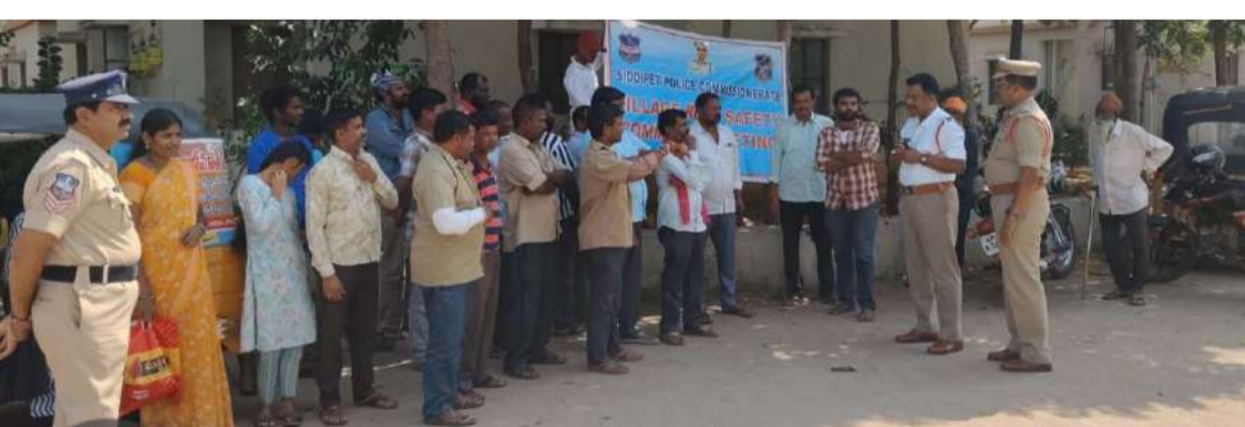
అక్షర విజేత సిద్దిపేట

ఈ సందర్భంగా ట్రాఫిక్ ఇన్స్పెక్టర్ మాట్లాడుతూ డబుల్ బెడ్ రూమ్ కాలనీవాసులు రాజీవ్ రహదారి ఎక్కేటప్పుడు చాలా జాగ్రత్తగా వెళ్లాలని రోడ్డు ప్రమాదాలు జరిగే అవకాశం ఎక్కువగా ఉన్నందున రోడ్డుకు ఇరువైపులా వాహనాలు వెళుతున్నాయా లేదా చూసుకొని రోడ్డు దాటాలని సూచించారు. రాంగ్ రూట్లో రాకుండా చూసుకోవాలని రాంగ్ రూట్లో రావడం వల్ల రోడ్డు ప్రమాదాలు జరిగి విలువైన ప్రాణాలు పోగొట్టుకునే అవకాశం ఉన్నందున ఎట్టి పరిస్థితుల్లో రాంగ్ రూట్లో రాకుండా వాహనాలను అదుపు చేయాలని సూచించారు. కొంతమంది రాంగ్ రూట్లో వస్తున్నారని రాంగ్ రూట్లో వచ్చే వారిపై ఎం ఐ యాక్ట్ ప్రకారం కేసులు