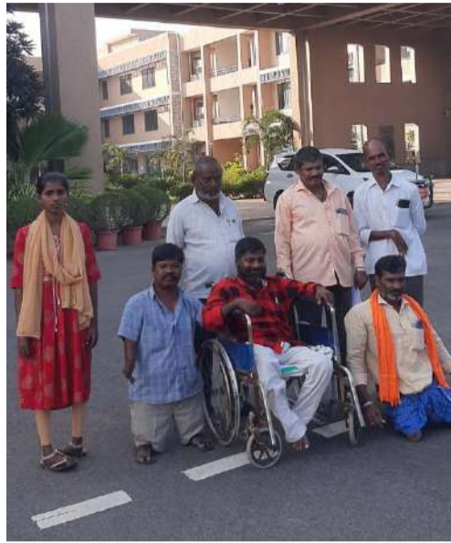
జిల్లాలో సదరం సర్టిఫికేట్ల జారీలో ఎలాంటి