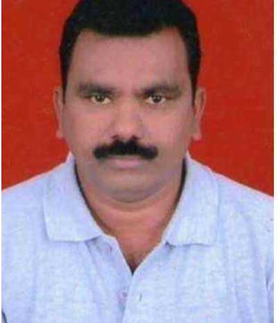
అక్షర విజేత, మోర్లాడ్ :