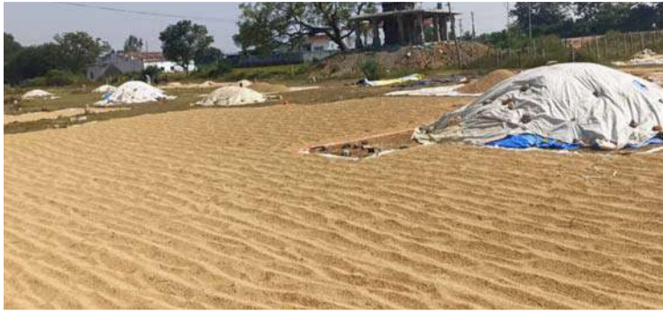
అక్షర విజేత, శివంపేట.

సన్నాటకు 500 రూపాయల బోనస్ మాట దేవుడు ఎరుగు కనీసం ధాన్యం కొంటే చాలు అని శివంపేట మండల రైతులు అంటున్నారు. శివంపేట మండలంలోని వివిధ గ్రామాలలో ఆర్థికంగా పోటీపోటీగా ధాన్యం కొనుగోలు కేంద్రాలను