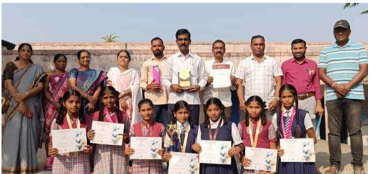
అక్షర విజేత, మోర్లాడ్ :