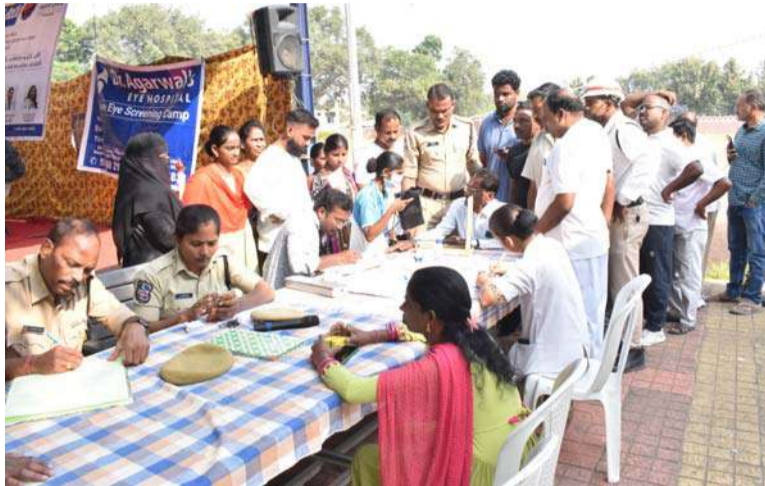
అక్షర విజేత, నిజామాబాద్ ప్రతినిధి