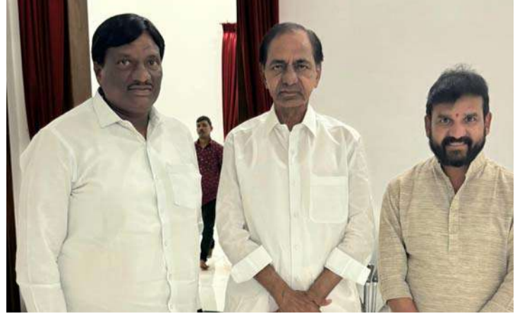
అక్షర విజేత, వికారాబాద్ ప్రతినిధి