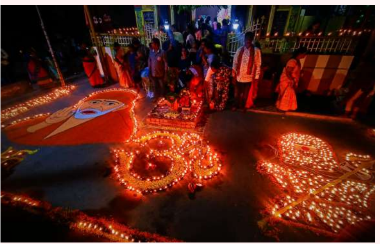
అక్షరవిజేత, భీమవరం :