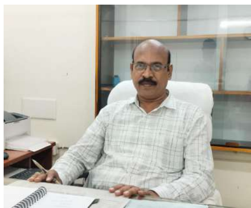
గమనిక...తగు సమాచారం కొరకు వెంటనే మీ పరిధిలోని ఆర్బిలను, సీ.ఓ లను మరియు పురపాలక సంఘంలోని మెప్పా విభాగమునందు సంప్రదించాలని కమిషనర్ తెలిపారు..