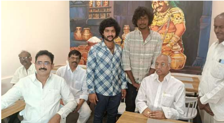
అక్షరవిజేత, భీమవరం :