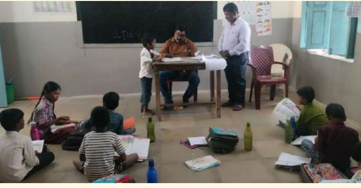
అక్షర విజేత కొండపాక