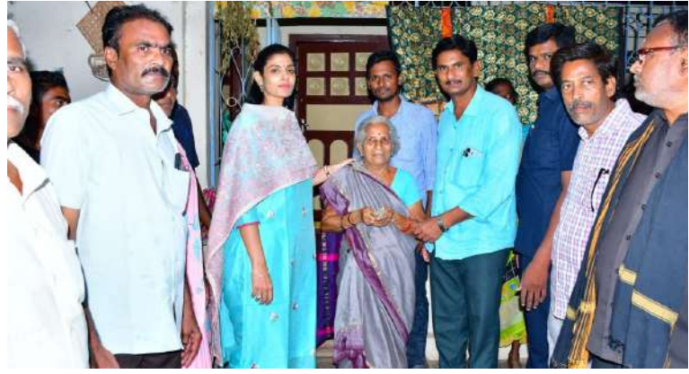
అక్షర విజేత కోటనందూరు.