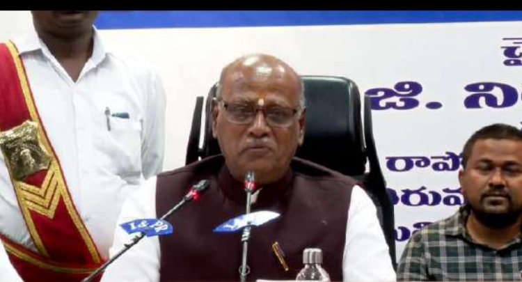
అక్షరవిజేత హనుకొండ బ్యూరో షీప్