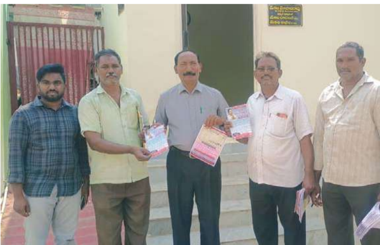
అక్షర విజేత మంగళగిరి.....