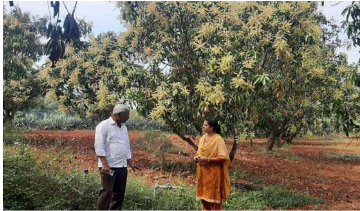
అక్షర విజేత కోటనందూరు.