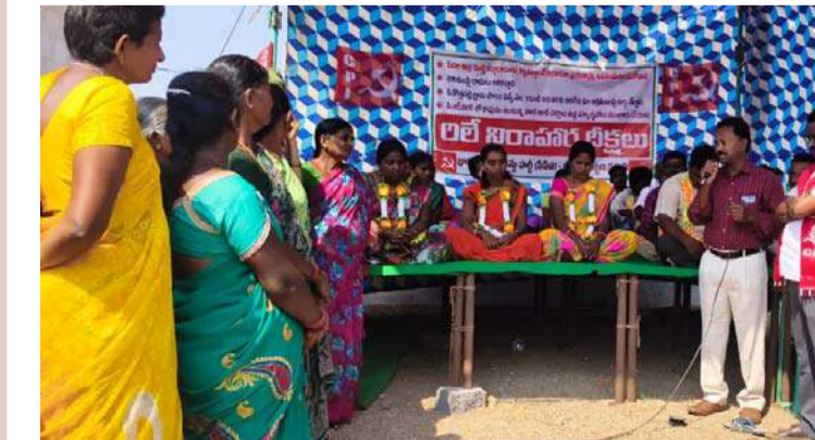
అక్షరవిజేత, బద్వేల్/నెల్లూరు యార్లో :

బద్వేల్ ఎస్సీ రిజర్వ్ నియోజకవర్గం గా ఏర్పడి దాదాపు 20 సంవత్సరాలు అవుతున్నా దళితల అభివృద్ధి ఎక్కడ వేసిన