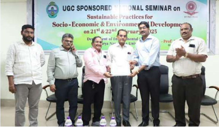
అక్షర విజేత మంగళగిరి.....!