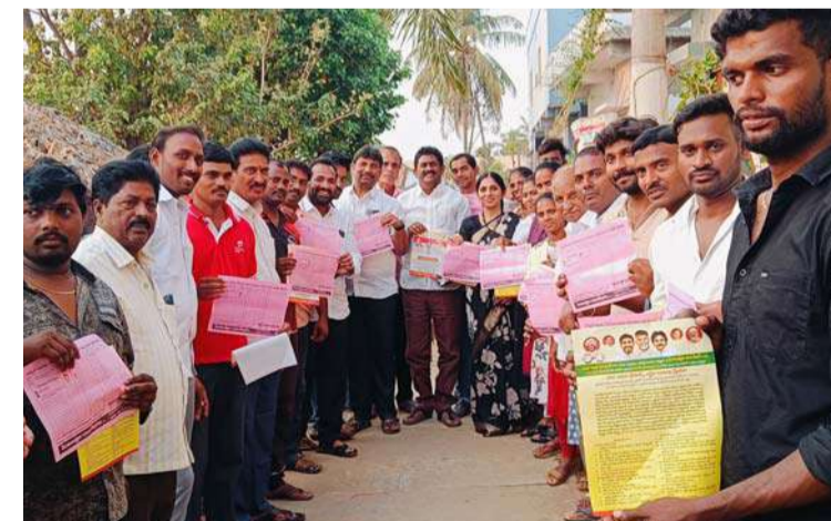
అక్షర విజేత కోటనందూరు.