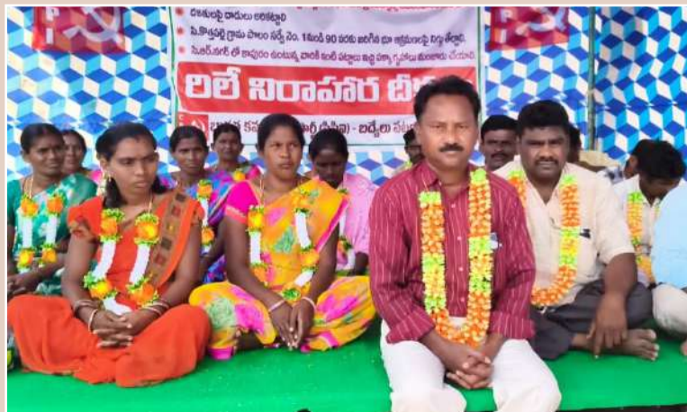
భారత కమ్యూనిస్టు పార్టీ అధ్యక్షులలో రిలే నిరాహార దీక్షలు సంఘమిత్ర సంస్థ చైర్మన్

గోంగలి అక్కడే అన్న చందంగా పేదరికం, దారిద్ర్యం, అంటరానితనం తిష్టి వేసుకొని తాండవిస్తుందని ఆయన ఆవేదన వ్యక్తం చేశారు. బద్వేల్ మండలం, సి. కొత్తపల్లి సి.ఆర్. నగర్ లో 2వ రోజు