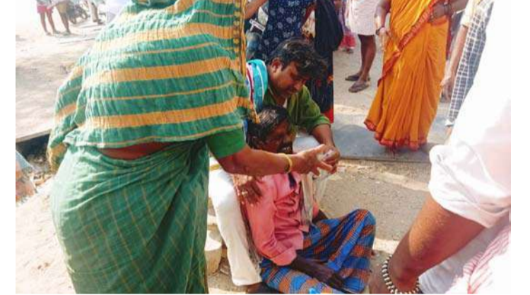
అక్షర విజేత మంత్రాలయం

ఎన్ హెచ్పి 167 హైవేలో చిలకలదోన గ్రామంలో లాల్ ఆటో డి