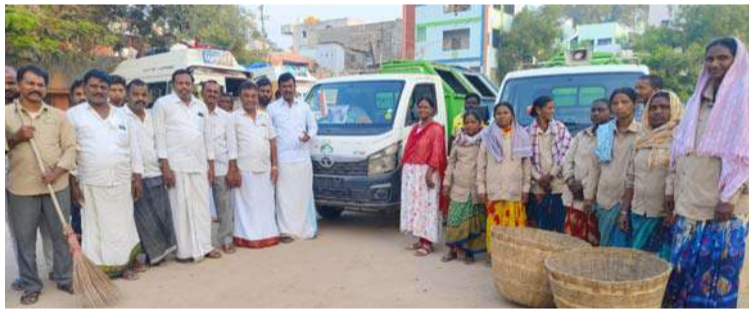
అక్షర విజేత మంత్రాలయం