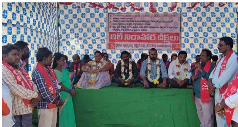
అక్షరవిజేత, బద్వేల్/నెల్లూరు యార్లో