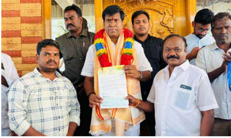
అక్షర విజేత ఎమ్మిగనూరు