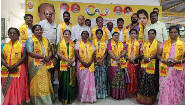
అక్షర విజేత కోటనందూరు