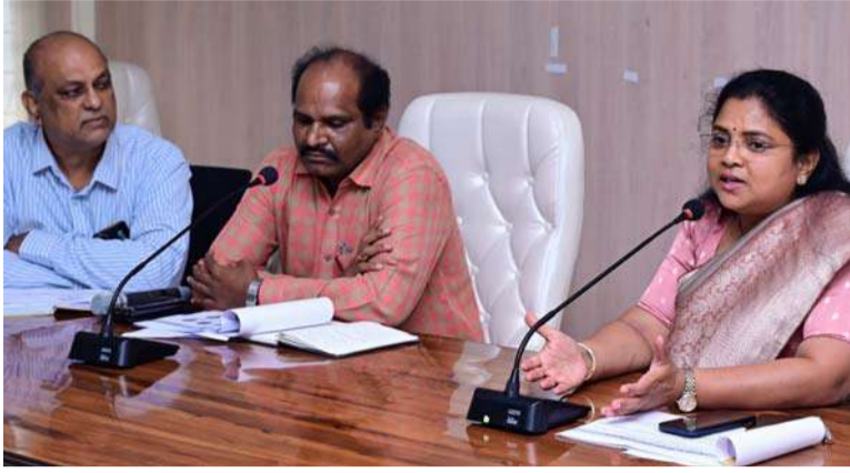
అక్షర విజేత భీమవరం: