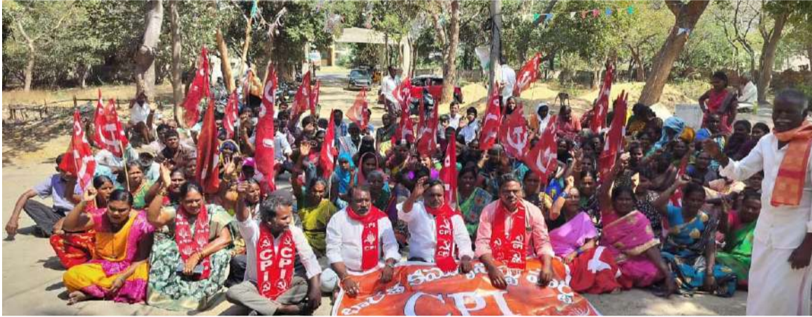
అక్షరవిజేత, బద్వేల్/నల్గూరు జ్యూరో :

బద్వేల్ నియోజకవర్గం గోపవరం మండలం పి.పి కుంట వద్ద గత సంవత్సర కాలంగా చిన్నపాటి గుడిసెలు రేకుల షెడ్లు ఏర్పాటు చేసుకొని జీవనం సాగిస్తున్న పేదలకు ఇంటి పట్టాలు ఇవ్వాలని గత మూడు రోజులుగా పి.పి కుంట వద్ద జరుగుతున్న రిలే నిరాహారదీక్షలు కు మద్దతుగా భారత కమ్యూనిస్టు పార్టీ ( సిపిఐ) ఆధ్వర్యంలో గోపవరం తాసిల్దార్ కార్యాలయం ముందు ధర్మా నిర్వహించారు ఈ ధర్మాకు ముఖ్యఅతిథిగా హాజరైన సిపిఐ