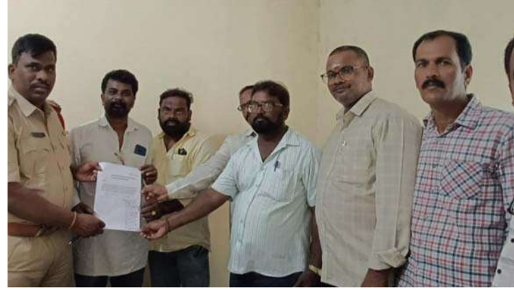
అక్షర విజేత పెండ్లర్తి:

కట్టా భూమిని తొలగించేందుకు వెళ్లిన ప్రభుత్వ అధికారులు, విలేకరులపై దాడి