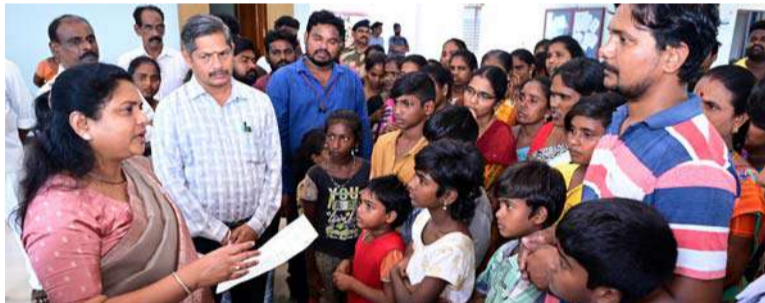
అక్షర విజేత భీమవరం: