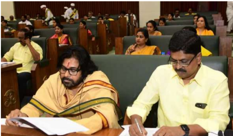
అక్షర విజేత, వెలగపూడి

వైసిపి ప్రభుత్వ పాలనలో రాష్ట్రం ఎంతో నష్టపోయిందని అన్నారు గవర్నర్ అబ్దుల్ నజీర్. ఎన్నికల్లో ప్రజలు తమ ప్రభుత్వానికి తిరుగులేని మెజారిటీ ఇచ్చారని, ప్రజలు కోరిక మేరకు కూటమి ప్రభుత్వం ఏర్పాటుచేసి తెలిపారు. గత ఐదేళ్లలో రాష్ట్రం అనేక ఇబ్బందులకు గురైందని తెలిపారు. ఏపీ అసెంబ్లీ బడ్జెట్ సమావేశాల తొలి రోజైన నేడు ఉభయసభలను ఉద్దేశించి గవర్నర్ ప్రసంగిస్తూ సూపర్ సిక్స్ పథకాల ద్వారా ప్రజలకు మేలు చేస్తున్నామని పేర్కొన్నారు. అధికారంలోకి వచ్చిన వెంటనే ల్యాండ్ ట్రెయిడింగ్ యాక్ట్ రద్దు చేశామని.. అసెంబ్లీలోనే తెచ్చి పేదల ఆకలి తీరుస్తున్నామని అన్నారు. కూటమి ప్రభుత్వం వచ్చాక రాష్ట్రాన్ని గాడిలో పెడుతున్నామని అన్నారు. కూటమి