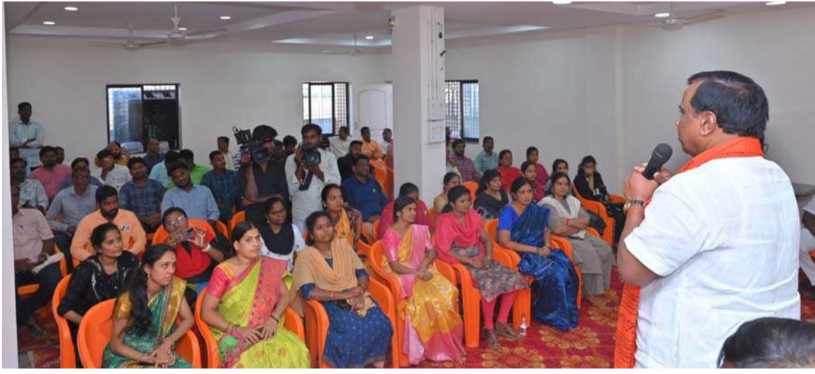
అక్షర విజేత, నిజామాబాద్ ప్రతినిధి