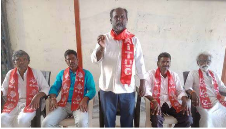
అక్షర విజేత నారాయణపేట/మరికల్