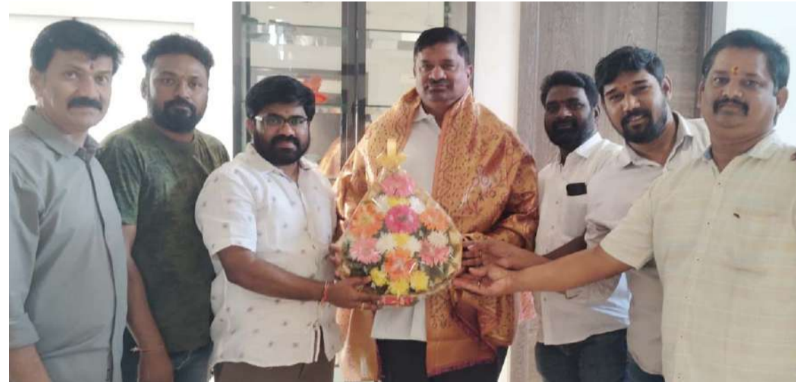
అక్షర విజేత, కరీంనగర్: