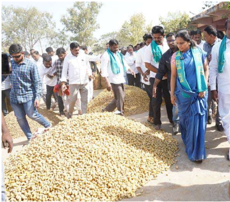
అక్షర విజేత, నిజామాబాద్ ప్రతినిధి

కాంగ్రెస్ ప్రభుత్వం పనులు రైతులకు మద్దతు ధర 12 వేలు ఫిబ్రవరి చివరి వరకు ప్రకటించకపోతే జిల్లా కలెక్టరేట్ ను ముట్టడిస్తామని, పనులు బోర్డు కార్యాలయం ఎదుట పనులు రైతులతో పెద్ద ఎత్తున ధర్నా చేపడతామని ఎమ్మెల్యే కవిత అన్నారు. ఈ మేరకు శనివారం పనులు రైతులతో కలిసి నిజామాబాద్ మార్కెట్ యార్డ్ ని సందర్శించారు. పనులు రైతులను కలసి సమస్యలను అడిగి తెలుసుకున్నారు. ఈ సందర్భంగా ఆమె మీడియాతో మాట్లాడుతూ పార్లమెంట్లో పనులు బోర్డు బిల్లు పెట్టి పాస్ చేసినట్లయితే బయట దేశాల నుండి వచ్చే నాసిరకం పనులు దిగుమతిని తగ్గించుకోవచ్చని అన్నారు. దానివల్ల ఇక్కడి రైతులకు ధర పెరిగే అవకాశం ఉంటుందన్నారు. అదేవిధంగా ఇక్కడ పనులు పరిశ్రమలు పెట్టవచ్చని, పనులకు రేటు వచ్చే ఆస్కారం ఉంటుందన్నారు. ఏదైనా ఒక సీజన్లో పంట కోల్పోయిన రైతులకు మద్దతుగా ఉండేందుకు 15 వేలు మద్దతు ధర ఇస్తే ఆ ధరను తగ్గించే వ్యాపారులు వీరిని కరెక్టుగా