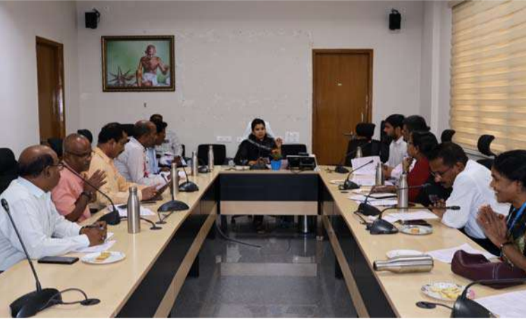
అక్షర విజేత సిద్దిపేట

యువ ఉత్సవ్ కార్యక్రమాన్ని అమలు చేయుటకు జిల్లా స్థాయి కమిటీ సమావేశం జిల్లా అదనపు కలెక్టరు అధ్యక్షతన కలెక్టరేట్ జరిగింది. ఈ సమావేశంలో జిల్లా స్థాయి యువ ఉత్సవ్ ఉత్సవాల్లో ఆరు భాగాలపై దృష్టి సారించి, కార్య చరణ అంశాల్లో భాగంగా జిల్లా విద్యా శాఖ అధికారి మరియు ఇతర అధికారుల సమన్వయంతో పాఠశాలలు, కళాశాలలు మరియు ఇతర సంబంధిత సంస్థలతో సమన్వయం చేస్తూ, సైన్స్ మేళా ప్రదర్శన వ్యక్తిగత మరియు బృందాలు వారిగా సహా ప్రతి కార్యక్రమాల పర్యవేక్షణ కొరకు