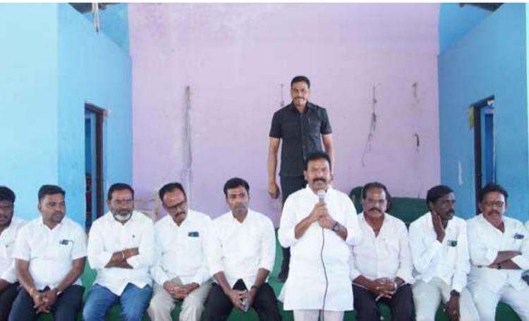
అక్షర విజేత, మానకొండూర్: