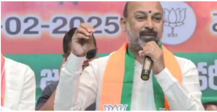
అక్షర విజేత, కరీంనగర్:

- కేంద్ర హెంకాశాఖ సహాయ మంత్రి బండి సంజయ్ కుమార్