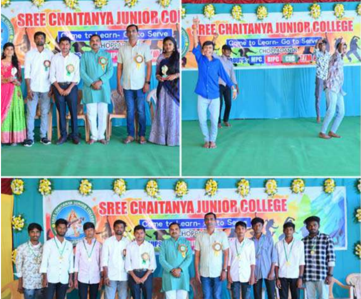
Sree Chaitanya Junior College