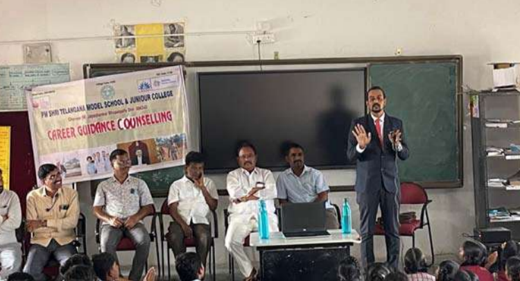
అక్షర విజేత, గణపూర్: