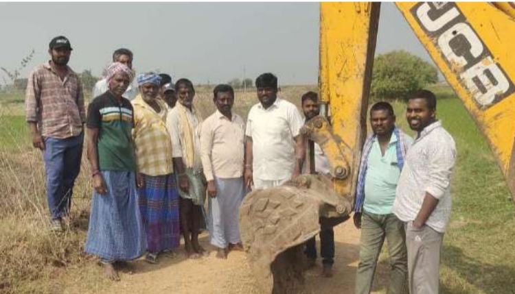
అక్షర విజేత, మానకొండూర్:

తిమ్మాపూర్ మండలం మల్లాపూర్ లో గత కొన్ని రోజులుగా రైతులు పడుతున్న