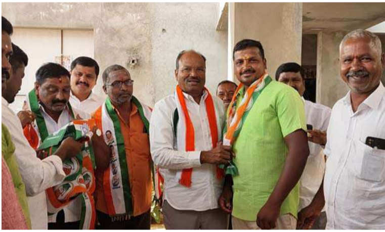
అక్షర విజేత, మహేశ్వరం