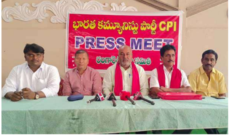
అక్షర విజేత మహేశ్వరం