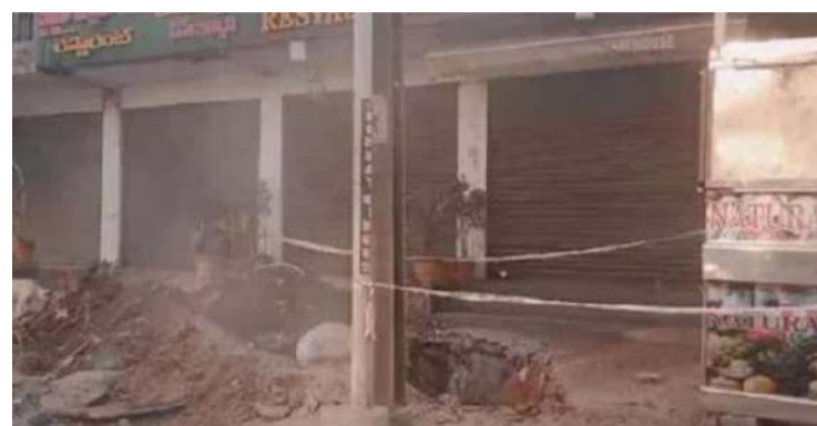
అక్షర విజేత, కుత్బుల్లాపూర్

కుత్బుల్లాపూర్ నియోజకవర్గంలోని సూరారం కాలనీలో పెను ప్రమాదం తప్పింది. రోడ్డు పక్కన చెట్టును తొలగిస్తుండగా పైప్ లైన్ పగిలి ఒక్కసారిగా వంట గ్యాస్ ఆ ప్రాంతమంతా వ్యాపించింది. దీంతో ఎప్పుడు ఏం జరుగుతుందనని స్థానికులంతా ఆందోళనకు గురయ్యారు. సూరారంలోని మల్లారెడ్డి నారాయణ ఆస్పత్రి సమీపంలోని బాలానగర్-సర్కారు ప్రధాన రహదారి ముందు ఓ చెట్టు మొదలును తొలగించేందుకు తవ్వకాలు చేపట్టారు. ఈ క్రమంలో భాగ్యలక్ష్మి గ్యాస్ లిమిటెడ్ సంస్థకు చెందిన వంట గ్యాస్ పైప్ లైన్ కు చిల్లుపడింది. పైప్ లైన్ కు రంధ్రం పడటంతో పెద్ద ఎత్తున గ్యాస్ లీక్ ఆ ప్రాంతమంతా వ్యాపించింది. దీంతో స్థానికులు ఒక్కసారిగా ఉలిక్కిపడ్డారు. ఏం జరుగుతుందోనని భయపడిపోయారు. వంట గ్యాస్ పైప్ లైన్ పగిలినదన్న సమాచారం తెలియగానే భాగ్యలక్ష్మి గ్యాస్ లిమిటెడ్ కు చెందిన ప్రతినిధులు హాటాహాటిని ఘటనాస్థలికి చేరుకున్నారు. వెంటనే మరమ్మత్తు పనులు చేపట్టారు. వీలైనంత తక్కువ సమయంలోనే లీకేజీని అరికట్టారు. దీంతో స్థానికులు ఊపిరిపీల్చుకున్నారు. అయితే.. సూరారం కాలనీ పరిసర ప్రాంతాల్లో తరచూ భాగ్యలక్ష్మి గ్యాస్ లిమిటెడ్ కంపెనీ నుంచి గ్యాస్ లీకేజీలకు పరిపాటిగా మారినదని ఆందోళన వ్యక్తం చేశారు. భూగర్భంలో గ్యాస్ పైప్ లైన్ ఏర్పాటు చేసినప్పుడు గుర్తింపు చిహ్నాలు పెడితే ఇలాంటి ఘటనలు జరిగేవి కావని అంటున్నారు.