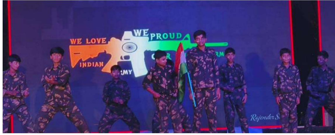
అక్షర విజేత మహేశ్వరం

మహేశ్వరం నియోజకవర్గం బాలాపూర్ మండల్ తరంగ్ 2025 అన్యువల్ డే వేడుకలను ఎస్ పి ఆర్ గార్డెన్స్ లో ఘనంగా నిర్వహించుకోవడం జరిగింది వివరాలకోసం రంగారెడ్డి జిల్లా మహేశ్వరం నియోజకవర్గం బడంగ్గోట్ మల్లాపూర్ గ్రామంలోని ఎస్ పి ఆర్ గార్డెన్స్ లో తరంగ్ 2025 డి మల్లాపూర్ మాస్టర్ మైండ్ స్కూల్ లో అన్యువల్ డే సెలబ్రేషన్స్ ఘనంగా