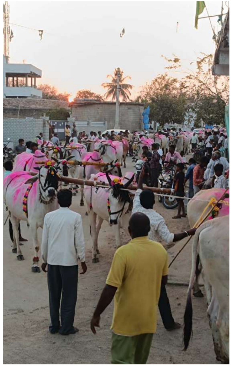
అక్షర విజేత గజ్వేల్:

మహా శివరాత్రి పర్వదినం సందర్భంగా జగదేవపూర్ మండల పరిధిలోని తిగుల్ గ్రామంలో పార్వతి పరమేశ్వర ఆలయంలో బుధవారం భక్తులు అమ్మ వారిని దర్శించుకుని పూజలు నిర్వహించారు. అలాగే శివలింగంకు పాలాభిషేకం చేశారు. సాయంత్రం ఎడ్ల ఊరేగింపు ఘనంగా నిర్వహించారు. ఎడ్ల ఊరేగింపుతో అమ్మవారి కల్యాణోత్సవం కోసం చేనేత చీరను అందించారు. గురువారం అమ్మవారి కల్యాణోత్సవం, అగ్ని గుండలు ఉంటాయని ఆలయ పూజరులు తెలిపారు. అలాగే జగదేవపూర్ లో మల్లన్న ఆలయంలో ఎడ్లబండ్ల ఊరేగింపు ఘనంగా నిర్వహించారు. దౌలాపూర్, ఇటిక్కాల, చాట్లపల్లి, మునిగడప, తిమ్మపూర్, పీఠపల్లి తదితర గ్రామాల్లోని శివాలయాల్లో ఘనంగా శివరాత్రి ఉత్సవాలు నిర్వహించారు. భక్తులు ఉపవాస దీక్షలు చేపట్టి శివనామస్మరణలతో భక్తి పరవశంలో ఉన్నారు.