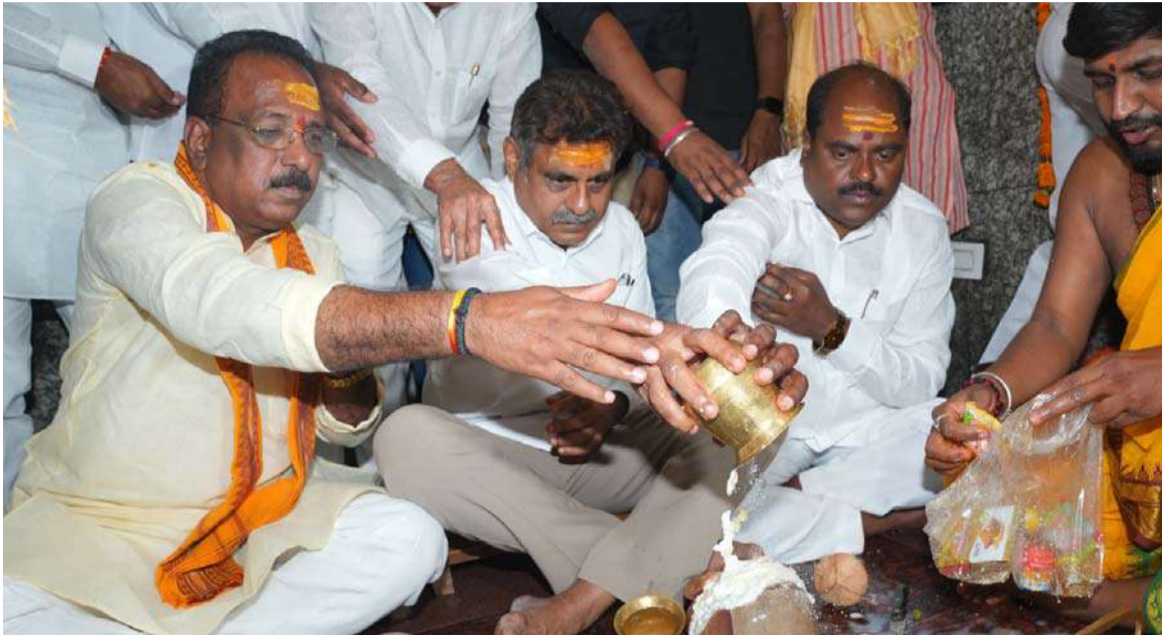
అక్షర విజేత మహేశ్వరం