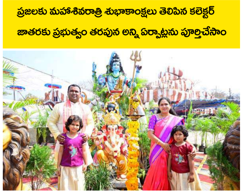
ప్రజలకు మహాశివరాత్రి శుభాకాంక్షలు తెలిపిన కలెక్టర్ జాతరకు ప్రభుత్వం తరపున అన్ని ఏర్పాట్లను పూర్తిచేసాం