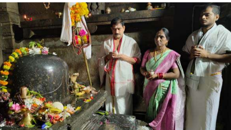
అక్షర విజేత, గణపురం: