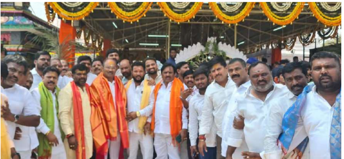
అక్షర విజేత మహేశ్వరం