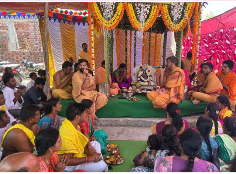
అక్షర విజేత, మోర్లాడ్ :

శివ శివ శంభో హర హర మహాదేవ అంటూ భక్తి నివాదాలతో శివాలయాలు మార్కెట్ గాయి ఎటు చూసినా భక్తిపారవర్షమే. వేకువ జాము నుండి ప్రారంభం అయినా దర్శనాలు సాయంత్రం వరకు కూడా ఆలయాల్లో కొనసాగాయి. ఉదయం నుండే అభిషేకాలు అర్చనలతో జరిగిన ఉత్సవాలతోను కళ్యాణోత్సవాలతో శివాలయాలు భక్తులతో కిటికిలాడాయి. మోర్లాడ్ లోని అత్యంత మహిమాన్వితమైన శ్రీ రాజరాజేశ్వరి స్వామి ఆలయంలో మూడు రోజులుగా జరుగుతున్న శ్రయాత్మిక పండుగ శివాలయాలు నిర్వహించారు. బుధవారం వేకువ జామున మూడు గంటలకే ఆలయంలోని శివలింగానికి మహా రుద్రాభిషేకాన్ని నిర్వహించారు. వేద పండితుల వేద ఘోషల మధ్య స్వామి వారికి పంచామృతాలతో నిర్వహించిన అభిషేక కార్యక్రమంలో గ్రామ అభివృద్ధి కమిటీ సభ్యులు భక్తులు పాల్గొన్నారు. బిల్వప్రతాలు మారేడు దళాలతో పాటు విశేషమైన పూలతో స్వామివారికి ప్రత్యేక అలయానికి చేరుకున్న భక్తులు క్యూ లైన్ లో వేచి ఉండటంతో వారందరికీ దర్శనాన్ని అందజేశారు. మధ్యాహ్నం రెండు గంటల వరకు కూడా క్యూలైన్ లు కొనసాగాయి. అనంతరం ఆలయంలోనే ప్రత్యేకంగా ఏర్పాటు చేసిన కళ్యాణ వేదికలో పార్వతీ పరమేశ్వరుల కల్యాణోత్సవాన్ని అత్యంత వైభవోపేతంగా వేదాంతంగా నిర్వహించారు. నేత్ర పర్వంగా జరిగిన కళ్యాణోత్సవంలో అధిక సంఖ్యలో హాజరైన భక్తులతో వేద పండితులు మహా సంకల్పం చేయించి కన్యాధానంలో భాగస్వాములను చేశారు. అనంతరం సాయంత్రం ఆలయంలో జరిగిన పల్లకి సేవ కార్యక్రమంలో భక్తులు అధిక సంఖ్యలో పాల్గొన్నారు. రాత్రి జరిగే రథోత్సవానికి గ్రామభివృద్ధి కమిటీ ప్రత్యేక ఏర్పాట్లు చేస్తున్నారు. సుదూర ప్రాంతాల నుంచి కుటుంబ సమేతంగా తరలివచ్చిన