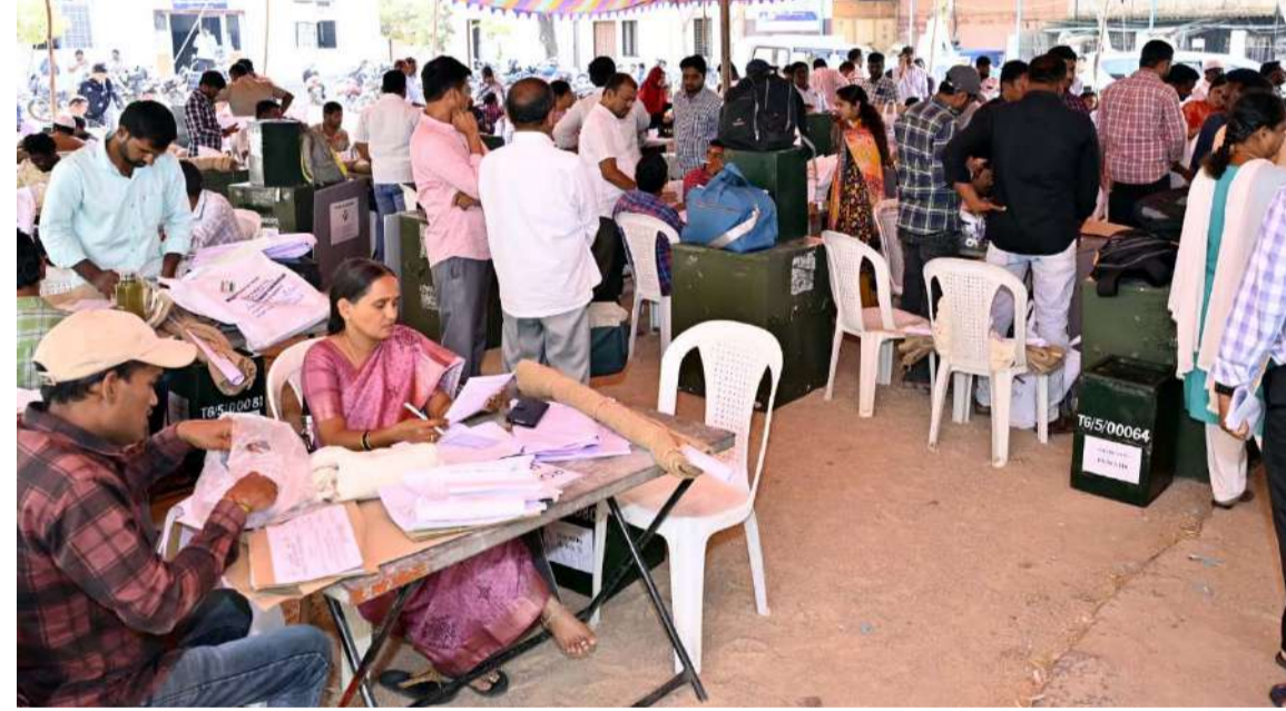
బందోబస్తు నిర్వహించే పోలింగ్ సిబ్బందిని తరలించేందుకు సిద్ధంగా ఉంచిన ఆర్డీసీ

బస్సులను పరిశీలించి, సకాలంలో నిర్దేశిత పోలింగ్ కేంద్రాలకు సిబ్బంది చేరుకునేలా పర్యవేక్షణ జరపాలని అధికారులను ఆదేశించారు. పోలింగ్ సామాగ్రి పీ.ఎస్ లకు తీసుకెళ్ళున్న సమయంలో ఎలాంటి ఇబ్బందులు తలెత్తినా వెంటనే తమ దృష్టికి తేవాలని సూచించారు. కాగా, జిల్లాలో 81 పోలింగ్ కేంద్రాలలో గురువారం ఉదయం 8.00 గంటల నుండి సాయంత్రం 4.00 గంటల వరకు ఓటింగ్ కొనసాగుతుందని కలెక్టర్ తెలిపారు. ఈ మేరకు నిజామాబాద్, ఆర్కాట్ ఆర్డీఓ కార్యాలయాలతో పాటు బోధన్ సబ్ కలెక్టర్ కార్యాలయ ఆవరణల్లో బ్యాటల్ బాక్సులు, పోలింగ్ సామాగ్రి పంపిణీ కేంద్రాలను ఏర్పాటు చేసి ఎన్నికల సిబ్బందికి పోలింగ్ సామాగ్రి అందించామని అన్నారు. డిస్ట్రిబ్యూషన్ కేంద్రాల నుండి సిబ్బంది తమకు కేటాయించిన వాహనాలలో ఆర్డీఓ రాజేంద్రకూమర్, ఇతర అధికారులు నేరుగా పోలింగ్ స్టేషన్లకు చేరుకుని పోలింగ్