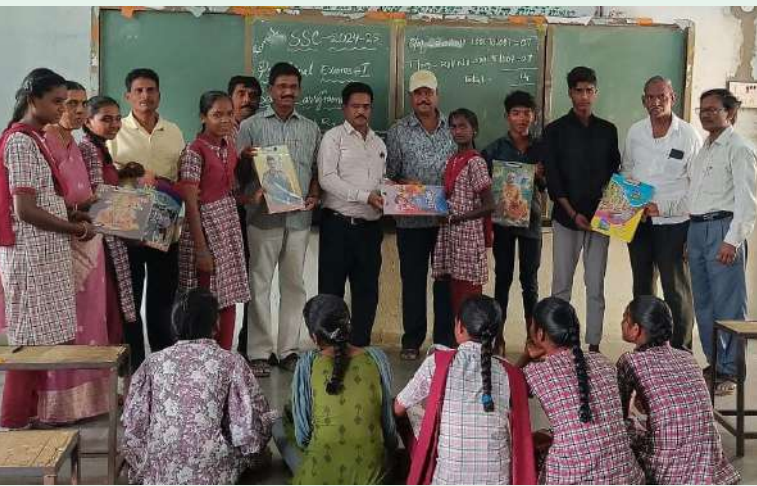
అక్షర విజేత వీవనగండ్ల

వీవనగండ్ల మండల పరిధిలోని కల్వరాల గ్రామంలో ఉన్న జిల్లా పరిషత్ ఉన్నత పాఠశాలలో పదవ తరగతి చదువుతున్న విద్యార్థులకు పరీక్ష ప్యాక్లు క్లాస్టర్ క్లబ్ సభ్యులు ఉచితంగా పంపిణీ చేశారు.