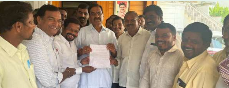
అక్షర విజేత, ఇబ్రహీంపట్నం :-

-సమస్యలను వెంటనే పరిష్కరిస్తామని హామీ ఇచ్చిన ఎమ్మెల్యే మల్ రెడ్డి రంగారెడ్డి.