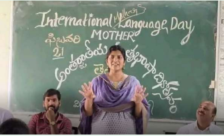
అక్షరవిజేత, దేవరకొండ ప్రతినిధి

దేవరకొండ ఎంకేఆర్ ప్రభుత్వ డిగ్రీ కళాశాలలో తెలుగు, ఆంగ్ల విభాగాల ఆధ్వర్యంలో అంతర్జాతీయ మాతృభాషా దినోత్సవ కార్యక్రమాన్ని ఘనంగా నిర్వహించారు.