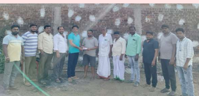
అక్షర విజేత నల్లబెల్లి