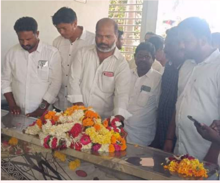
అక్షర విజేత నేలకొండపల్లి