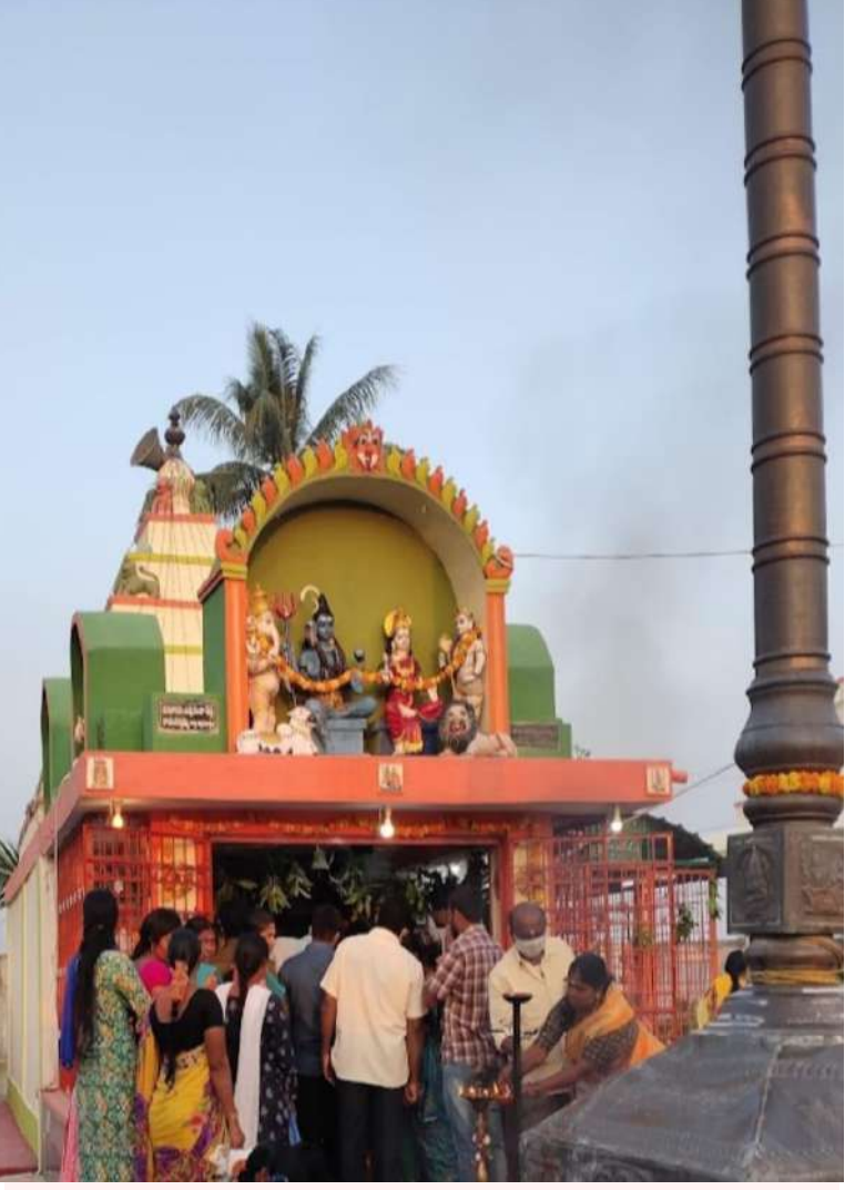
అక్షర విజేత తిరుమలాయపాలెం

మాఘ మాసంలో కృష్ణ పక్షం చతుర్దశి తిథిలో వచ్చే మహాశివరాత్రి రోజున మహా శివరాత్రి నాడు కష్టాల నుంచి విముక్తి కోసం మూడు రోజుల క్రితం మహాశివరాత్రి రోజున శివుడిని ప్రసన్నం చేసుకోవడానికి పాలు, పెరుగు, తేనె గంగాజలంతో అభిషేకం చేయవచ్చు. రుద్రాభిషేకం చేయడం వల్ల భక్తులకు శివునిప్రత్యేక అనుగ్రహం లభిస్తుంది జీవితంలో సుఖ సంతోషాలు, సంపదలు వస్తాయని నమ్ముతారు. మహా శివరాత్రి రోజున శివుడు, పార్వతి దేవి వివాహం జరిగింది. అందుకే ఈ రోజు శివ భక్తులకు ముఖ్యమైన రోజు. శివ భక్తులు ఈ రోజు కోసం సంవత్సరం అంతా వేచి చూస్తారు. శివుని ఆశీర్వాదం పొందడానికి, ఈ రోజు ఉపవాసం ఉంటారు. మహాశివరాత్రి హిందువులు ఆచరించే ఒక ముఖ్యమైన పండుగ. ఇది శివ, పార్వతుల వివాహం జరిగిన రోజు. ఈ రోజు రాత్రి శివుడు తాండవం చేసే రోజు. హిందువుల క్యాలెండరులో ప్రతి నెలలో వచ్చే శివరాత్రిని మాన శివరాత్రి అంటారు. కానీ శీతాకాలం చివర్లో వేసవి కాలం ముందు వచ్చే మహాశివరాత్రి సందర్భంగా తెలంగాణ ఆర్డీసీ మహా శివరాత్రి పండుగ సందర్భంగా ప్రయాణికులకు తెలంగాణ ఆర్డీసీ గుడ్ న్యూస్ వినిపించింది. మహా శివరాత్రి పండుగ సందర్భంగా రాష్ట్రంలోని ప్రముఖ శైవ క్షేత్రామై న తీర్థాలకు ప్రత్యేక బస్సులు నడపనున్నట్లు ప్రకటించింది.