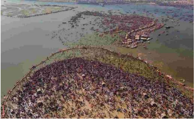
లక్నో, ఫిబ్రవరి 25: ప్రయాగ్ రాజ్ వేదికగా జరుగుతున్న మహా కుంభమేళా మరొకప్పుడు గంటల్లో ముగియనుంది. 144 ఏళ్లకు ఒక్కసారి వచ్చే ఈ మహాకుంభ మేళ.. ఫిబ్రవరి 26వ తేదీ శివరాత్రి రోజు ముగియనుంది. మహాకుంభ మేళ చివరి రోజు కావడంతోపాటు అదే రోజు శివరాత్రి పర్వదినం కూడా కావడంతో.. గంగా స్నానానికి భక్తులు పెద్ద సంఖ్యలో తరలి వచ్చే అవకాశముంది. యాత్రికులు రాకపోకలు సజావుగా సాగేందుకు ఉన్నతాధికార యంత్రాంగం పటిష్టమైన చర్యలు చేపట్టింది.

ముగియనున్న కుంభమేళ.. - అప్రమత్తమైన ప్రభుత్వం 2 రోజుల్లోనే రూ. 30,77,000 కోట్ల పెట్టుబడులు.. కేంద్ర హెబామంత్రి షా ప్రశంసలు భారతదేశాన్ని తయారీ కేంద్రంగా మారుస్తామని కేంద్ర హెబామంత్రి అమిత్ షా ( కీలక వ్యాఖ్యలు చేశారు. మధ్యప్రదేశ్ ) రాజధాని ఖోషాలో 2 రోజుల పాటు జరిగిన గ్లోబల్ ఇన్వెస్టర్స్ సమ్మిట్ చివరి రోజైన నేడు అమిత్ షా హజరైన క్రమంలో పేర్కొన్నారు. ఒకప్పుడు మధ్యప్రదేశ్ ను అనారోగ్య రాష్ట్రాలలో