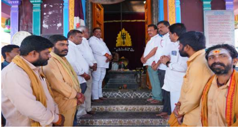
అక్షర విజేత పటాన్నెరుపు

మహాశివరాత్రి పర్వదినం పురస్కరించుకుని.. పటాన్నెరు దివిజన్ పరిధిలోని చైతన్య నగర్ లో గల శ్రీ శ్రీ మహాదేవుని ఆలయంలో నిర్వహించి వివిధ ఆధ్యాత్మిక కార్యక్రమాల పోస్టర్ ను మంగళవారం ఉదయం ఆలయ ప్రాంగణంలో స్థానిక