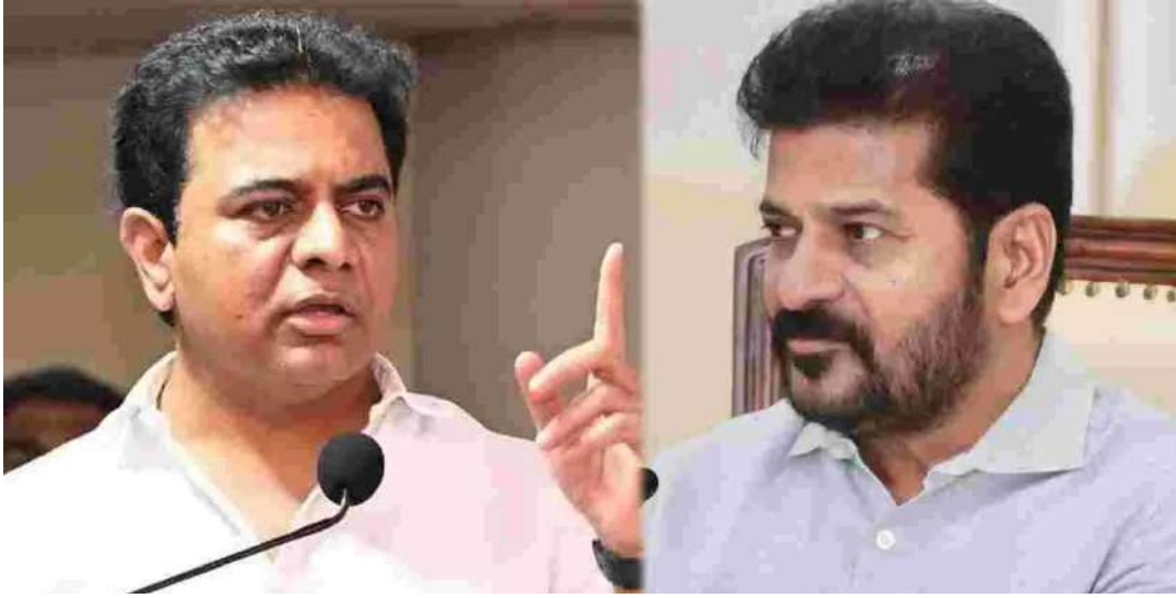
కే: తెలంగాణ ముఖ్యమంత్రి రేవంత్ రెడ్డి ఢిల్లీ పర్యటనపై బీఆర్ఎస్ పార్లమెంట్ ప్రెసిడెంట్, మాజీ మంత్రి కల్వకుంట్ల తారక రామారావు తీవ్ర విమర్శలు గుప్పించారు. ఇప్పుడు 36వ సారి కూడా రేవంత్ రెడ్డి ఢిల్లీ పోయారని విమర్శించారు. ఎన్నిసార్లు ఢిల్లీ పోయి కనీసం మంత్రివర్గ విస్తరణ కూడా చేసుకోలేకపోతున్నారని ఎద్దేవా చేశారు. హెబాంశాఖ, విద్యాశాఖ, సంక్షేమ శాఖకు మంత్రులను

ధిల్లి వెళ్లడం తప్పా.. తెలంగాణకు ఏం చేశారు.. రేవంత్పై కేటీఆర్ విసుర్లు