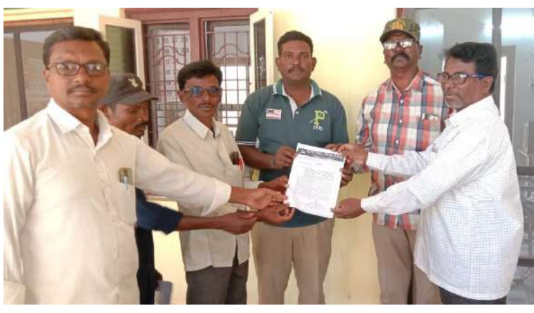
అక్షర విజేత అశ్వారావుపేట