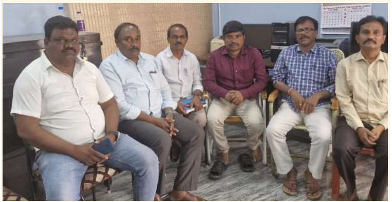
అక్షర విజేత ఖమ్మం: