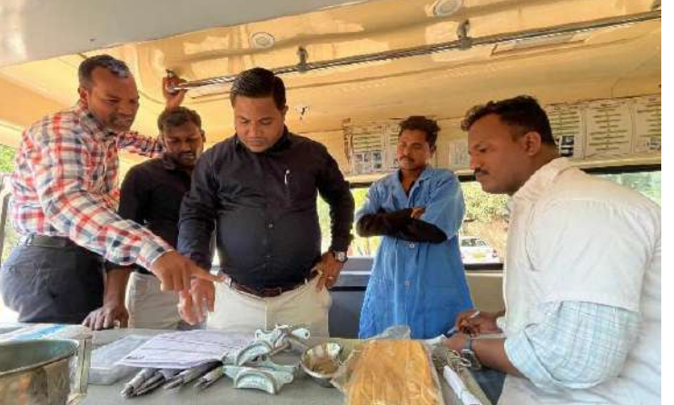
అక్షర విజేత నారాయణపేట/ మక్తల్