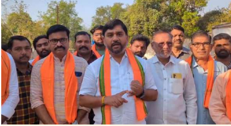
అక్షర విజేత కాగజ్ నగర్ ప్రతినిధి