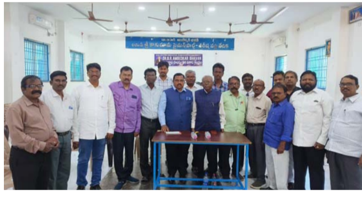
అక్షర విజేత, భీమవరం :