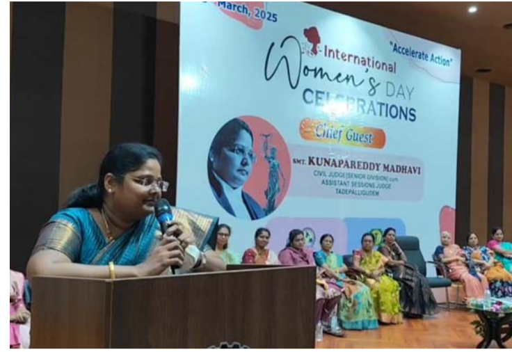
అక్షర విజేత పశ్చిమగోదావరి జిల్లా బ్యూరో (తాడేపల్లిగూడెం)