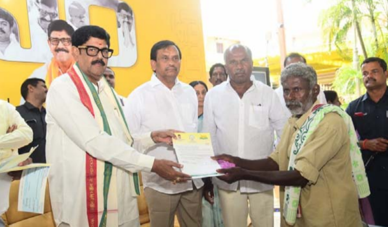
అక్షరవిజేత,మర్రిపాడు/నెల్లూరు బ్యూరో :