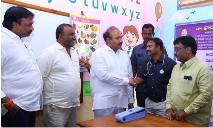
అక్షర విజేత ఎడ్లపాడు