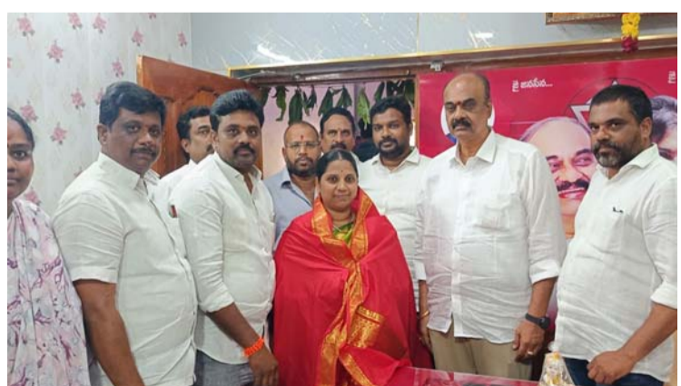
అక్షర విజేత పశ్చిమగోదావరి జిల్లా బ్యూరో (తాడేపల్లిగూడెం)