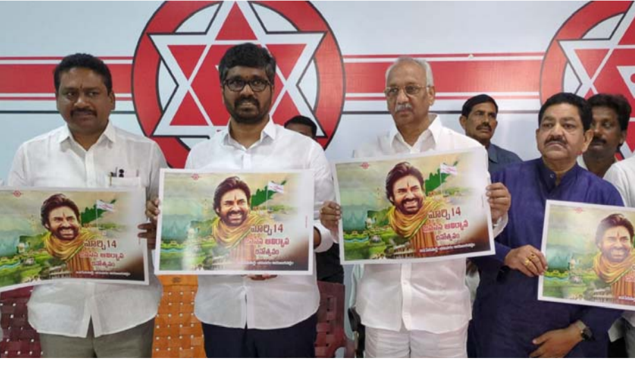
అక్షరవిజేత, భీమవరం :

ఈనెల 14న పితాపురంలో జరిగే జనసేన ఆవిర్భావ దినోత్సవ వేడుకలకు