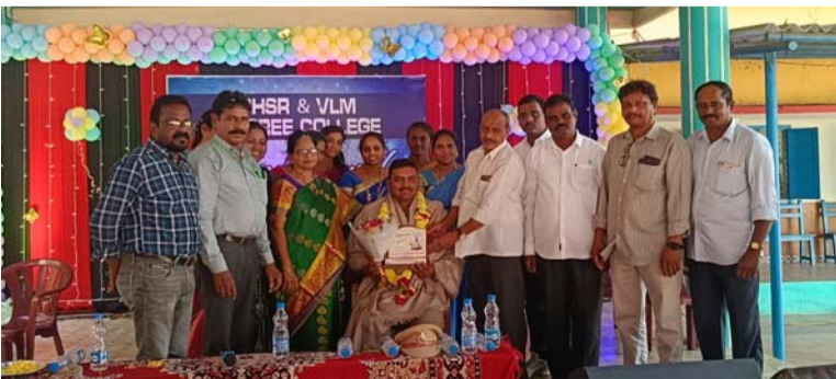
అక్షర విజేత, దేవరపల్లి