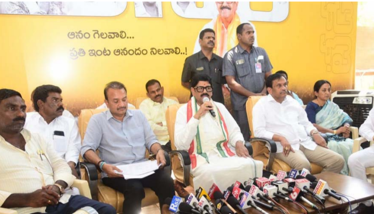
అక్షరవిజేత, నెల్లూరు బ్యూరో