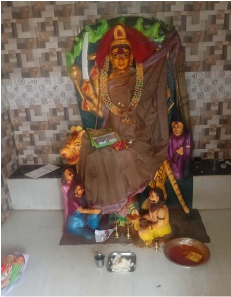
ఆలయాలకు వచ్చి మొక్కు బదులు చెల్లించుకొని ఎంపిక చేసుకున్న ప్రదేశాలకు వెళ్లి ఆహార పదార్థాలను తయారు చేసుకొని మొక్కులు చెల్లించిన మాంసాహారాన్ని అమ్మవార్లకు నైవేద్యంగా పెట్టి ఆరగించేవారు. ఆనంతరం అక్కడ ఏర్పాటు

మండలంలోని నందిగూడెం గ్రామంలో కొలువై ఉన్న శ్రీ కనకదుర్గ అమ్మవారి వార్షిక మహోత్సవాలు ఆదివారం ఘనంగా ప్రారంభమయ్యాయి. గ్రామ శివారులో పావ చెరువు గట్టు వద్ద ఉన్న ఈ అమ్మవారి ఆలయం భక్తులకు నిలయంగా మారింది. భక్తుల కొంగుబంగారంగా కోరిన కోర్కెలు తీర్చే అమ్మవారి గా కొలవబడు తున్న ఈ ఆలయాన్ని గత 80 ఏళ్ల కిందట రేగులకుంట గ్రామానికి చెందిన ఒక భక్తుడు నిర్మించినట్లు స్థానికులు చెబుతున్నారు. అప్పటినుండి ఇప్పటివరకు ఈ ఆలయం వద్ద ప్రతి ఏట ఐదు రోజులు పాటు ఉత్సవాలను నిర్వహించడం ఆనవాయితీ గా మారింది. గత కొన్ని ఏళ్ల కిందట ఈ ఆలయానికి వచ్చే భక్తుల సంఖ్య భారీగా ఉండేది. మండలంలోని భక్తులతో పాటు కొయ్యలగూడెం, దేవవల్లి, తాళ్లపూడి, పోలవరం మండలాలకు చెందిన భక్తులు అధిక సంఖ్యలో ఆలయానికి వచ్చి అమ్మవారిని దర్శించుకునేవారు. ఆలయం వెనుక భాగంలో ఉన్న పావ చెరువు తీరంలో అధిక విస్తీర్ణంలో తుమ్మ తదితర చెట్లు ఉండేవి. సుమారు పదిహేను సంవత్సరాల క్రితం సుదూర ప్రాంతాల నుండి ఎడ్ల బండ్లు, ట్రాక్టర్లు వంటి వాహనాలపై భక్తులు గూడు ఏర్పాటు చేసుకొని ఈ ఆలయానికి కుటుంబ సమేతంగా వచ్చేవారు. అక్కడ ఉన్న శ్రీ కనకదుర్గమ్మ, పెద్దింట్లమ్మ అమ్మవార్ల