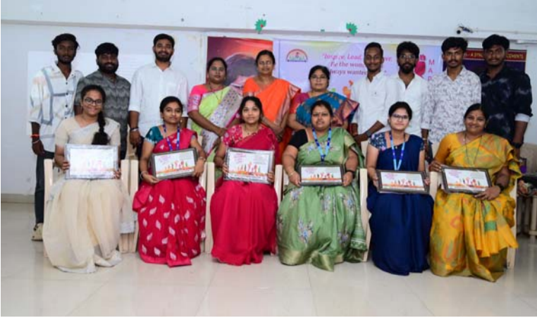
అక్షర విజేత పశ్చిమగోదావరి జిల్లా బ్యూరో (తాడేపల్లిగూడెం)