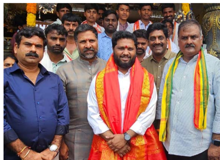
అక్షర విజేత, దేవరపల్లి