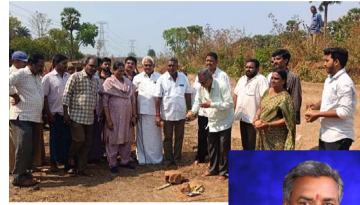
అక్షర విజేత కోటనందూరు.