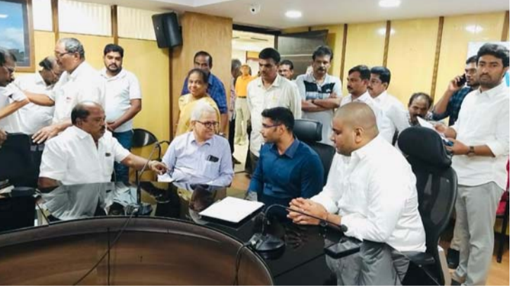
అక్షర విజేత విశాఖ బ్యూరో