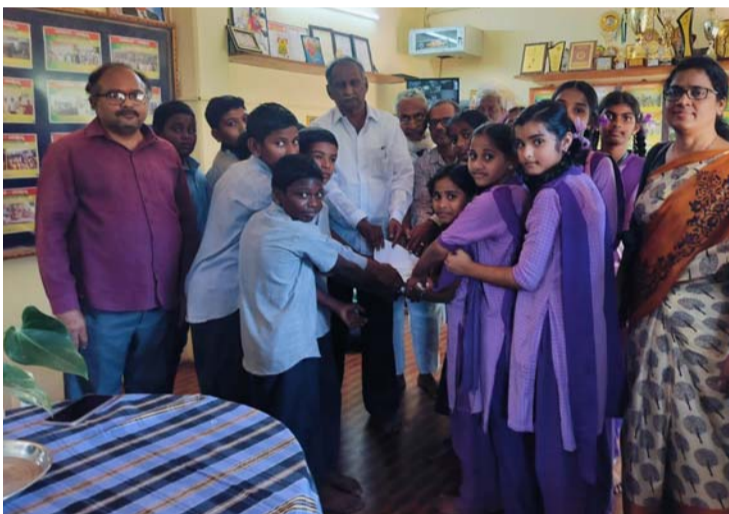
అనాధ పిల్లలకు చేయూత.