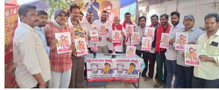
గోపాలపురం అక్షర విజేత,