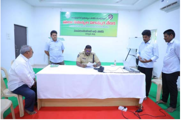
అక్షర విజేత పల్నాడు జిల్లా, సరసరావుపేట

? ఈ ప్రజా సమస్యల పరిష్కార వేదిక కార్యక్రమంలో ప్రజల నుండి కుటుంబ, ఆర్థిక, ఆస్తి తగాదాలు మొదలగు ఆయా సమస్యలకు సంబంధించి 106 ఫిర్యాదులు అందాయి.