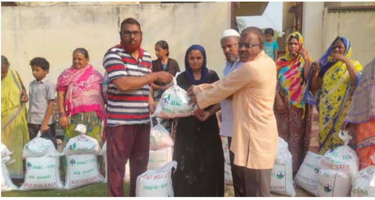
అక్షర విజేత మంగళగిరి.....!