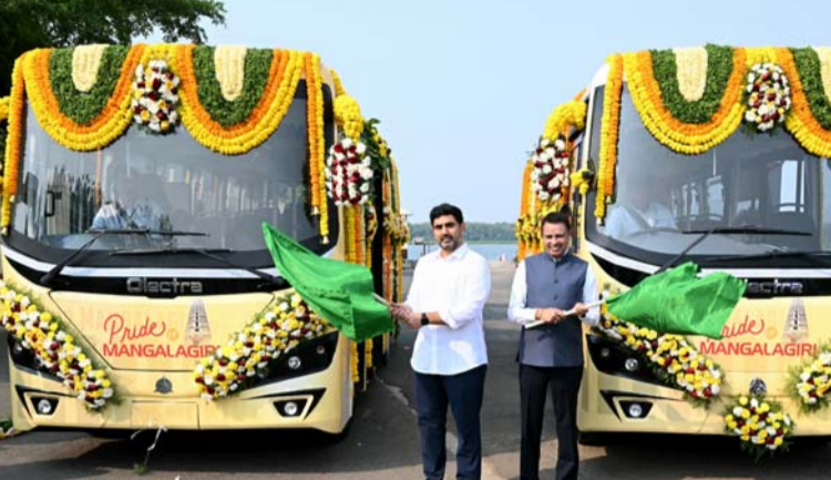
అక్షర విజేత మంగళగిరి.....!

ఎయిమ్స్ కు ఒకటి, లక్ష్మీనరసింహస్వామి ఆలయానికి మరొకటి సిఎస్ఆర్ కింద ఎలక్ట్రిక్ బస్సులను అందజేసిన మెగా ఇంజనీరింగ్ ఉచిత బస్ సర్వీసులను ప్రారంభించిన మంత్రి నారా లోకేశ్