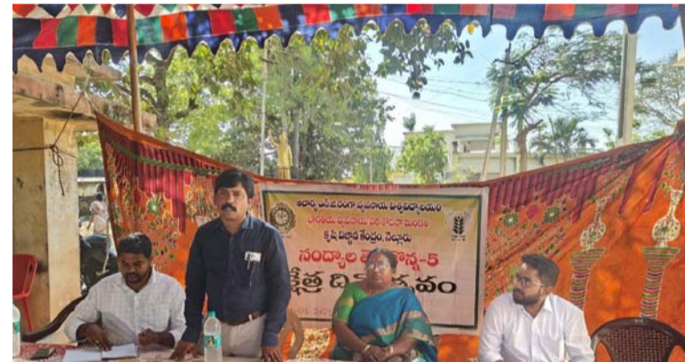
లలిత శివ జ్యోతి తెలిపారు. మినుము, పెసర మరియు శనగ పంటలకు ప్రత్యమ్మయంగా జొన్న పంట తక్కువ ఖర్చుతో మంచి లాభాలు చేకూరుస్తుందని

మరిపాడు మండలం కంపనముద్రం గ్రామంలో కృషి విజ్ఞాన కేంద్రం, నెల్లూరు అధ్యక్షులతో జొన్న పంటలో క్షేత్ర దినోత్సవం నిర్వహించటం జరిగింది. ఈ సంవత్సరం కంపనముద్రం గ్రామంలో వంద ఎకరాలు నంద్యాల తెల్ల జొన్న - 5 (ఎన్ టీ జె -5) రకం కృషి విజ్ఞాన కేంద్రం, నెల్లూరు వారి సహకారంతో రైతులు వేయటం జరిగింది. రైతులు ఈ యొక్క రకం యుడల సంతుష్టి చెంది దిగుబడి బాగుందని హర్షం వ్యక్తం చేశారు. జిల్లాలో జొన్న వేసుకునే రైతులు ఈ రకాన్ని వేసుకొని మంచి లాభాలు పొందాలని కృషి విజ్ఞాన కేంద్రం, సమన్వయకర్త డా. జి.