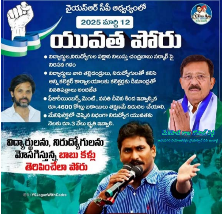
అక్షర విజేత ఉదయగిరి..