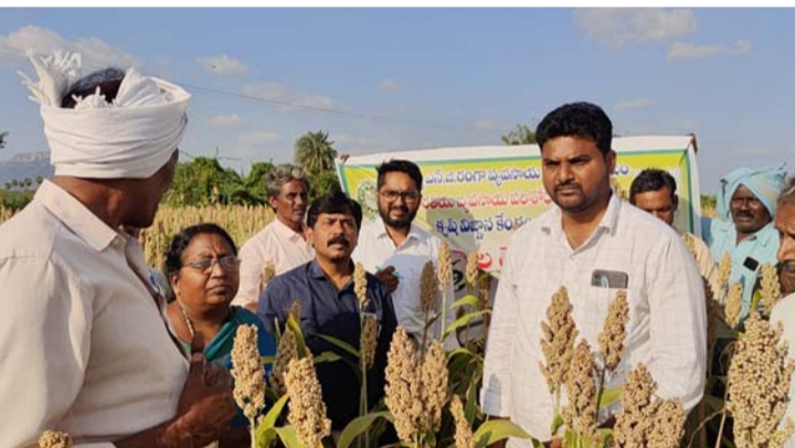
అక్షరవిజేత,మరిపాడు/నెల్లూరు బ్యారో :

మరిపాడు మండలం కంపనముద్రం గ్రామంలో కృషి విజ్ఞాన కేంద్రం, నెల్లూరు అధ్యక్షులతో జొన్న పంటలో క్షేత్ర దినోత్సవం నిర్వహించటం జరిగింది. ఈ సంవత్సరం కంపనముద్రం గ్రామంలో వంద ఎకరాలు నంద్యాల తెల్ల జొన్న - 5 (ఎన్ టీ జె -5) రకం కృషి విజ్ఞాన కేంద్రం, నెల్లూరు వారి సహకారంతో రైతులు వేయటం జరిగింది. రైతులు ఈ యొక్క రకం యుడల సంతుష్టి చెంది దిగుబడి బాగుందని హర్షం వ్యక్తం చేశారు. జిల్లాలో జొన్న వేసుకునే రైతులు ఈ రకాన్ని వేసుకొని మంచి లాభాలు పొందాలని కృషి విజ్ఞాన కేంద్రం, సమన్వయకర్త డా. జి.