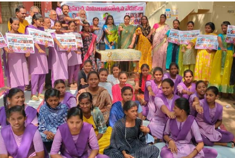
అక్షరవిజేత, భీమవరం :