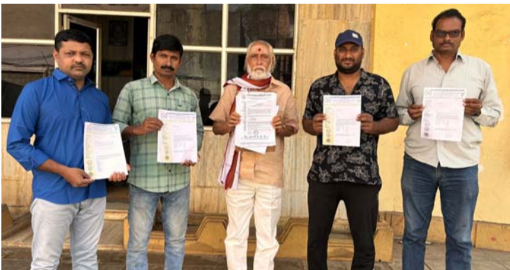
అక్షరవిజేత, భీమవరం :