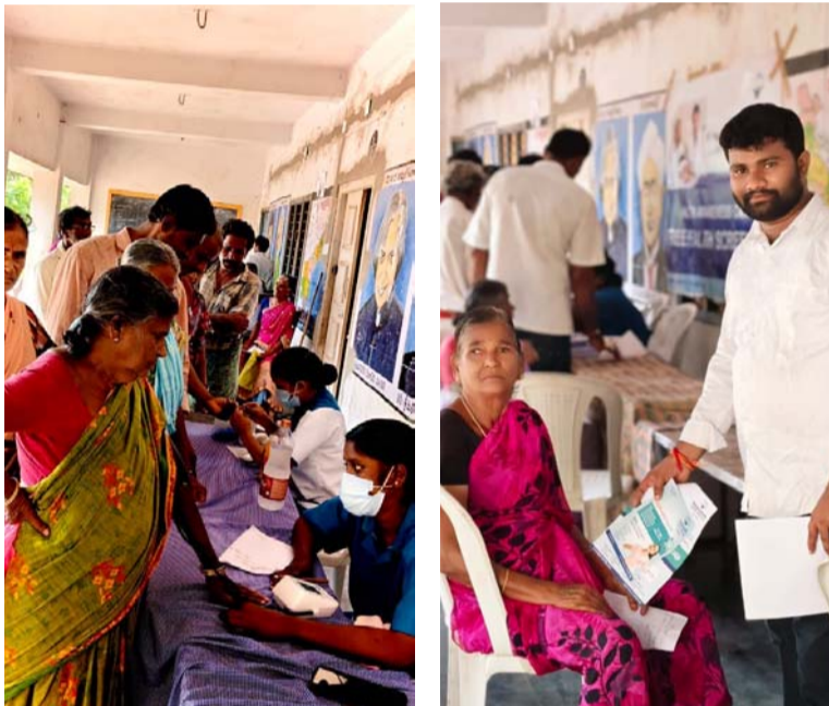
అక్షర విజేత ఉదయగిరి..

పుట్టి పెరిగిన ఊరికి సేవ చేసే భాగ్యం కలగడం అదృష్టం అని ఉన్నత చదువులు చదివి వ్యాపారంలో స్థిరపడి పురిటి గడ్డ నే మరచి నేటి రోజుల్లో వ్యాపార రంగంలో