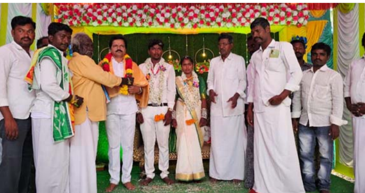
అక్షర విజేత ఎమ్మిగనూరు (నందవరం)