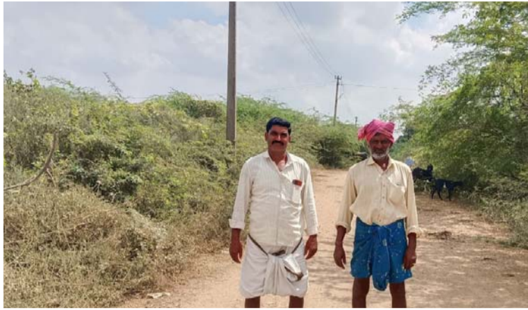
అక్షర విజేత ఉదయగిరి..

శ్రీ పొట్టి శ్రీరాములు నెల్లూరు జిల్లా వింజమూరు మండలం కాటేపల్లి పంచాయతీ నల్లారెడ్డి వల్లి గ్రామం 60 కుటుంబాల నివాసం, 150 మంది జనాభా,