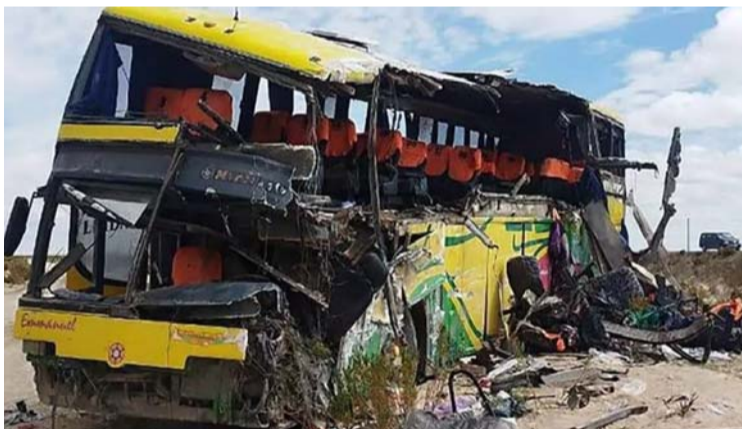
అక్షర విజేత, హైదరాబాద్:

బొలివియాలో ఘోర రోడ్డు ప్రమాదం జరిగింది. రెండు బస్సులు ఢీకొన్న ఘటనలో 37 మంది దుర్మరణం పాలయ్యారు. మరో 39 మందికి తీవ్ర గాయాలయ్యాయి. క్షతగాత్రులను దగ్గరలోని ఆసుపత్రికి తరలించి చికిత్స అందిస్తున్నారు. అతివేగమే ఈ ప్రమాదానికి కారణమని పోలీసులు తెలిపారు. బస్సులలో ఒకటి ఎదురుగా ఉన్న లేన్ లోకి దూసుకెళ్లడం వల్లే ఎదురుగా ఉన్న బస్సు ఢీకొంది అధికారులు తెలిపారు. ప్రపంచంలోనే అతిపెద్ద ఉప్పునీటి మైదానం అయిన సాలార్ డి ఉయూనికి ప్రవేశ ద్వారంగా పిలువబడే ఉయూని ప్రతి సంవత్సరం వేలాది మంది పర్యాటకులను ఆకర్షిస్తుంది. పోటోస్ డిపార్ట్మెంట్లో పోటోస్ కమాండ్ ప్రతినెది మరణాలను దృవీకరించారు. "ఈ ఘోర ప్రమాదం ఫలితంగా, ఉయూని పట్టణంలోని నాలుగు ఆసుపత్రులలో 39 మంది క్షతగాత్రులు చికిత్స పొందుతున్నారు. 37 మంది ప్రాణాలు కోల్పోయారు" అని ప్రతినెది తెలిపారు.