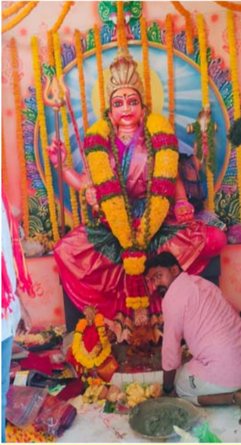
గోపాలపురం అక్షర విజేత,

మండలంలోని గుడ్డిగూడెం గ్రామ శివారులో సూతనంగా నిర్మించిన శ్రీ గుబ్బల మంగమ్మ అమ్మవారి ఆలయంలో విగ్రహ ప్రతిష్ఠ మహోత్సవ కార్యక్రమం ఆదివారం ఘనంగా జరిగింది. గుడ్డిగూడెం నుండి కొవ్వూరు పాడు వెళ్లే ప్రధాన రహదారి ప్రక్కన మామిడి తోటలో ఈ ఆలయాన్ని నిర్మాణం గావించారు. ఆలయంలో అమ్మవారి విగ్రహాన్ని ప్రతిష్ఠించారు. ఈ సందర్భంగా శనివారం ఉదయం 6 గంటల నుండి శాస్త్రోక్తంగా వందేతుల వేదమంత్రాలు నడుపు కార్యక్రమం ప్రారంభమైంది. ముందుగా విఘ్నేశ్వర పూజ, పుణ్య హవాచన, పంచ గవ్య ప్రార్థన, దీక్ష ధారణ, జలాధివాసము, క్షీరాధివాసము, ధాన్యాధివాసము వంటి కార్యక్రమాలు నిర్వహించారు. ఆదివారం ఉదయం గణపతి పూజ, పుణ్య హవాచనంతో పూజ ప్రారంభమైంది. అనంతరం ఉదయం 11 గంటల 20 నిమిషాలకు అమ్మవారి విగ్రహ ప్రతిష్ఠావన, శిఖర ప్రతిష్ఠ కార్యక్రమం చేపట్టారు.