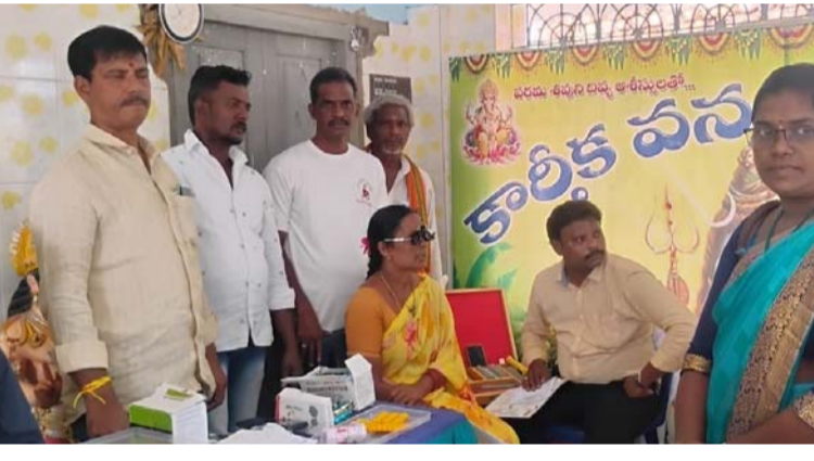
అక్షర విజేత, ప్రత్తిపాడు ప్రతినిధి:

విలేజ్ కరం మండలంలోని లింగంపర్తి గ్రామంలో వివేకానంద సేవా సమితి