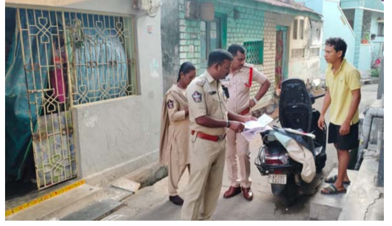
అక్షర విజేత గోపాలపట్నం:

“టక్” “టక్” “టక్” “వీధులలో పోలీసుల బూట్లు చప్పుడే పడకుని తెగుస్తున్న జనం, విధుల్లో భాగంగా వీధుల్లో కార్లెన్ సెర్చ్ కొనసాగిస్తున్న పోలీసులు, గందరగోళం లో జనం ఏమయింది అంటూ తమలో తామే చర్చించుకోవటం, ఆందోలనతో ఒక్కొక్క ఒకరు ప్రశ్నించుకోవటం, ఈ సంఘటన పశ్చిమ నియోజకవర్గం కొత్తపాలెం దరి గణపతి నగర్ లో ఆదివారం తెల్లవారుజామున జరిగింది. గోపాలపట్నం పోలీసులు తమ విధులు లో భాగంగా కార్లెన్ సెర్చ్ నిర్వహించారు, ఈ సందర్భంగా గణపతి నగర్ లో ఇంటింటికి తిరిగి ద్వీచక్ర వాహనాలను తనిఖీ చేశారు, సరైన పత్రాలు లేని, నెంబర్ ప్లేట్లు లేని, ఉన్నా సరిగ్గా లేనివి, వాహన యజమాని దగ్గర కాకుండా వేరే వ్యక్తి దగ్గర ఉన్న వాహనాలను, స్వాధీనం చేసుకున్నారు, అయితే ఈ తరంగం అంతా వేకువజామున ఆరుగంటల కే మొదలైంది ఇంటి తలుపులు తట్టి పడుకున్నవారిని లేపి మరీ తనిఖీలు చేయటం కరెక్ట్ కాదని, ఈ విధంగా తెల్లవారుజామున పోలీసులను వీధులలో చూడటంతో ఏం జరిగిందో అని ఆందోళనకు గురయ్యామని, ఇది ఎంతవరకూ సమంజసమని పలువురు ప్రశ్నిస్తున్నారు.