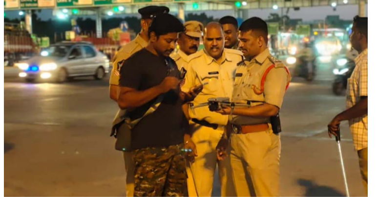
అక్షర విజేత మంగళగిరి....!

ద్వీచక్ర వాహనం నడిపేవారు తప్పనిసరిగా హెల్మెట్ ధరించవలెను ద్వీచక్ర వాహనంపై ముగ్గురు వ్యక్తులు ప్రయాణించరాదు. ఇతర వాహనాల నడిపేవారు తప్పనిసరిగా సీట్ బెల్ట్ ధరించవలెను, అలానే వాహనాలను అతివేగంగా నడపరాదని గ్రామ ప్రజలకు తెలపడం అయినది దీనిలో భాగంగా మంగళగిరి మండలం టోల్ ప్లాజా వద్ద వాహనాల తనిఖీ చేయగా పై నిబంధనలను ఉల్లంఘించిన వారికి జరిమానా విధించడం జరిగినది కావున ప్రజలందరూ గమనించగలరు