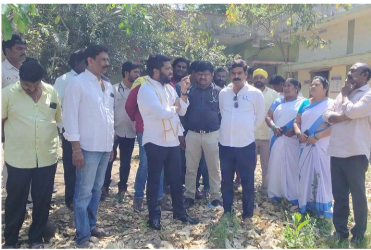
అక్షర విజేత, దేవరపల్లి

గోపాలపురం ఎమ్మెల్యే మద్దిపాటి వెంకట రాజు పిలుపు కూటమి నాయకులతో ఆరోగ్య కేంద్రం పరిశీలన