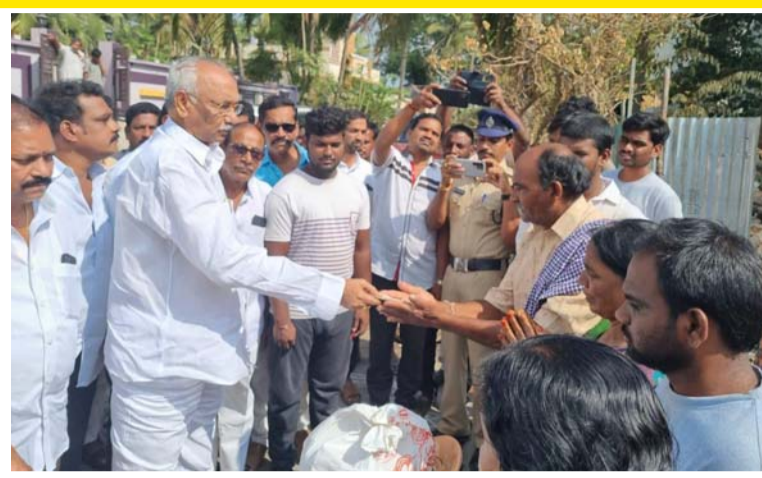
తెలుసుకున్న ఎమ్మెల్యే అంజిబాబు అగ్ని ప్రమాద బాధితులను పరామర్శించారు. అండగా ఉంటామని, సహాయ సహకారాలను అందిస్తామని అన్నారు. అనంతరం దాతల సహకారంతో నిత్యవసర

రామాంజనేయులు (అంజిబాబు) అన్నారు. వీరవాసరం మండలం రాయకుడు గుండల వారి వీధిలో షార్ట్ సర్క్యూట్ తో తోట రాంపండు తాటాకి ఇల్లు శుక్రవారం అగ్నికి ప్రమాదానికి గురైంది. సంఘటన