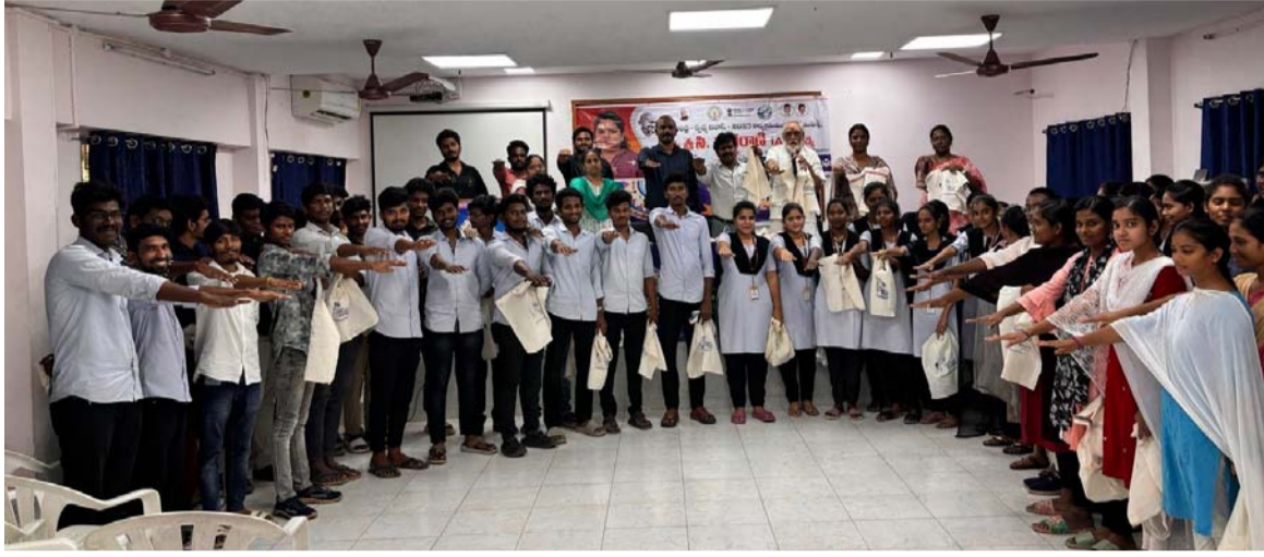
అక్షరవిజేత, భీమవరం :