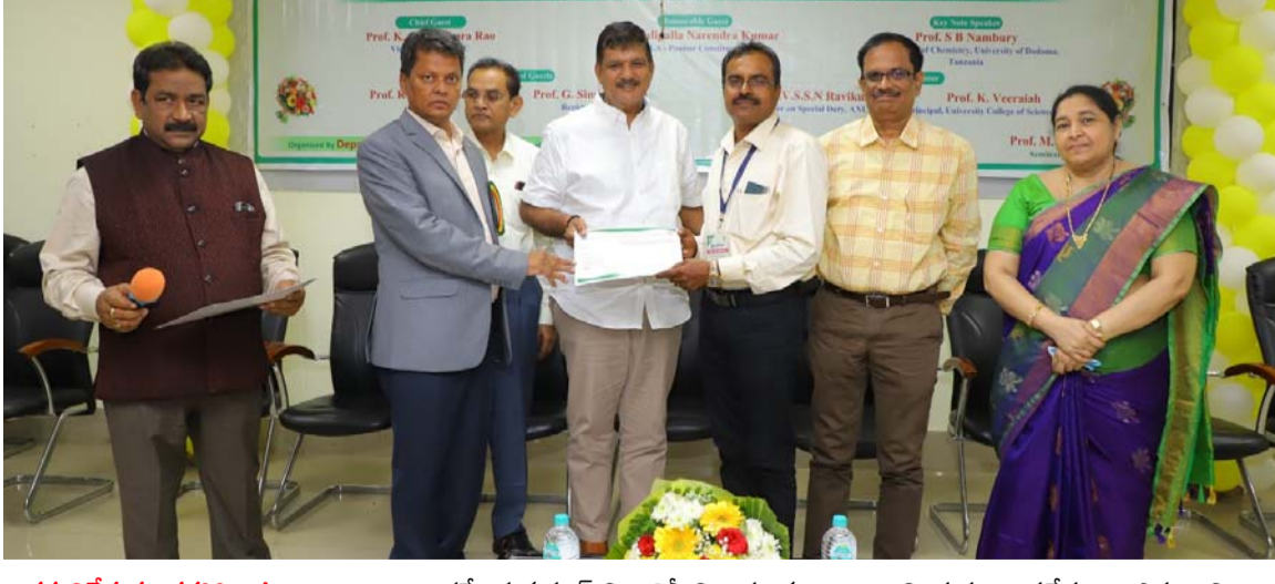
అక్షర విజేత మంగళగిరి....!