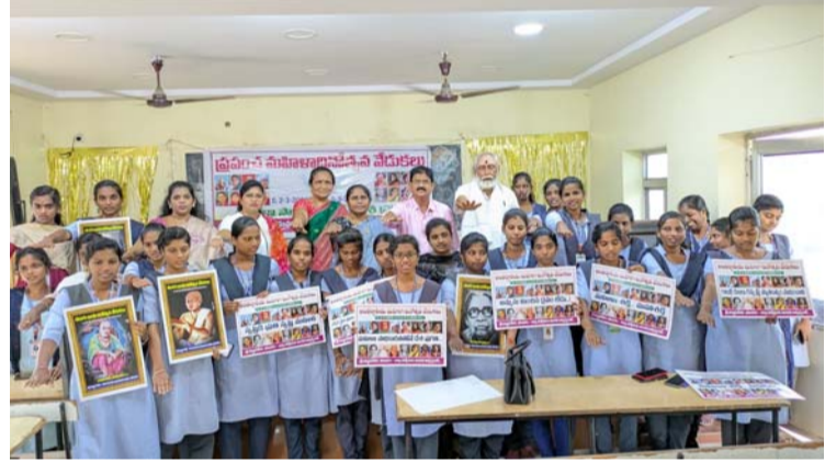
అక్షరవిజేత, భీమవరం :