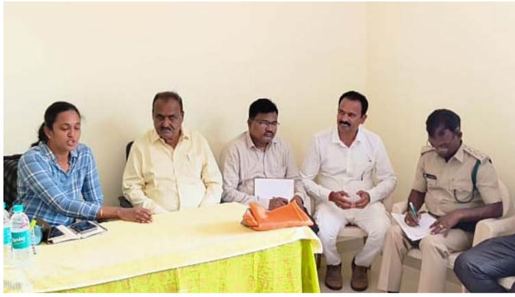
అక్షర విజేత, కుప్పం