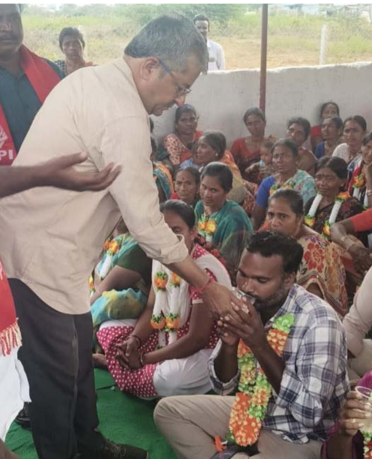
అక్షరవిజేత, బద్వేల్/నల్గూరు బ్యారో :

గత కొంతకాలంగా బద్వేల్ మండలం సి కొత్తపల్లి గ్రామ పాలంలో నివసిస్తున్న