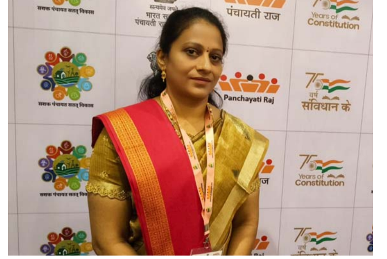
అక్షరవిజేత, సురీపాడు/నెల్లూరు జ్యూరీ :