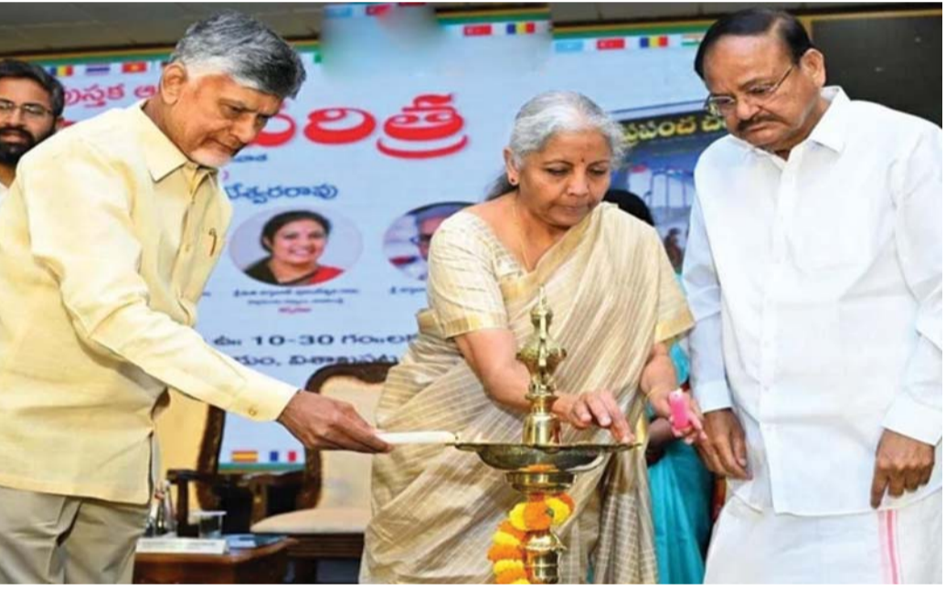
మరొక పుస్తకం రాయాలి అని కోరుకుంటున్నా : వెంకయ్య నాయుడు వివరాలు 2లో..