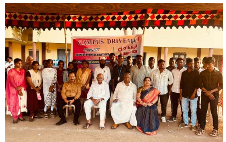
అక్షర విజేత చిలకలూరిపేట