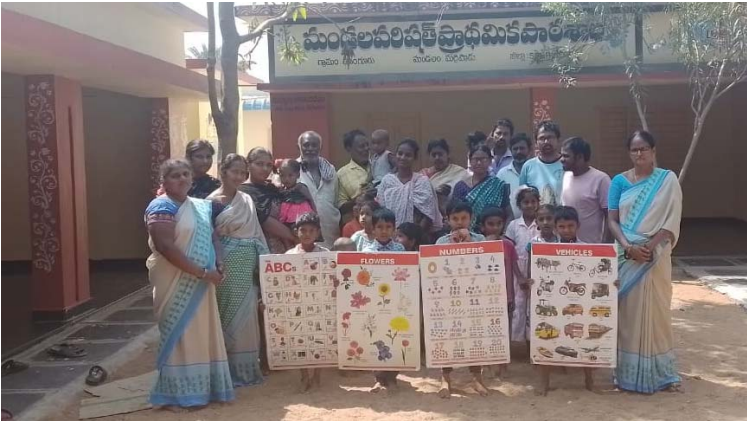
అక్షరవిజేత, ముద్రిపాడు/నెల్లూరు బ్యూరో