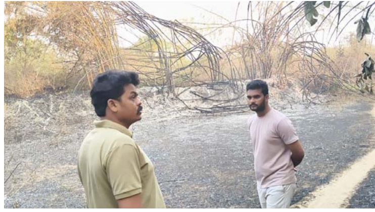
అటవీ ప్రాంతంలో కార్మిళ్ళు తో సమీపంలోని ఆయిల్ పామ్ తోట దగ్గం