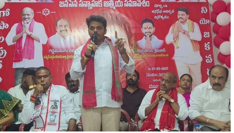
అక్షర విజేత, దేవరపల్లి