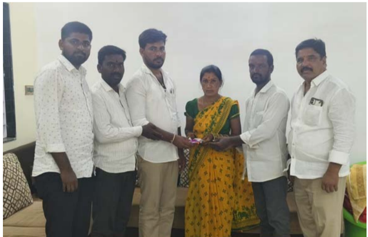
అక్షర విజేత, శివంపేట.