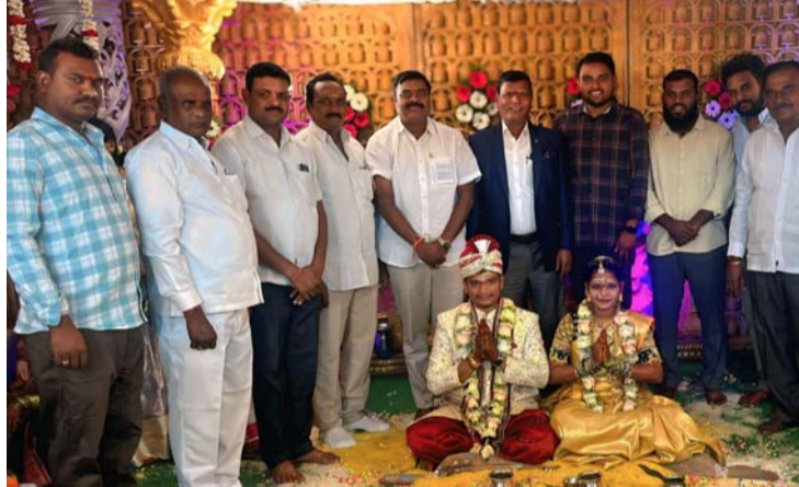
అక్షర విజేత గణపూరం: