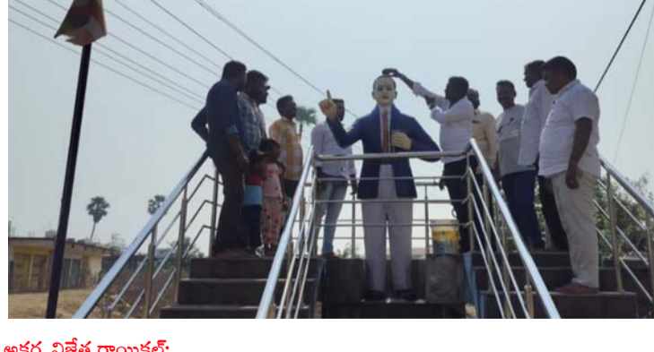
అక్షర విజేత, రాయికల్: