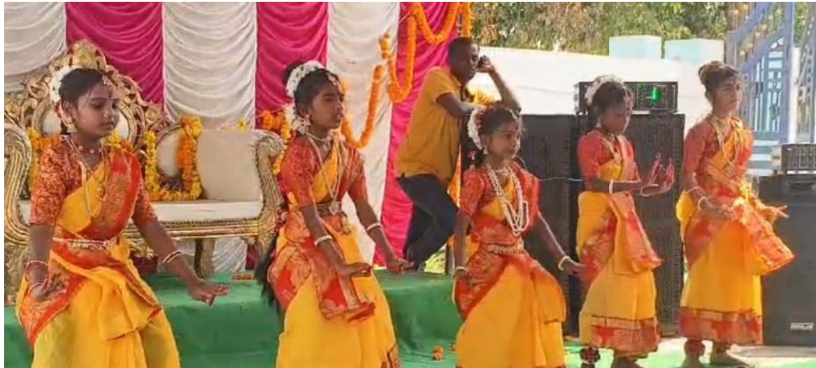
అక్షర విజేత, చంద్రుర్ / రాజన్న సిరిసిల్ల ప్రతినిధి :