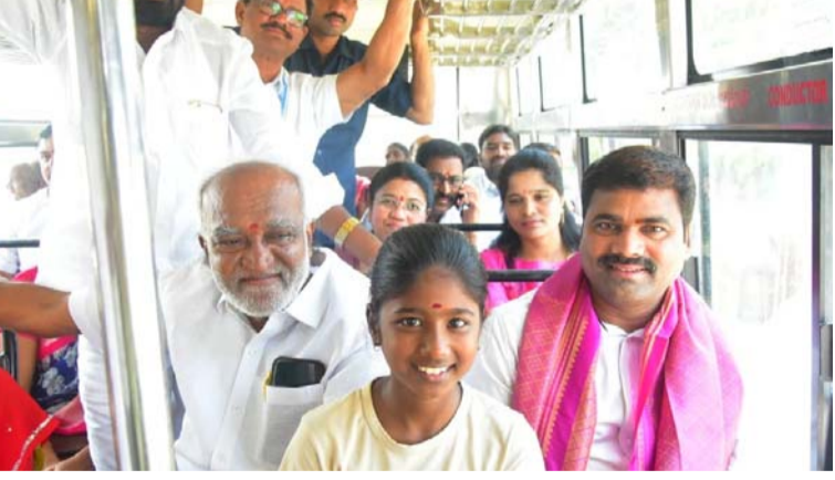
అక్షర విజేత చొప్పడండి

తీవ్రంగా ఇబ్బంది పడ్డారు. అంతేకాకుండా మిసి సిరిసిల్ల గా పేరు