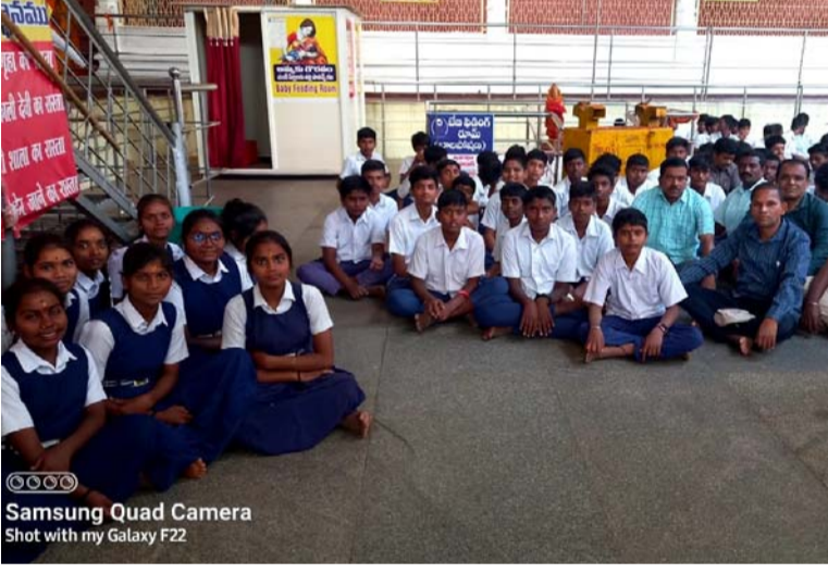
దీనివల్ల విద్యార్థులకు ఎలాంటి లాభాలు ఉంటాయి అనే విషయాల గురించి తెలుసుకోవడం జరిగింది. దానితోపాటు బాసరలోని జ్ఞాన సరస్వతి దేవి అలయాన్ని కూడా విద్యార్థులు దర్శించుకోవడం జరిగింది. విద్యార్థుల ఆహ్వాదం కోసం పక్కనే ఉన్నటువంటి ఆరిసాగర్ చెరువు కూడా

లో భాగంగా పాఠశాలలోని తొమ్మిది పదవ తరగతి చదువుతున్న విద్యార్థులు బాసరలోని ఐఐఐటీ కళాశాలను సందర్శించడం జరిగింది. అక్కడ ఉన్నటువంటి విద్యార్థులతో ముఖాముఖీ కార్యక్రమంలో పాల్గొని సాంకేతిక విద్య విద్యార్థులకు ఏ విధంగా ఉపయోగపడుతుంది భవిష్యత్తులో