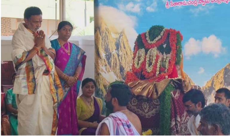
అక్షర విజేత గజ్వేల్:

సిద్దిపేట జిల్లా మర్నాక్ మండలం పాములపర్తి గ్రామంలోని శ్రీ సీతారామచంద్రస్వామి దేవాలయ వార్షిక బ్రహ్మోత్సవములు అంగరంగ వైభవంగా జరుగుతున్నాయి. మూడవ రోజు ఆదివారం సుదర్శన చక్ర ప్రతిష్ఠ కార్యక్రమంలో భాగంగా ఉదయం 9 గంటల 36 నిమిషాలకు పునర్వసు నక్షత్రయుక్త మేష లగ్న సుముహూర్తమైన విమాన గోపుర సుదర్శన ప్రతిష్ఠ అంగరంగ వైభవంగా వేద పండితులచే వేదమంత్రాల మధ్య అట్టహాసంగా జరిగింది. అధిక సంఖ్యలో భక్తులు పాల్గొని శ్రీరామ్ జై రామ్ జై రామ్ అంటూ నినాదాలతో పాములపర్తిలో ఆధ్యాత్మిక వాతావరణం నెలకొంది. అనంతరం పూర్ణాహుతి కార్యక్రమం నిర్వహించారు. అనంతరం శ్రీ సీతారామచంద్రస్వామి కళ్యాణం వేద పండితులు తిగుళ్ల సనాతన సారధి మంత్రోచ్ఛనులతో ఆలయ వ్యవస్థాపకులు