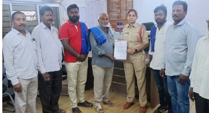
అక్షర విజేత, చొప్పడండి: