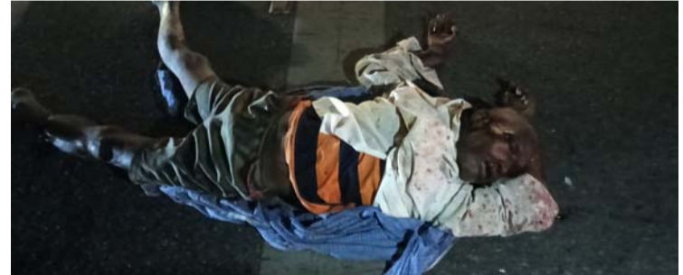
అక్షర విజేత నారాయణపేట/మరికల్

మరికల్ మండల కేంద్రంలో శ్రీ వాణి విద్యా మందిర్ స్కూల్ దగ్గర శనివారం అర్ధరాత్రి సమయంలో గుర్తు తెలియని వాహనం ఢీకొని గుర్తుతెలియని వ్యక్తి అక్కడికక్కడే మృతి చెందాడు. ఆ వ్యక్తి వయసు అంచనా 60 సంవత్సరాలు ఉంటుందని తెలిపి వాహనదారులు మరికల్ పోలీస్ ఠాణికిరాలకు సమాచారం అందించడం జరిగింది. ఘటన స్థలానికి చేరుకొని పోలీసులు మృతదేహాన్ని పోస్టుమార్టం కొరకు నారాయణపేట జిల్లా ఆస్పత్రికి తరలించారు ఈ సంఘటనపై మరికల్ ఎస్పీ రాము కేసు నమోదు చేసుకొని దర్యాప్తు చేస్తున్నామని తెలిపారు.