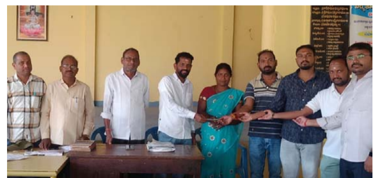
అక్షర విజేత, రాయికల్: