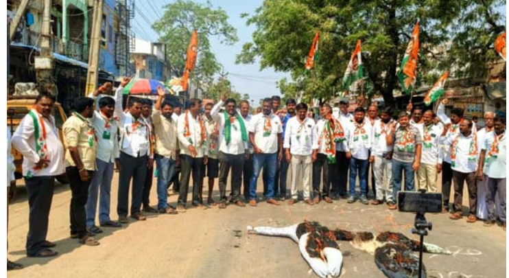
అక్షర విజేత, మోర్లాడ్ :