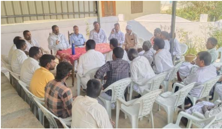
ఇండ్లు ఇవ్వాలని చెప్పారు. ప్రస్తుత ప్రభుత్వం ప్రజలను మోసం చేసి గడ్డెనికొక తర్వాత ప్రజలకు ఇచ్చిన హామీలను మరచిపోయిందని. మహిళలకు పూర్తిగా మోసం చేసిందని దుయ్యబట్టారు.