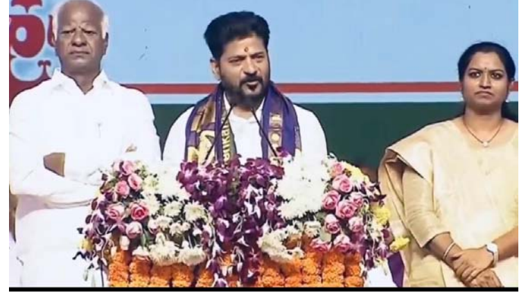
అక్షర విజేత జనగామ ప్రతినిధి:

కడియం శ్రీహరి నియోజకవర్గమైన స్టేషన్ గణపూరం కాంగ్రెస్ పార్టీ జరిగిన భారీ బహిరంగ సభను ప్రజలు కార్యకర్తలు పెద్ద ఎత్తున పాల్గొని సభను విజయవంతం చేయడం జరిగింది. సీఎం రేవంత్ రెడ్డి పలు అభివృద్ధి కార్యక్రమాలకు శంకుస్థాపన చేయడం జరిగింది. ఈ సందర్భంగా రేవంత్ రెడ్డి మాట్లాడుతూ నియోజకవర్గం అభివృద్ధి చెందాలంటే కడియం శ్రీహరి నాయకత్వాన్ని బలపరచాలని ప్రజలకు విజ్ఞప్తి చేశారు. ఈ సందర్భంగా నిర్వహించిన స్టాఫ్ ని సీఎం రేవంత్ రెడ్డి సందర్శించడం జరిగింది కడియం శ్రీహరి గారి నాయకత్వాన్ని బలపరిస్తే నియోజకవర్గం అభివృద్ధి అన్ని విధాల సహకారం అందిస్తానని సభాముఖంగా సీఎం రేవంత్ రెడ్డి హామీ ఇవ్వడం జరిగింది ఈ భారీ బహిరంగ సభకు ఉమ్మడి వరంగల్ జిల్లా అన్ని గ్రామాల నుండి ప్రజలు కార్యకర్తలు పెద్ద ఎత్తున హాజరు కావడం జరిగింది