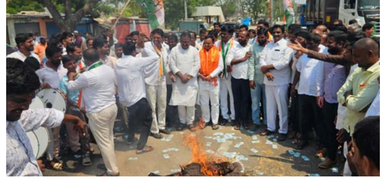
అక్షర విజేత, శివంపేట.