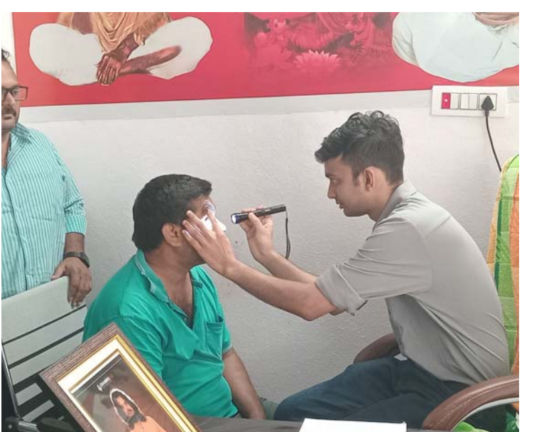
అక్షర విజేత సూర్యాపేట ప్రతినిధి