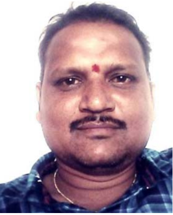
అక్షర విజేత సూర్యాపేట ప్రతినిధి

జిల్లా కేంద్రంలోని 43 వార్డుల్లో వీధి కుక్కలు విపరీతంగా పెరిగిపోయాయని వాటి నుండి ప్రజలను కాపాడాలని జిల్లా కేంద్రంలోని 43 వ వార్డు వేణు నెహ్రూ నగర్ సమీపంలో గత మూడు రోజులుగా వీధి కుక్కలు వీధుల్లో మైర విహారం చేస్తూ చిన్న పిల్లలకు తోడు తోడుగా దాడి పాల్పడుతున్నాడని ఇదే విషయమై మున్సిపల్ అధికారులకు సమాచారం ఇచ్చినప్పటికీ ఎలాంటి చర్యలు చేపడలేదన్నారు. ఇంట్లో నుంచి బయటకు వెళ్లాలంటే ప్రజలు భయపడుతున్నారని తెలిపారు. గత మూడు రోజుల నుంచి ఆరుగురు పైన దాడి చేసి గాయాలు చేసిందని తెలిపారు. ఇప్పటికైనా అధికారులు స్పందించి వీధి కుక్కలను జమున నగర్ లో ఉన్న వీధి కుక్కల సెంటర్ కు తరలించాలన్నారు.