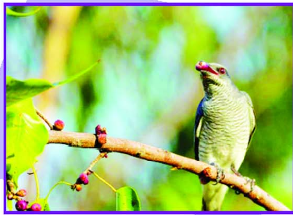
పక్షి స్వరాలు.. మానసిక ఉల్లాసాన్ని సృష్టాయి

పక్షులు చేసే ప్రకృతి అంటే జీవితం చేసే ప్రకృతి అని నిపుణులు చెబుతుంటారని జోగివల్లి సంతోష్ పేర్కొన్నారు. పక్షుల మనసుగద ప్రాముఖ్యతపై అవగాహన కల్పించడం కోసం గ్రీన్ ఇం డియా వారింజ్ లో అంతర్జాగ్రహున్నారు. ఇది అందరికీ ప్రేరణనిస్తుందని తెలిపారు. పక్షుల కిలాకిలా రావాలే మనందం వివరిస్తే అసందాన్ని కలిగిస్తుందనడంలో సందేహం లేదని. పక్షులు చేసే శబ్దాలు మనందం మనసు కుదుపు చేస్తున్నాయి. ఏ మాత్రం అవకాశం ఉన్నా అందమై ప్రకృతిని ఆస్వాదించాలని, బిస్కెట్ పక్షుల స్వరాలను వింటే మానసిక ఉల్లాసం పెరుగుతుందని నిపుణులు చెబుతున్నారని తన పోస్టులో పేర్కొన్నారు.