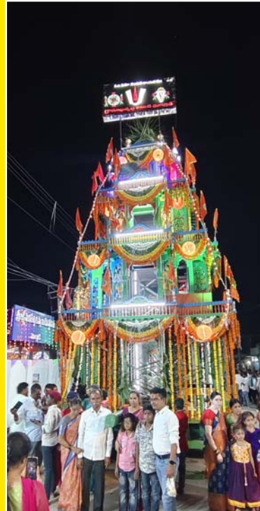
అక్షర విజేత, మోర్లాడ్ :