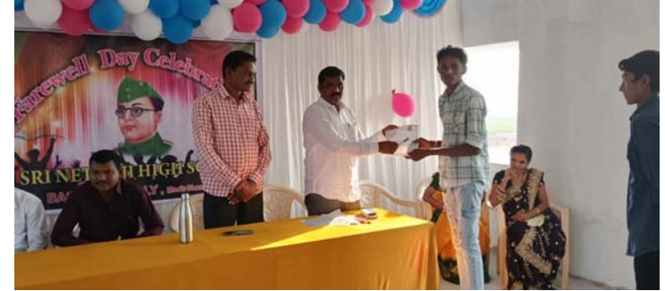
అక్షర విజేత, గణపరం: