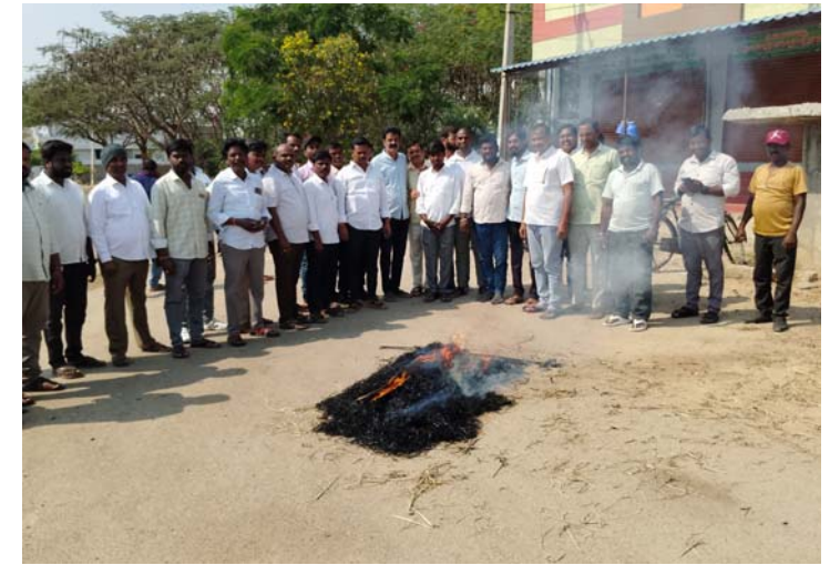
అక్షర విజేత గజ్వేల్ :