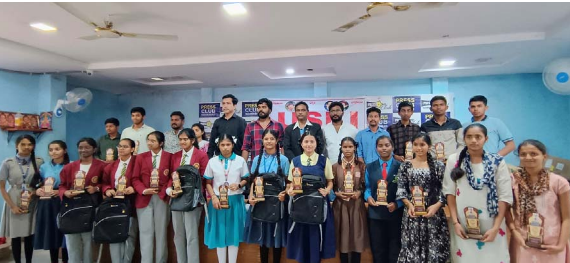
అక్షర విజేత, నిజామాబాద్ ప్రతినిధి :

యుఎస్ఎఫ్ఐ నిజామాబాద్ జిల్లా కమిటీ ఆధ్వర్యంలో ఆదివారం ప్రైవేట్ క్లబ్ లో గత నెల 16వ తేదీని నిర్వహించిన పదవ తరగతి ప్రతిభా పరీక్షల్లో ఉత్తమ ప్రతిభ కనబరిచిన విద్యార్థులకు అభినందన సభ నిర్వహించి, బహుమతులు అందజేశారు. ఈ కార్యక్రమానికి