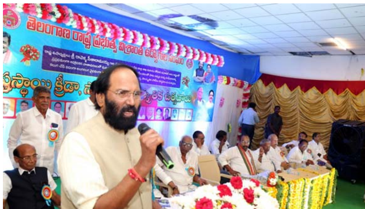
అక్షర విజేత సూర్యాపేట ప్రతినిధి