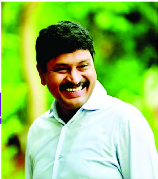
అక్షర విజేత, హైదరాబాద్: