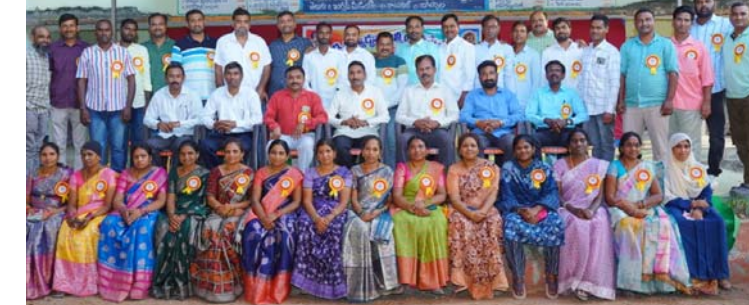
అక్షర విజేత, రాయికల్