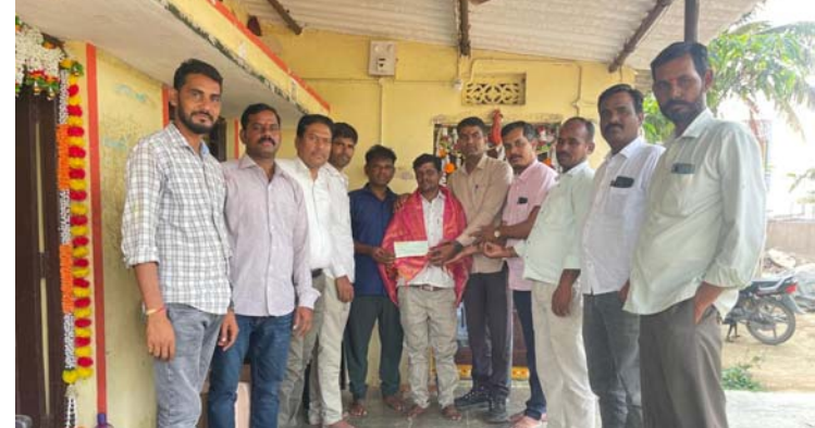
అక్షర విజేత, శివంపేట.