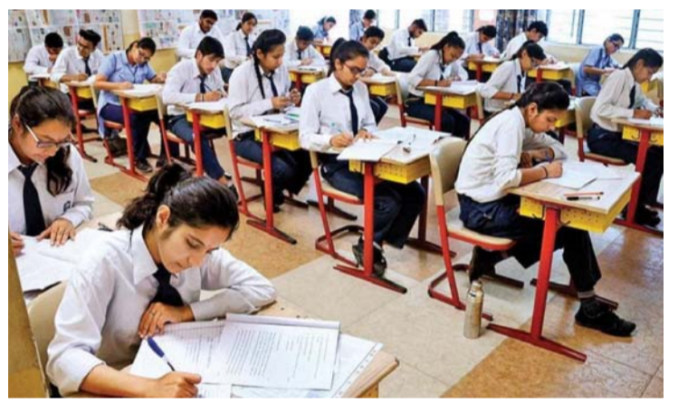
అక్షర విజృంభణ, బాల్కొండ