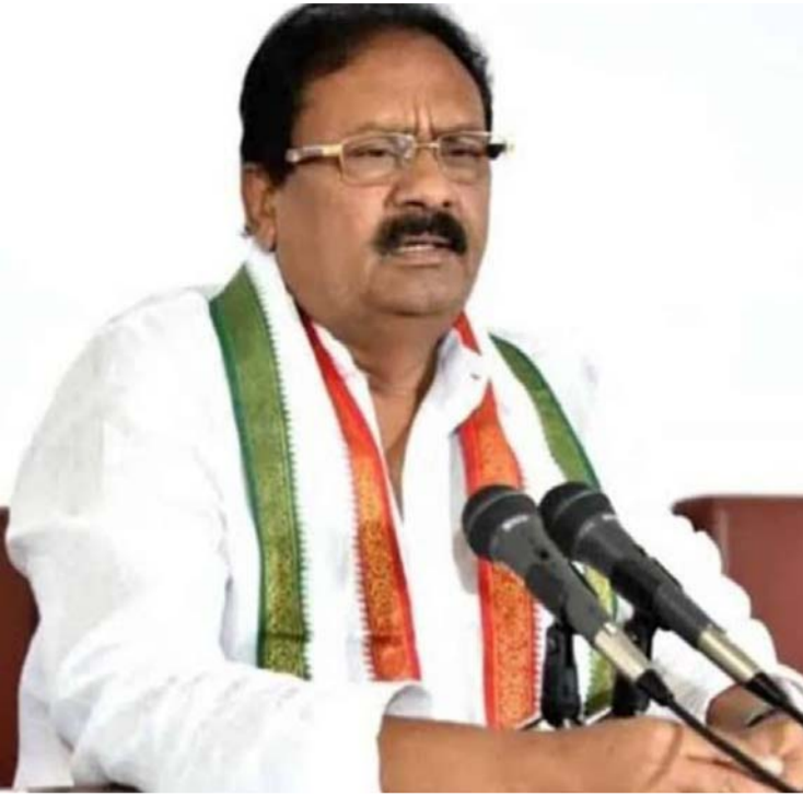
రూ.43 వేల కోట్లకు పైగా నిధులు, సంక్షేమ శాఖలన్నింటికీ కలిపి రూ.40 వేల కోట్లు, విద్యుత్ శాఖకు రూ.21221 వేల కోట్లు, వైద్యశాఖకు రూ.12393 వేల కోట్లు నిధులు కేటాయించారని షబ్దీర్ అలీ తెలిపారు.

బుధవారం అసెంబ్లీలో ప్రవేశ పెట్టిన బడ్జెట్ అందరికీ ఆమోదయోగ్యంగా ఉందని రాష్ట్ర ప్రభుత్వ సలహాదారు మహమ్మద్ అలీ షబ్దీర్ అన్నారు. తాను సలహాదారుగా ఉన్న ఎస్సీ ఎస్సీ బీసీ మైనార్టీ వెల్ఫేర్ శాఖలకు తగిన ప్రాధాన్యం లభించేలా బడ్జెట్లో తగిన ప్రయత్నం చేశామన్నారు. మైనార్టీ శాఖకు రూ.3591 కోట్లు, ఎస్సీ సంక్షేమానికి 40232కోట్లు, ఎస్సీ సంక్షేమానికి 17169 కోట్లు, బీసీ సంక్షేమానికి 11405 కోట్లు, మూడు లక్షల నాలుగు,వేల 965 కోట్లతో అన్ని వర్గాలకు సముచిత న్యాయం చేసే విధంగా తెలంగాణ బడ్జెట్ వ్యవస్థాపన అనుబంధ రంగానికి పెద్ద పీట వేస్తూ 24439 కోట్లు కేటాయించారని మహమ్మద్ అలీ షబ్దీర్ తెలిపారు. స్త్రీ శిశు సంక్షేమానికి 2862 కోట్లు, వైద్య ఆరోగ్య శాఖకు 12,393 కోట్లు, విద్య రంగానికి 28108 కోట్లు, నిరుద్యోగ యువతకు ఉద్యోగావకాశాలు కల్పించే ఉద్దేశంతో జాబ్ క్యాలెండర్ విడుదల చేస్తామన్నారు. వ్యవసాయ రంగానికి నీటిని అందించడానికి నీటిపారుదల శాఖకి 27373 కోట్లు కేటాయించి రైతు పక్షపాతి ప్రభుత్వంగా ముద్రం వేసుకున్నామని తెలిపారు. పట్టణాభివృద్ధి తో పాటు పల్లెల అభివృద్ధికి బడ్జెట్లో పెద్దపీట వేశామన్నారు. తెలంగాణ ప్రభుత్వం ప్రవేశపెట్టిన పూర్తిస్థాయి వారిక్ష బడ్జెట్లో మహిళల సంక్షేమానికి అధిక ప్రాధాన్యత ఇచ్చామని తెలిపారు. వారిని కోటిశ్రమలను చేయాలనే సంకల్పంతో పలు పథకాలను ప్రతిపాదించిన రేవంత్ సర్కారు గ్రామీణ మహిళాభివృద్ధికి ఇందిరా మహిళా శక్తి పథకం, ప్రభుత్వం సంక్షేమం, అభివృద్ధి రంగాలకే బడ్జెట్లో అధికంగా నిధులు కేటాయించారని తెలిపారు. ఎన్నికల్లో కాంగ్రెస్ పార్టీ ఇచ్చిన 6 గ్యారంటీ హామీల అమలుకు దాదాపుగా రూ.56084 వేల కోట్లకు పైగా నిధులు ముఖ్యంగా రైతు భరోసా పథకానికి రూ.18 వేల కోట్లతో కలిపి ఒక్క వ్యవసాయ శాఖకే అత్యధికంగా