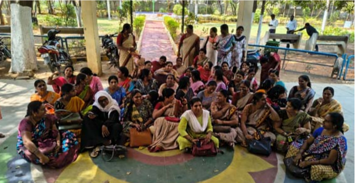
అక్షర విజేత, కుత్బుల్లాపూర్

కుత్బుల్లాపూర్ మున్సిపల్ కార్యాలయం ముందు ఎన్యూమరేటర్ల ధర్మా నిర్వహించారు. కులగణన సర్వేలో భాగంగా పని చేసిన తమకు వేతనాలు ఇవ్వకుండా అధికారులు నిర్లక్ష్యం పవీస్తున్నారని ఆరోపిస్తూ అందోషనకు దిగారు. డిప్యూటీ కమిషనర్ వెంటనే స్పందించి తమకు వేతనాలు వచ్చేలా వైఅధికారులతో మాట్లాడి తమకు న్యాయం చేయాలని డిమాండ్ చేశారు.