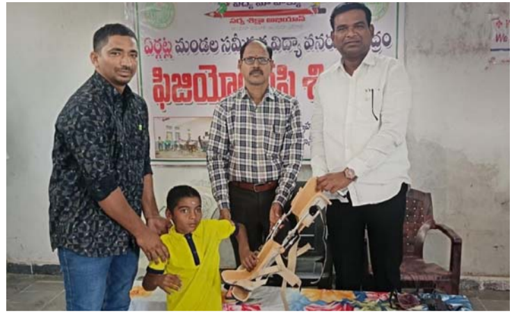
అక్షర విజృంభణ, ఏర్లపల్లి