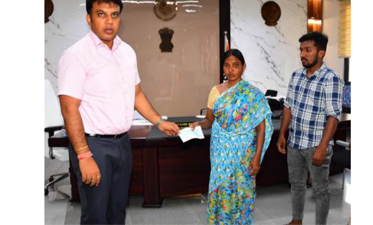
అక్షర విజేత, రాజన్న సిరిసిల్ల ప్రతినిధి :