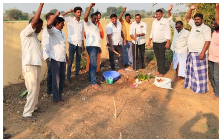
అక్షర విజృంభణ, మోర్లాడ్