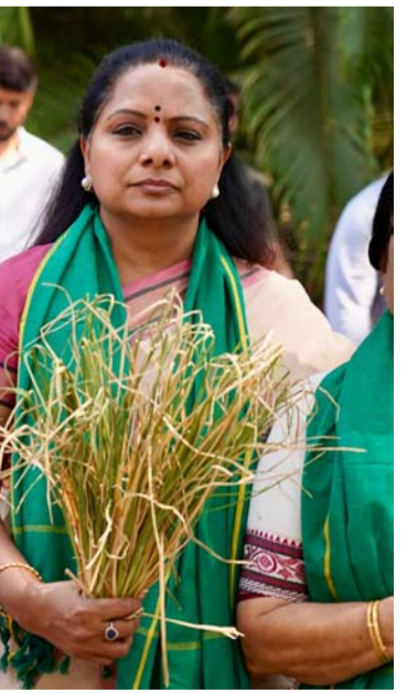
రైతులకు నీళ్లు ఇవ్వాలని కవిత డిమాండ్ చేశారు.

ద్వారా చెరువులు నింపారని గుర్తు చేశారు. కాంగ్రెస్ పాలనలో ఆయకట్టు కింద ఉన్న పొలాలు కాదా ఎండిపోవడానికే విముఖులైనా మార్పు లోనే ఈవిధంగా ఉంటే ఏప్రిల్, మే నెల లో రైతుల పరిస్థితి దయనీయంగా ఉంటుందన్నారు. ఆంధ్రప్రదేశ్ సీఎం చంద్రబాబు నాయుడు 10వేల క్యూసెక్కుల నీళ్లు ఎత్తుకుపోతుంటే చూస్తూ ఉరుకుంటున్నారని మండిపడ్డారు. హైదరాబాద్ లో వాటర్ ట్యాంకర్లు పెరిగాయన్నారు. కేసీఆర్ రైతుల కోసం కాశీశ్వరం ప్రాజెక్ట్ కట్టించారని ఆయన మీద కోపంతో ఆ నీళ్లు వాడుకోక పోవడం కండ్లీ కాదన్నారు. ఇప్పటికైనా ఉన్న నీటి వనరులు వాడుకొని