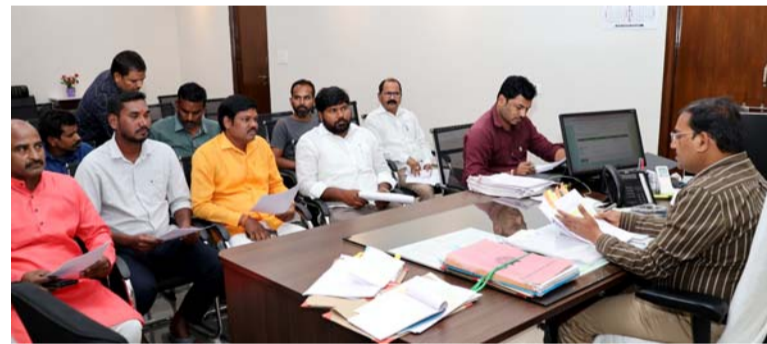
అదనపు కలెక్టర్ లింగాయక్ సమావేశం

సందర్భంగా ఆయన మాట్లాడుతూ, యువతలో ఓటు ప్రాముఖ్యతను కలిగి ఉండేవిధంగా 18 సంవత్సరాలు నిండిన ప్రతి ఒక్కరూ ఫారం 6 ద్వారా ఓటరుగా నమోదు చేసుకోవాలన్నారు. ఓటరుగా నమోదు చేసుకోవడం నిరంతర ప్రక్రియ అని తెలిపారు. మీసేవ, ఆన్ లైన్ , హెల్ప్ లైన్, మొబైల్ ద్వారా ఓటరుగా నమోదు చేసుకోవచ్చని ఆయన తెలిపారు. ఫారం 7 ద్వారా మార్పులు చేర్పులు చేసుకోవచ్చని అదేవిధంగా ఫారం 8 ద్వారా ఓటరు బదిలీ, పోలింగ్ కేంద్రం బదిలీ, కుటుంబ పథ్యాల ఒకే పోలింగ్ కేంద్రానికి మార్పుకోవడం, ఓటరు బడిలో