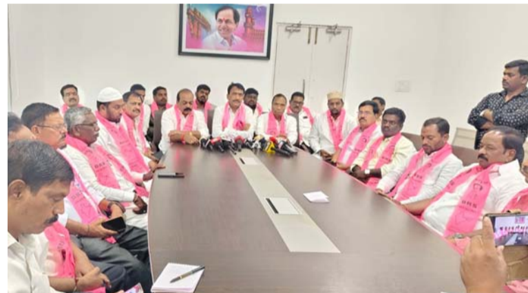
నియోజకవర్గ కమిటీ సమావేశం

నిర్మాణాలు, బస్టాండ్ ల నిర్మాణాలు, డబుల్ డెడ్ రూమ్ లో నిర్మాణాలు ఇలా చెప్పుకుంటూ పోతే దాదాపు పది సంవత్సరాల కాలంలో పదివేల కోట్ల అభివృద్ధి చేసిన ఘనత కేసీఆర్ ది అన్నారు. గజ్వేల్ నియోజకవర్గం కెసిఆర్ హయాంలో అభివృద్ధిలో 50 సంవత్సరాలు ముందుకెళ్ళిందన్నారు. కెసిఆర్ గజ్వేల్ యొక్క రూపు రేఖలను మార్చారన్నారు