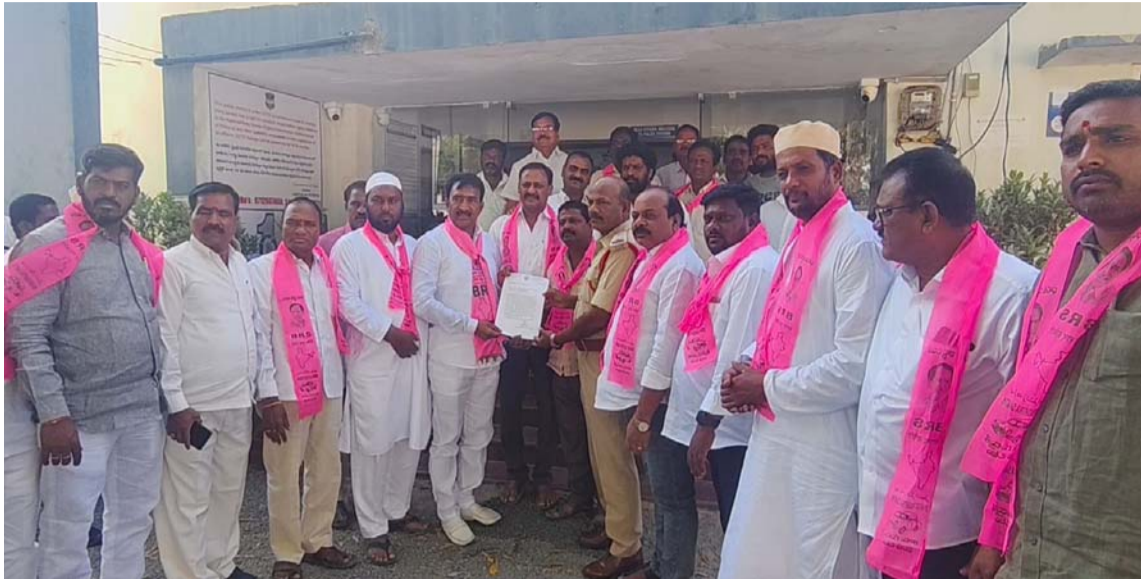
అక్షర విజేత గజ్వేల్: