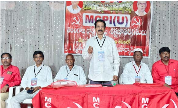
అక్షర విజేత సూర్యాపేట ప్రతినిధి

యుద్ధం విరమణకు ప్రయత్నం చేస్తున్నామని అంటూ నిన్నటి కి నిన్న హామీ పై ఇజ్రాయెల్ ద్వారా సాగించిన మెరుపు దాడులు క్షీణిస్తున్న పరిణామాలు తేటతెల్లం చేస్తున్నాయి అని విమర్శించారు. సామ్రాజ్య వాదం మొత్తం అంతా యుద్ధాల బయట అని దీనికి వ్యతిరేకంగా పోరాడాలని అన్నారు. మరోవైపు పెట్టుబడి దారీ వ్యవస్థ శాశ్వతం కాదు అని శ్రీ లంక పరిణామం తెలుపుతున్నది అని, శ్రీ లంకలో వామపక్ష ప్రభుత్వం అధికారంలోకి వచ్చింది అని ఈ పరిణామం గమనిస్తే దోపిడీ అసమానతలతో కార్టూరేట్ సంపన్న వర్గాల బారిన ప్రజలు ఎక్కువ కాలం మన జాలరని తిరుగు బాటు తప్పం అని అన్నారు. యంసిపిఐ (యు) కార్యకర్తలు