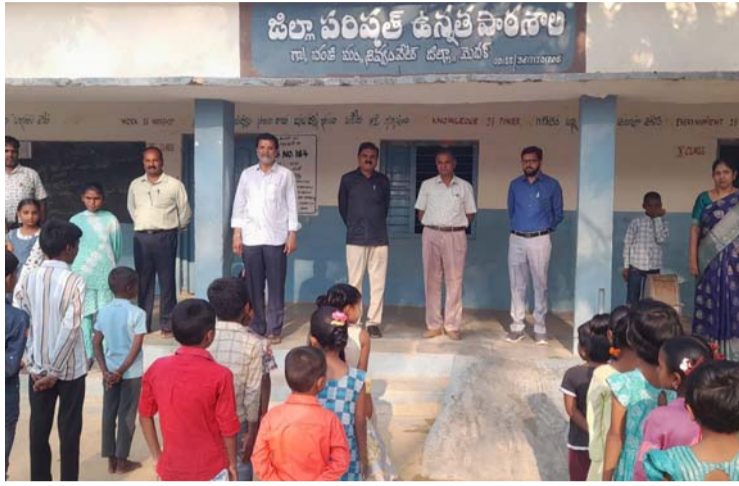
అక్షర విజేత, శివంపేట.