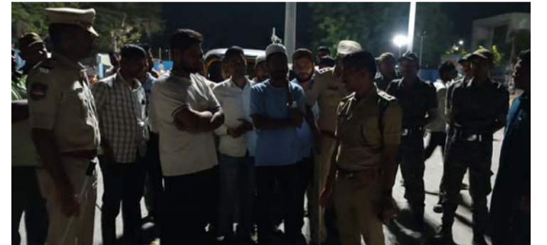
అక్షర విజేత, నిజామాబాద్ ప్రతినిధి

నిజామాబాద్ నగరంలోని ఎల్ఐసీ ఛౌరస్తా, డేవి రోడ్ ఛౌరస్తా, పులంగ్ ఛౌరస్తా, ఆర్ఆర్ ఛౌరస్తా, పెద్ద బజార్, నెహ్రూ పార్క్ హైమది బజార్, బోధన్ బస్టాండ్, రైల్వే స్టేషన్, ఆర్టీసీ బస్టాండ్లను ఆకస్మికంగా తనిఖీ నిర్వహించారు. ఈ సందర్భంగా ఆయా ప్రాంతాల్లో వాహనాల రాకపోకలు, ప్రజల భద్రత, ప్రమాదాలు, దొంగతనాలు తదితర వివరాలను తెలుసుకున్నారు. ఈ సందర్భంగా ఆటో డ్రైవర్ల వాహనాలకు సంబంధించిన పేపర్ల చెక్ చేసారు. ఎలాంటి పని లేకుండా రాత్రి సమయంలో తిరిగి యువతకు కౌన్సిలింగ్ నివాహించారు. ఆర్టీసీ బస్టాండ్, రైల్వే స్టేషన్ లో, పరిసర ప్రాంతాలలో ముప్పుగంగా తనిఖీలు నిర్వహించారు. అక్కడ గల అధికారులకు పలు సూచనలు ఇచ్చారు.