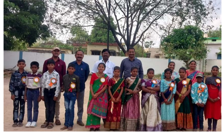
అక్షర విజేత, గణపరం: