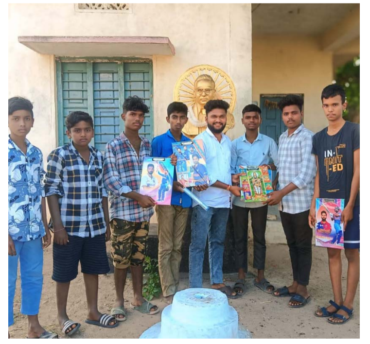
అక్షర వివేక ఇల్లంతకుంట: