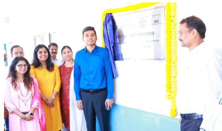
అక్షర విజేత సిద్దిపేట

జిల్లా కలెక్టర్ మాట్లాడుతూ 6 నెలల క్రితం ఈ స్కూల్ కి వచ్చినప్పుడు డివిజన్ ఐజి కలెక్టర్ తో మాట్లాడి సెల్స్ ఫోర్స్ నంబరు మరియు నిర్మాణ విస్తీర్ణం సంస్థ సహకారంతో 20 లక్షల రూపాయలు ఖర్చు చేసి కంప్యూటర్ ల్యాబ్ ఏర్పాటు చేయడం జరిగిందని అన్నారు. మీ