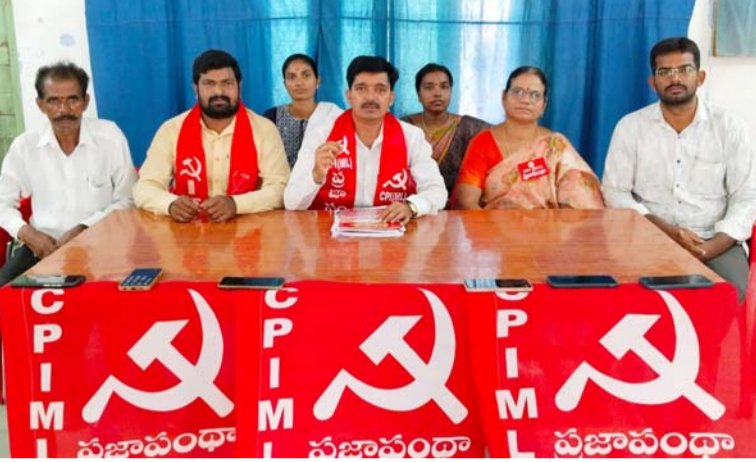
అక్షర విజేత, నిజామాబాద్ ప్రతినిధి

ప్రభుత్వ జనరల్ ఆసుపత్రి డైట్ టెండర్ ను అర్జులైన వారికే ఇవ్వాలని సీపీఐ (ఎం.ఎల్) మాన్ లైన్ (ప్రజాపంథా) నగర కమిటీ డిమాండ్ చేశారు. గురువారం నగరంలోని కోటగల్లిలో ఎన్.ఆర్ భవన్ లో విలేజ్ కుల సమావేశం నిర్వహించారు.