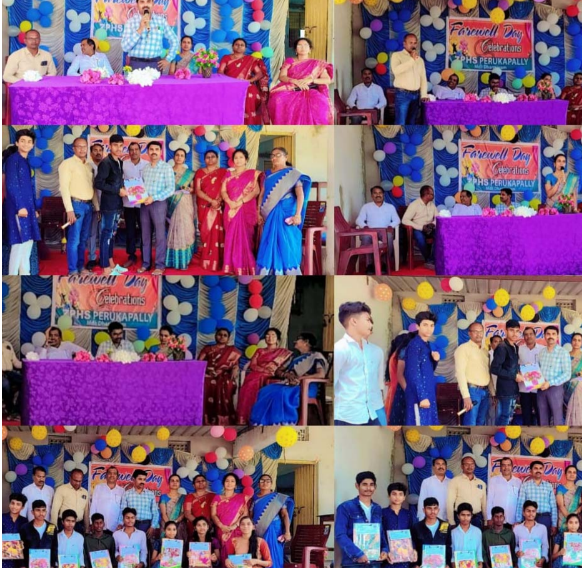
అక్షర విజేత, చొప్పడండి: