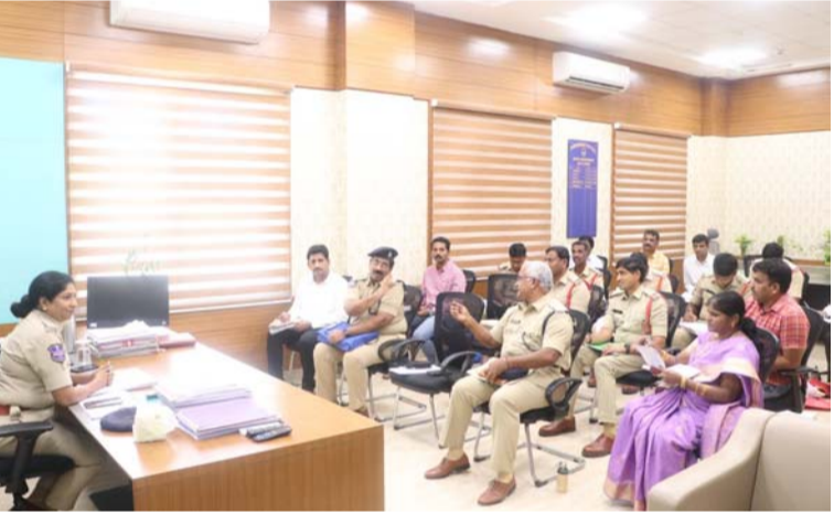
అక్షర విజేత సిద్దిపేట

పదవ తరగతి పరీక్షల సందర్భంగా పటిష్టమైన బంధోబస్సు ఏర్పాటు చేయాలి ఫిర్యాదుదారులతో మర్యాదగా మాట్లాడి వారి సమస్యను పరిష్కరించాలి రాబోవు స్థానిక సంస్థల ఎన్నికల సందర్భంగా ముందస్తు ప్రణాళికలు తయారు చేసుకోవాలి లాంగ్ పెండింగ్ కేసులు త్వరగా డిస్పోజిట్ చేయాలి రోడ్డు ప్రమాదాల నివారణ గురించి తగు జాగ్రత్త చర్యలు తీసుకోవాలి