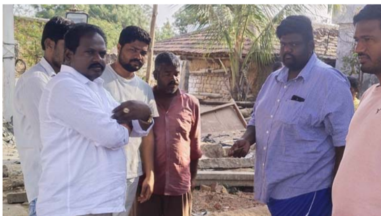
అక్షర వివేక గజ్వేల్ :