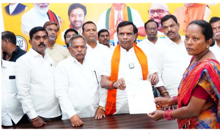
అక్షర విజేత, నిజామాబాద్ ప్రతినిధి

లబ్ధిదారులకు సీఎంఆర్ఎఫ్ కింద ఇచ్చే ఆర్థిక సహాయం మొత్తాన్ని మరింత పెంచాలని అర్బన్ ఎమ్మెల్యే ఎమ్మెల్యే డన్ పాల్ సూర్యనారాయణ ప్రభుత్వాన్ని కోరారు. ఎమ్మెల్యే క్యాంపు కార్యాలయంలో నిర్వహించిన సీఎంఆర్ఎఫ్ చెక్కుల పంపిణీ కార్యక్రమానికి ముఖ్యఅతిథిగా నిజామాబాదు