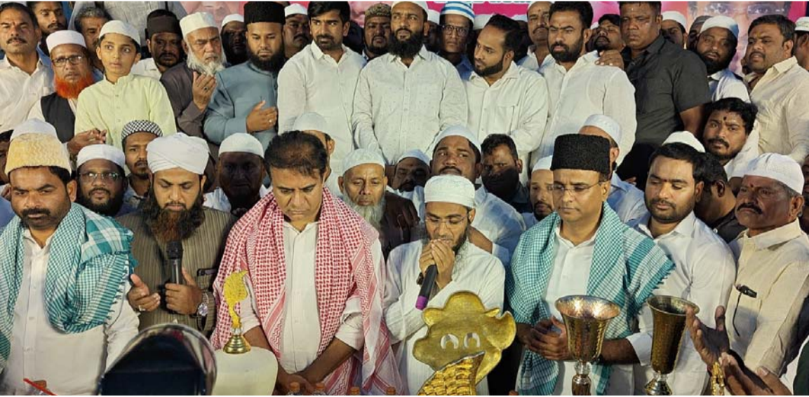
అక్షర విజేత, కుత్బుల్లాపూర్: