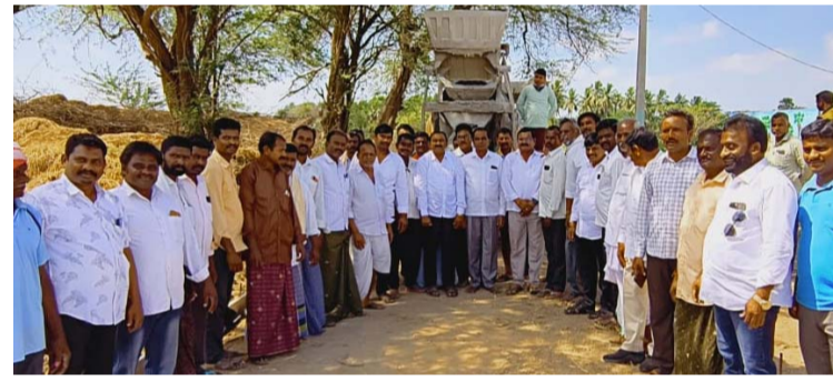
అక్షర విజేత గరిడెపల్లి