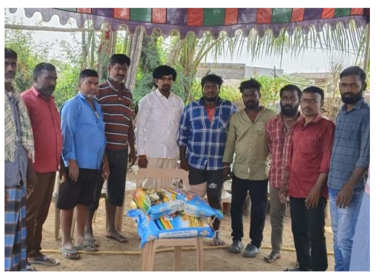
అక్షర వివేక ఇల్లంతకుంట: